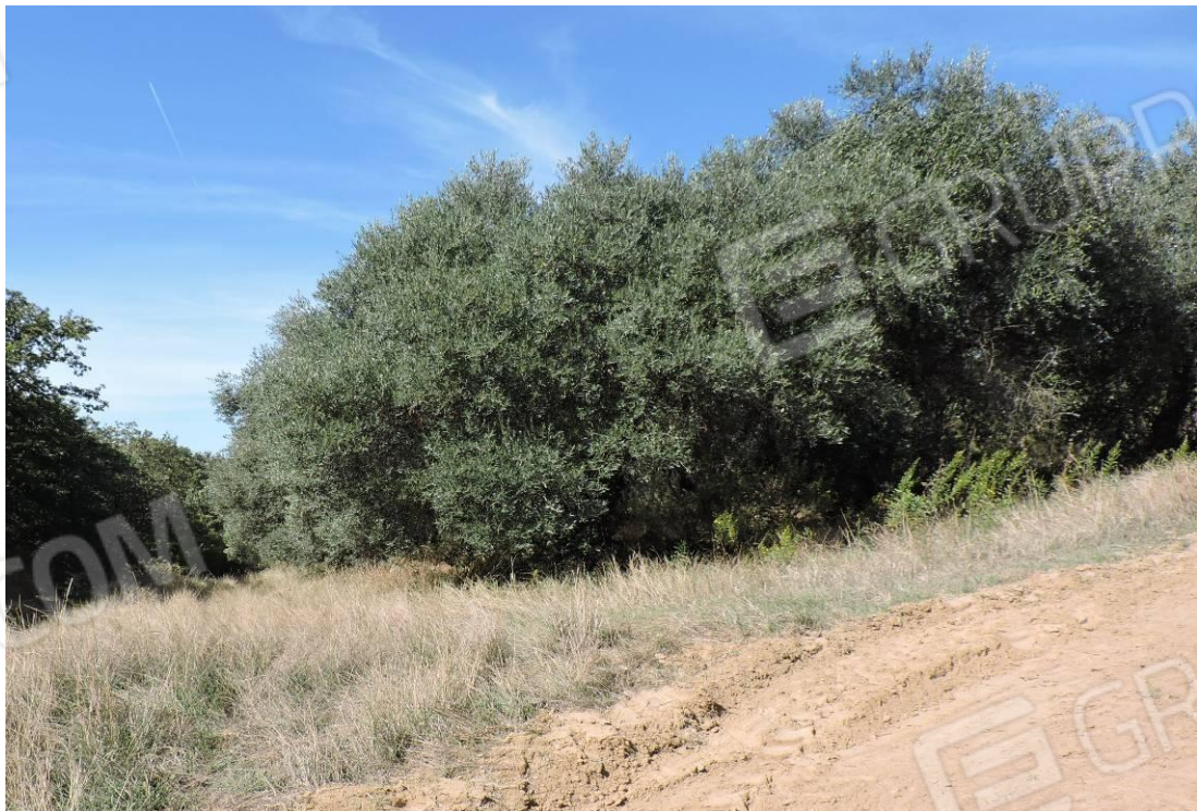
Accessibilità al corpo fondiario con indicazione dell'investitura; Vista dell'oliveto dalla strada di accesso.