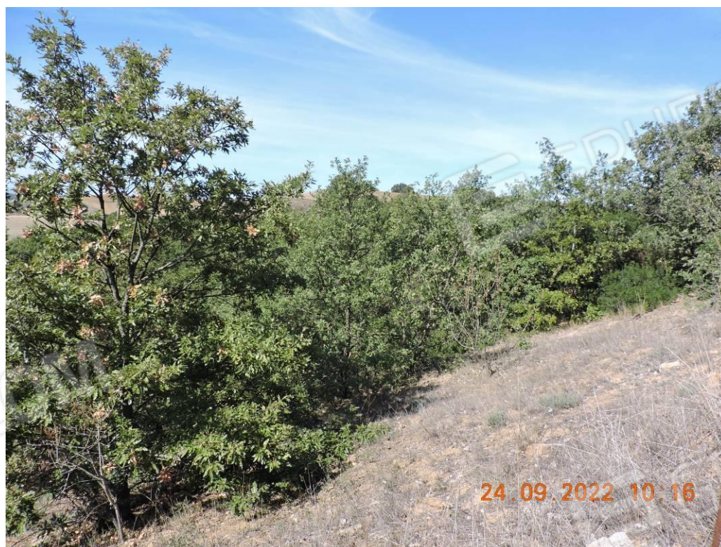
Viste della selva nella particella 378.

Tribunale di Bari - Sez. Esecuzioni Imm.ri - Procedura n. R.G.E. 550/2021- G.E. Dott. Ruffino.