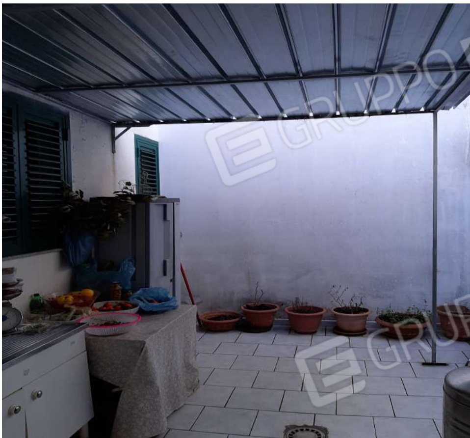
Foto n. 10 veranda con copertura di protezoine aperta