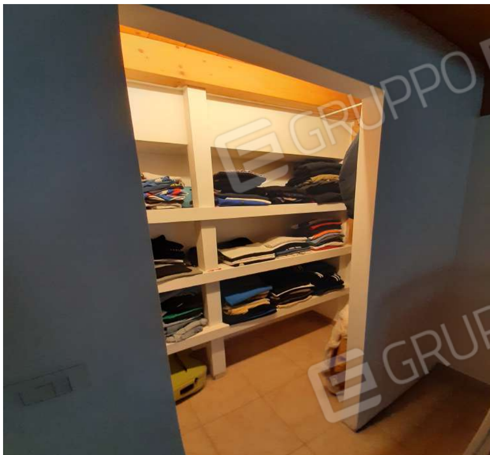
Foto n. 34 ripostiglio