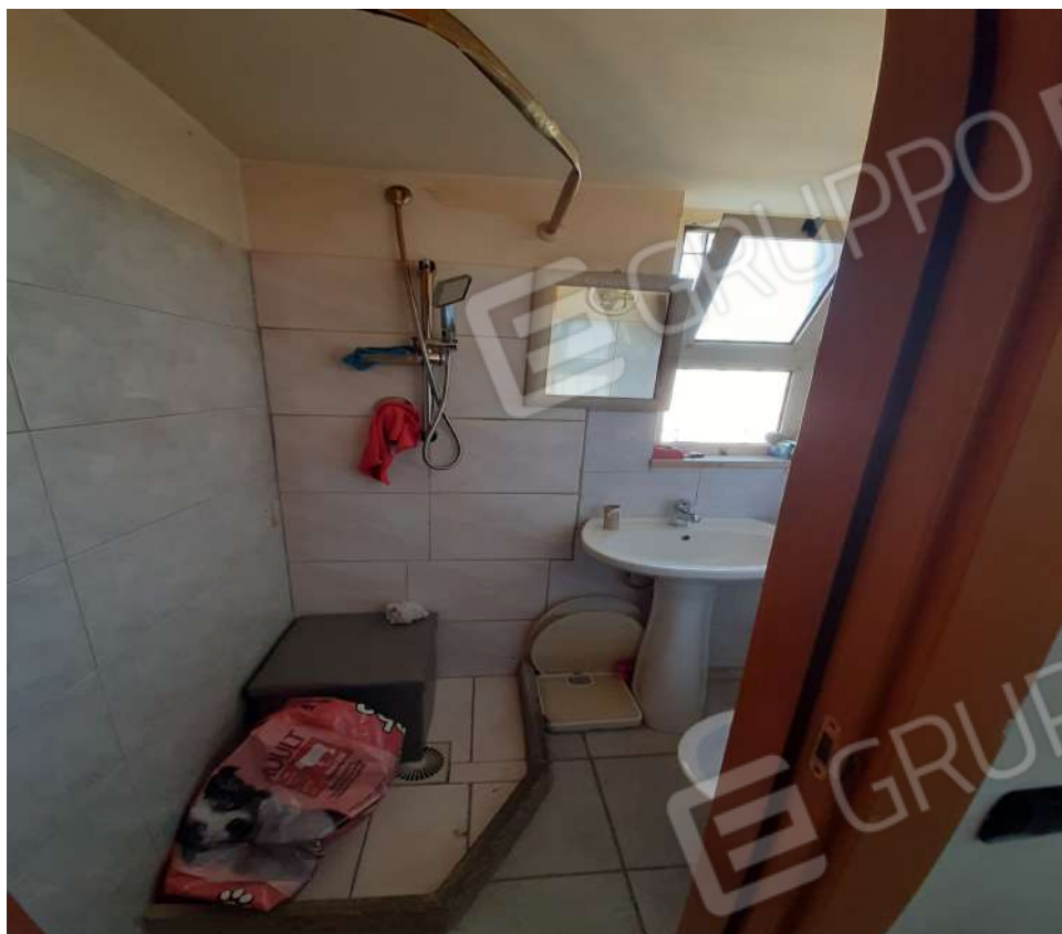
Foto n. 28 wc