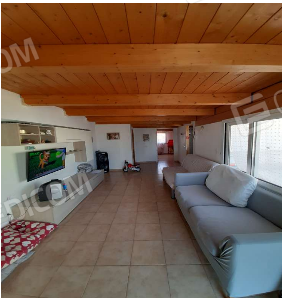
Foto n. 31 soggiorno