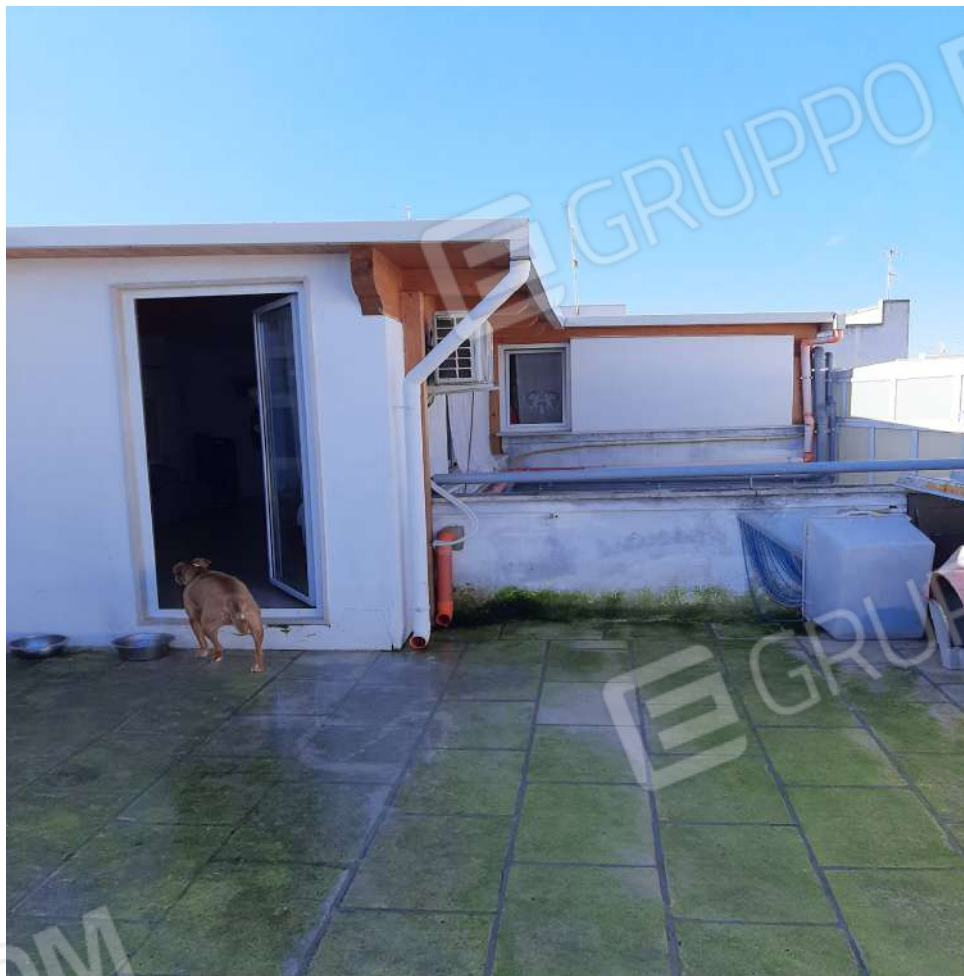
Foto n. 36 vista esterno con lastrico