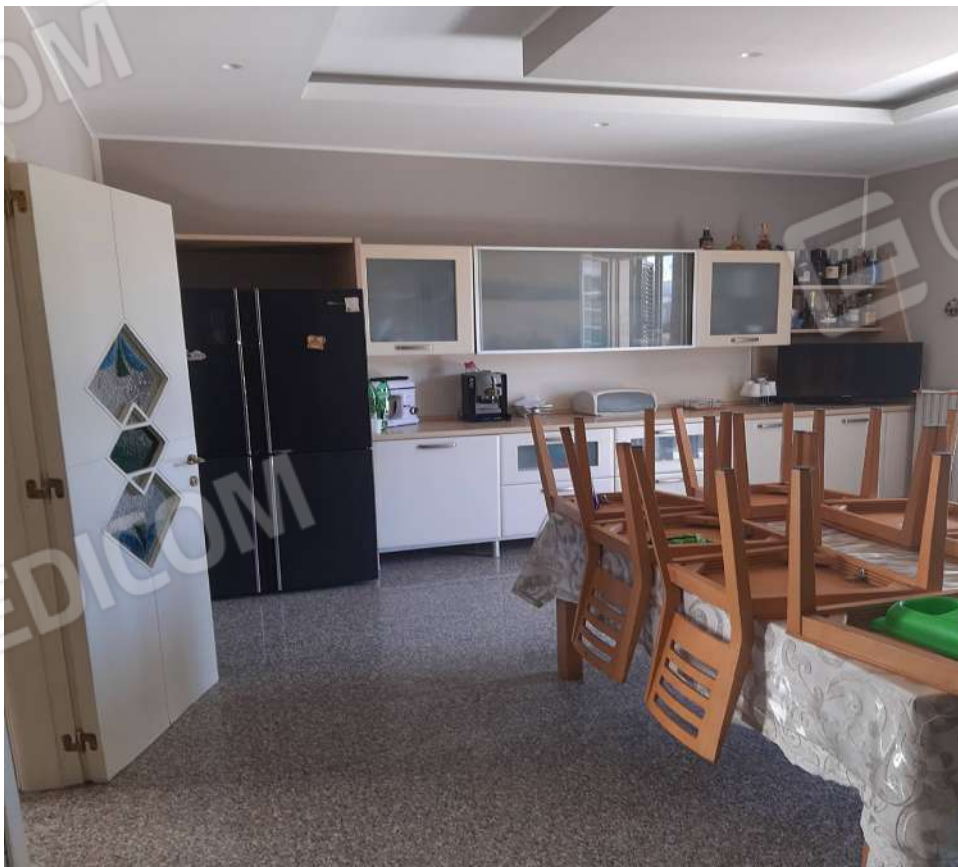
Foto n. 7/2 soggiorno pranzo