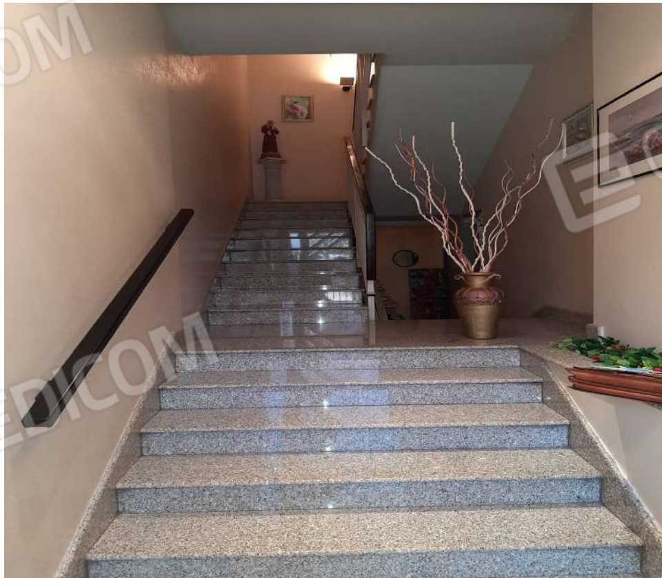
Foto n. 4 Interno androne con scala accesso P.T. e P.S.1