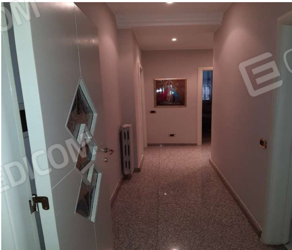
Foto n. 11 vista corridoio alla zona notte dal soggiorno