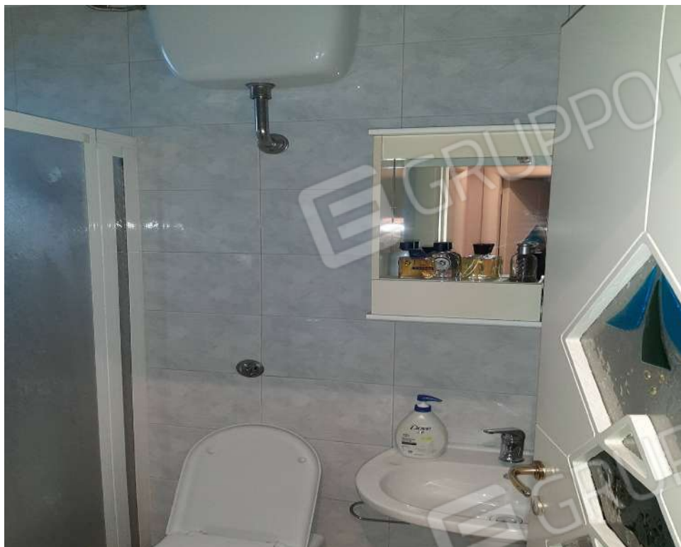
Foto n. 14 secondo bagno con doccia