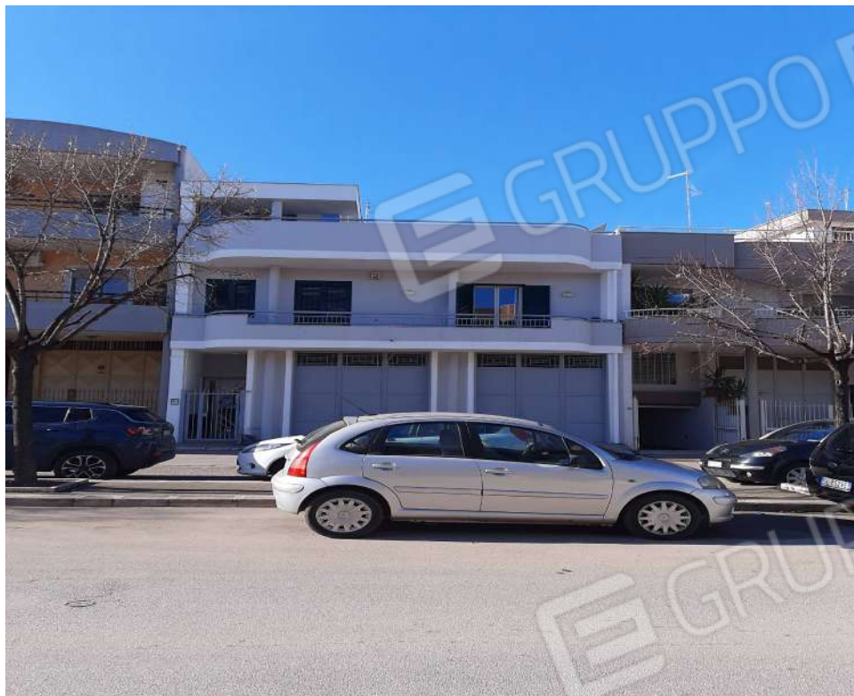
Foto n. 1 Prospetto