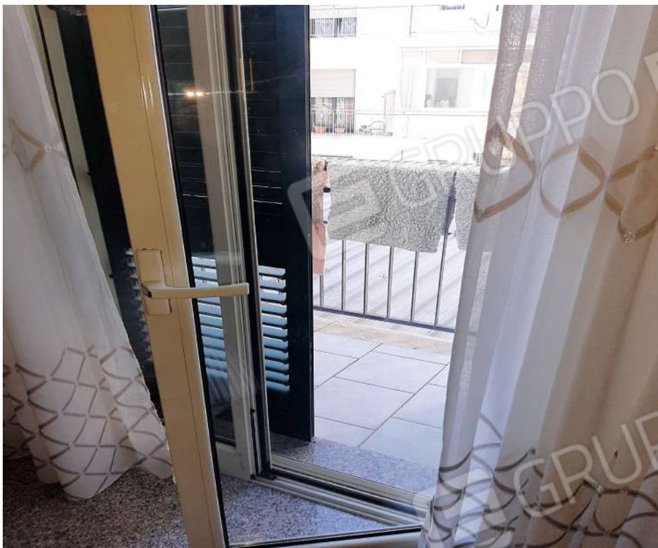
Foto n. 16 particolare finestra con persiana