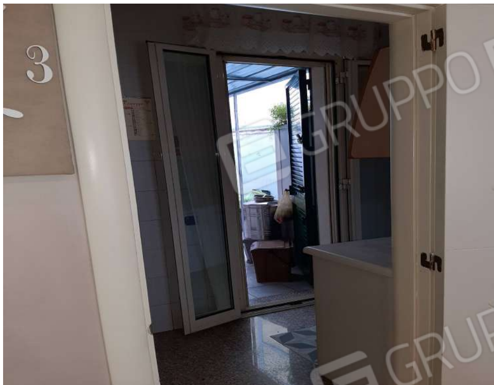
Foto n. 8 accesso alla cucina