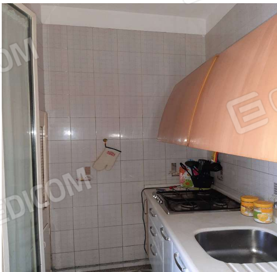
Foto n. 9 cucina