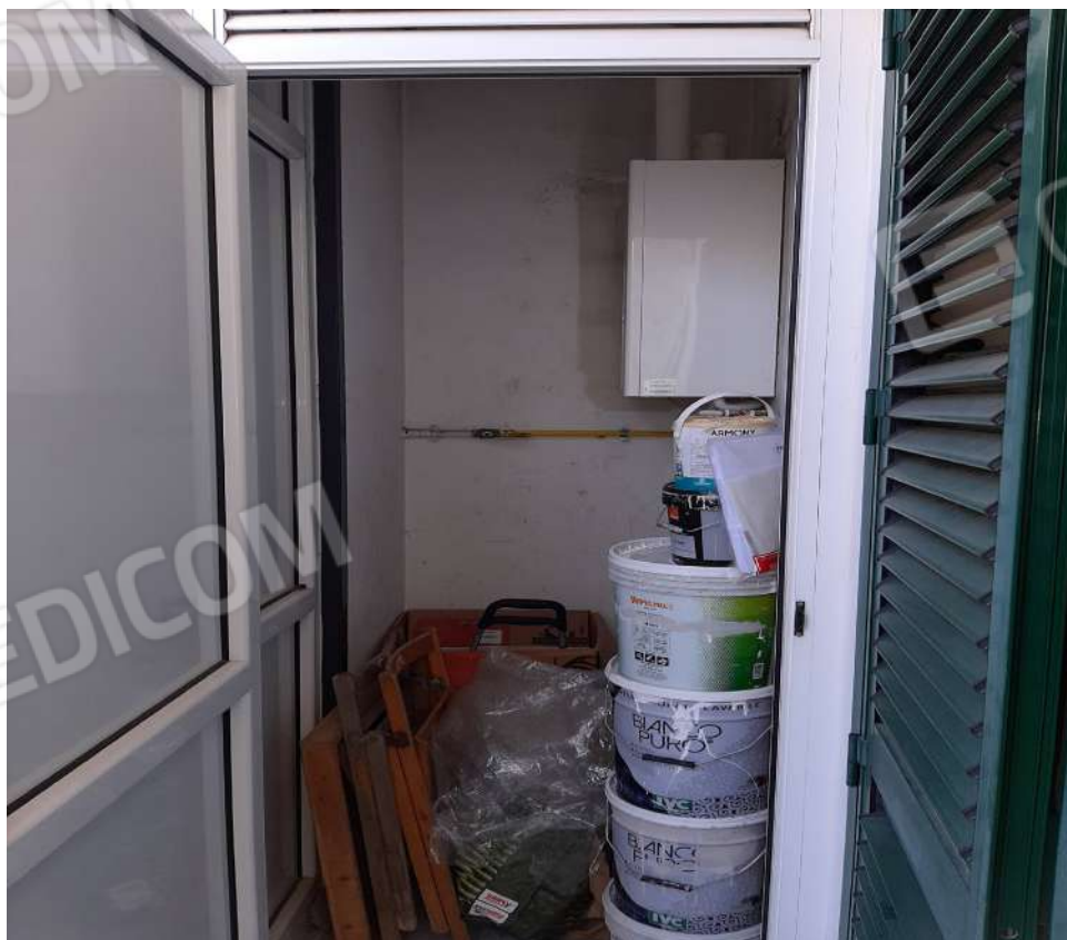
Foto n. 19 ripostiglio esterno lato dx balcone