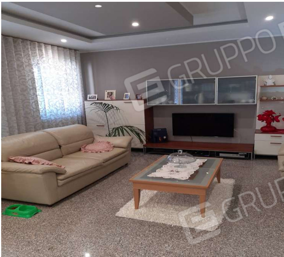
Foto n. 7/1 soggiorno pranzo