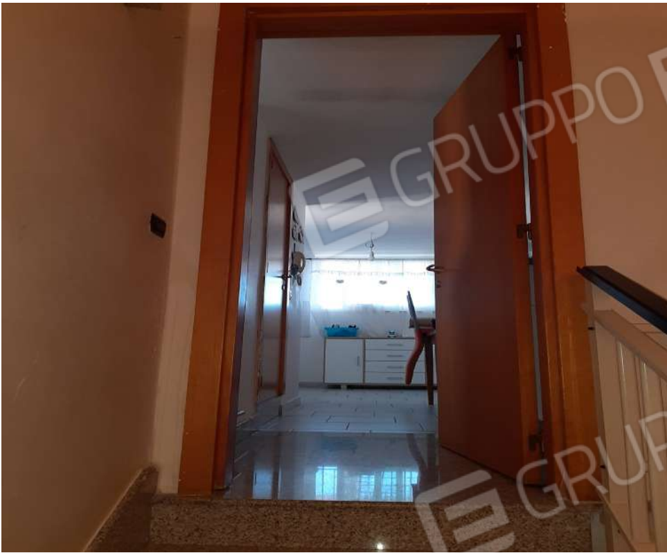
Foto n.26 accesso dal vano scala alla cucina del P.2