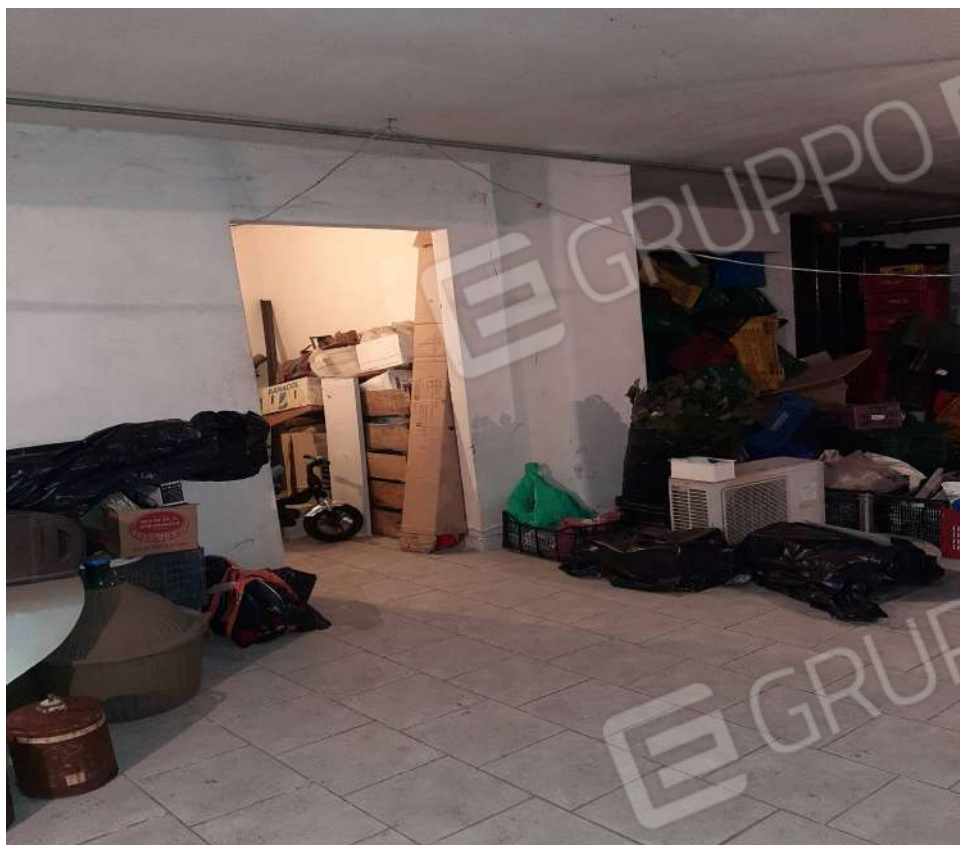
Foto n. 23 P.S.1 vista accesso dal vano scala con locale a lato destro