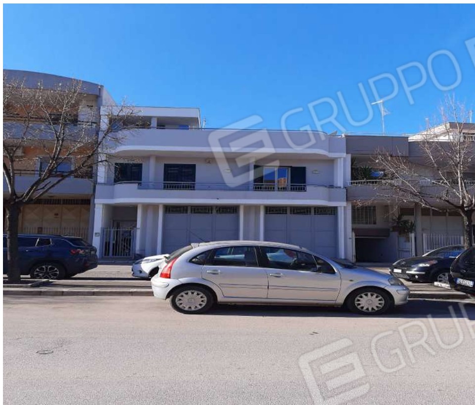
Foto n. 37 vista esterno portoni accesso al P.T. civici nn. 7/A - 7/B