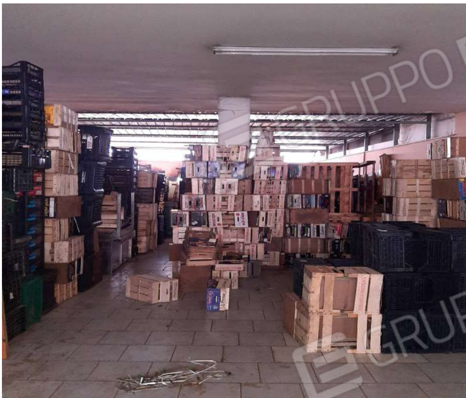
Foto n. 39 vista complessiva del locale con copertura del cortile