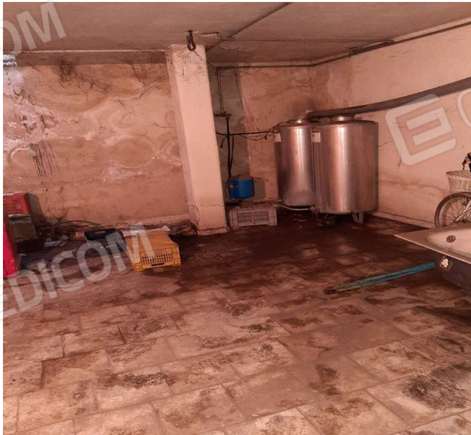
Foto n. 25/2 vista interna zona autoclave P.S.1.