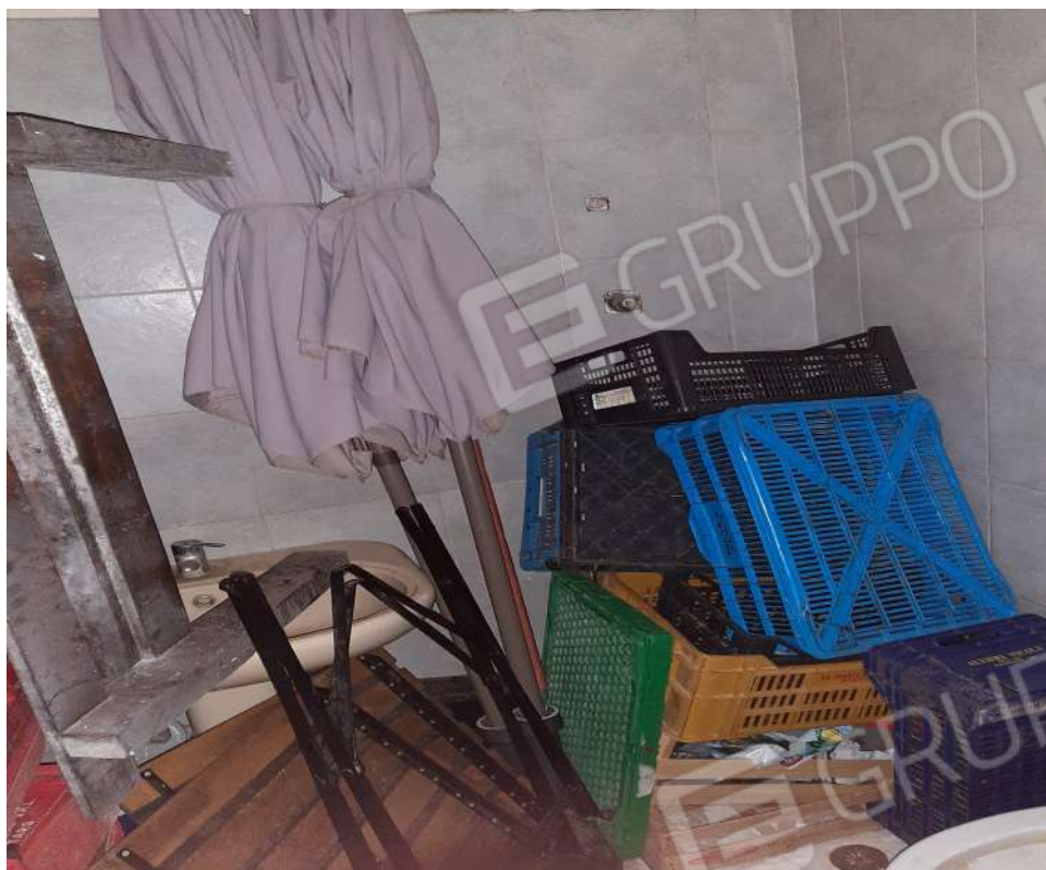
Foto n. 43 vano bagno