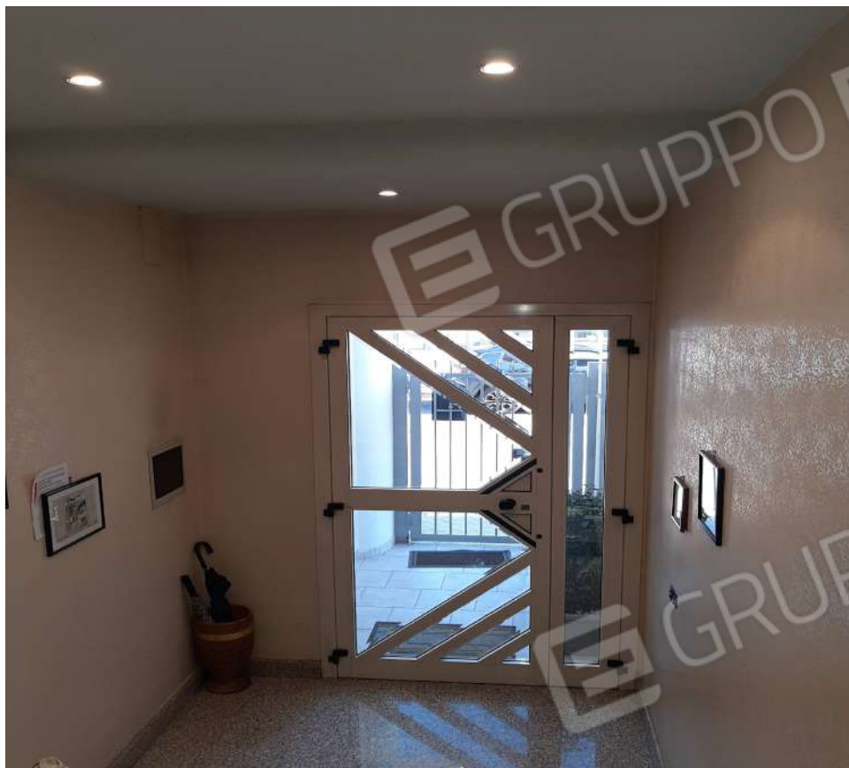
Foto n. 3 Interno portone