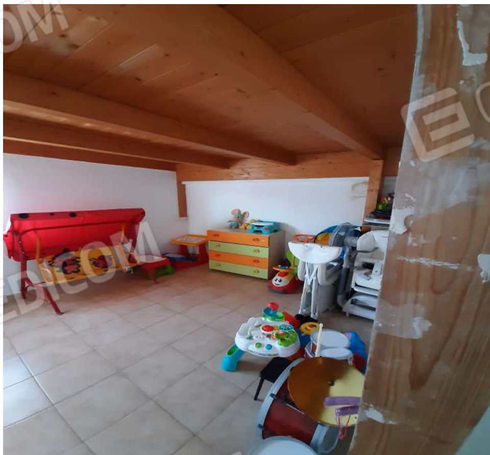
Foto n. 35 stanza