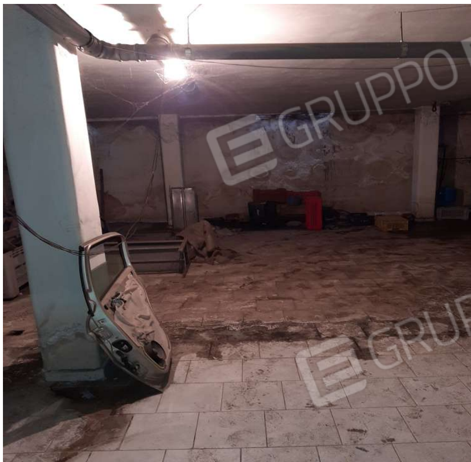
Foto n. 25/3 vista interna P.S.1.