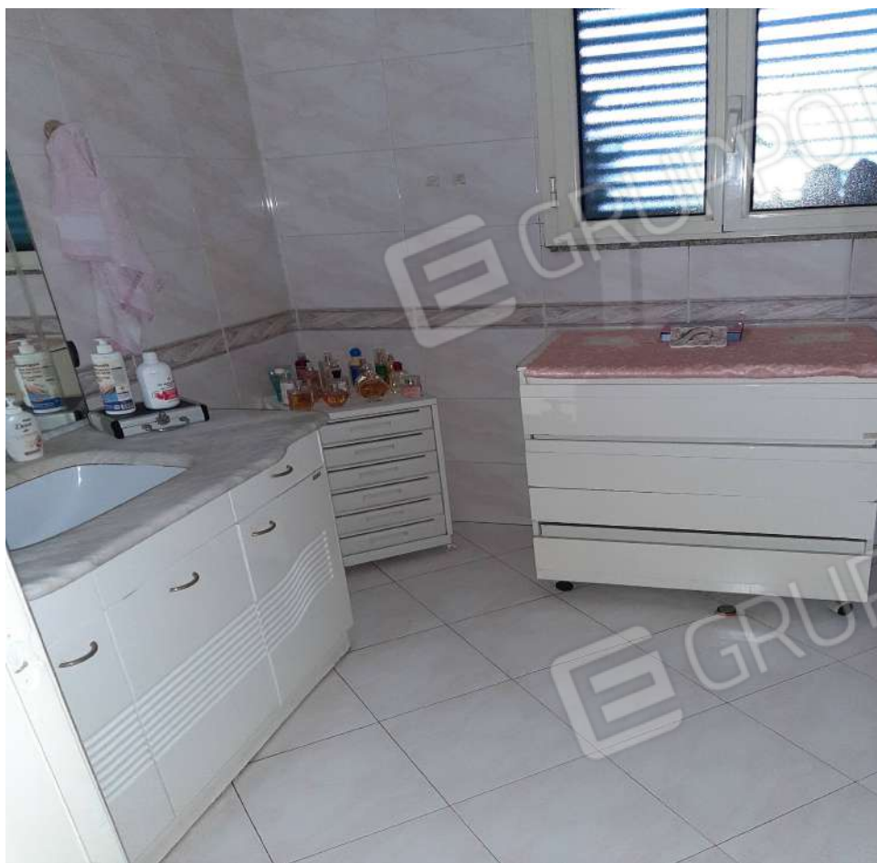
Foto n. 12 primo bagno