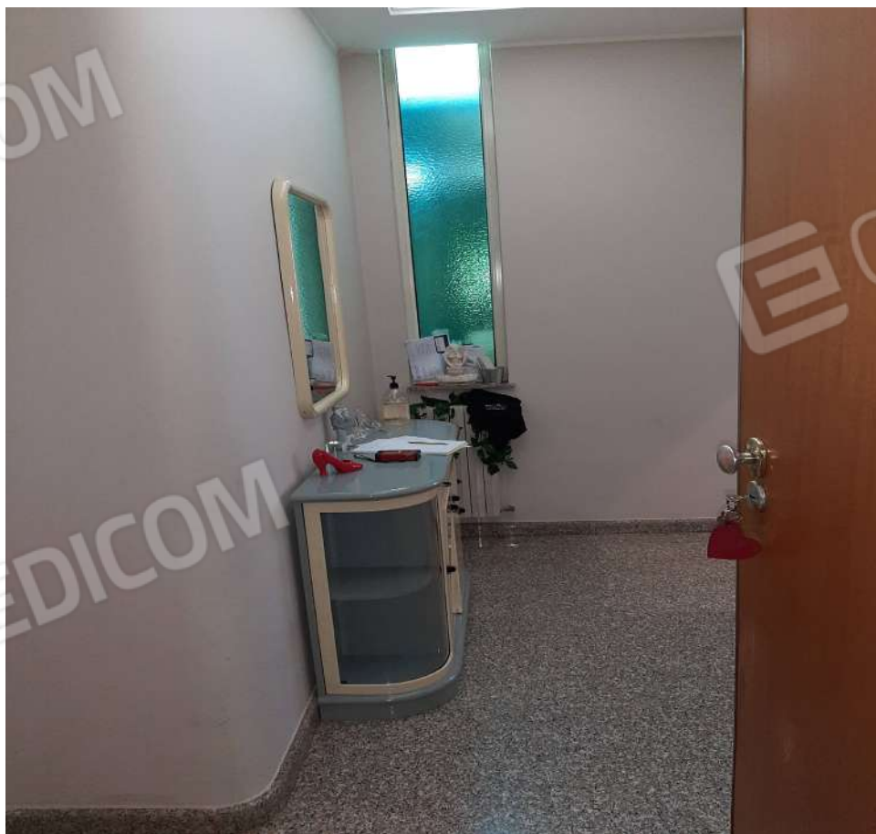
Foto n. 6 ingresso