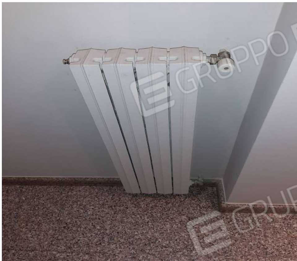
Foto n. 20 termosifone