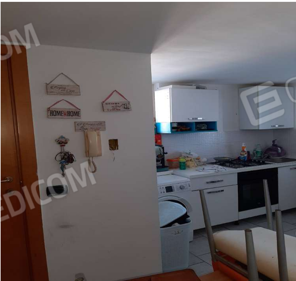
Foto n. 27 cucina