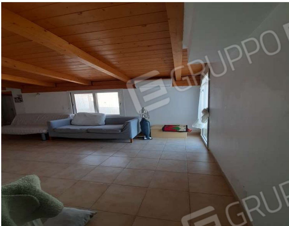
Foto n. 30 ingresso soggiorno