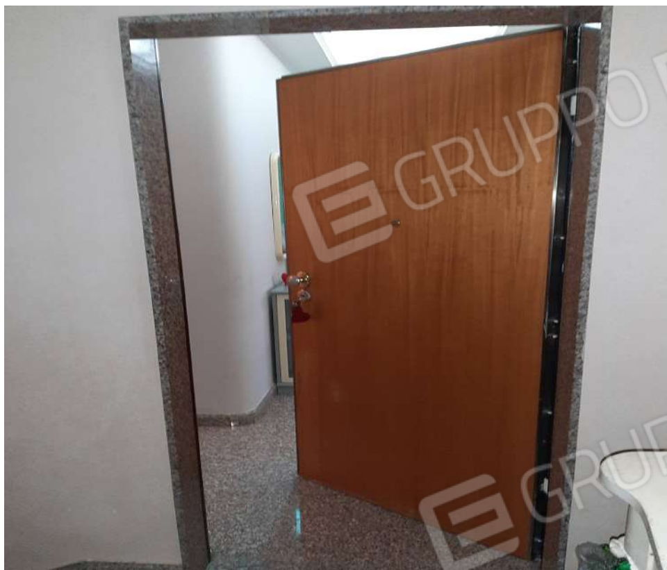
Foto n. 5 porta ingresso alloggio P.1