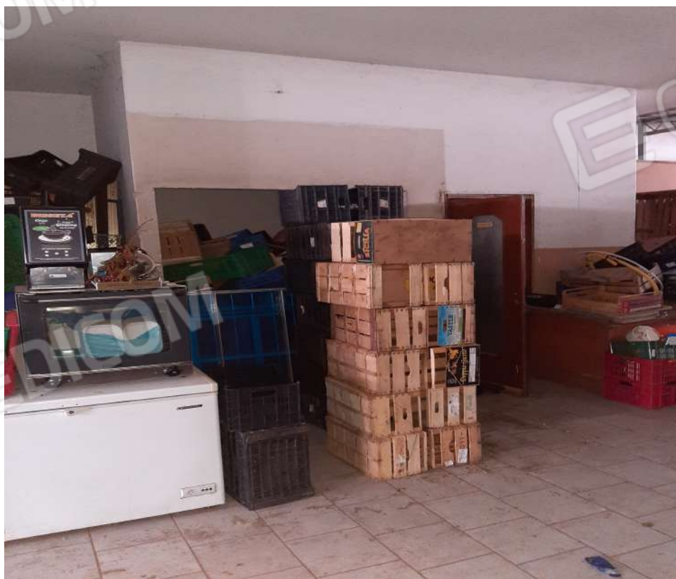
Foto n. 42 vista localetto e vano bagno