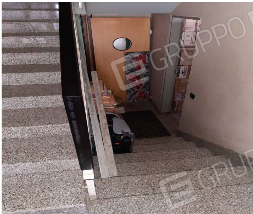
Foto n. 21 rampa accesso dall'androne al P.T. e al P.S.1P.T.