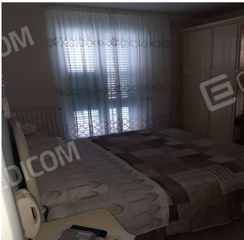
Foto n. 15 letto