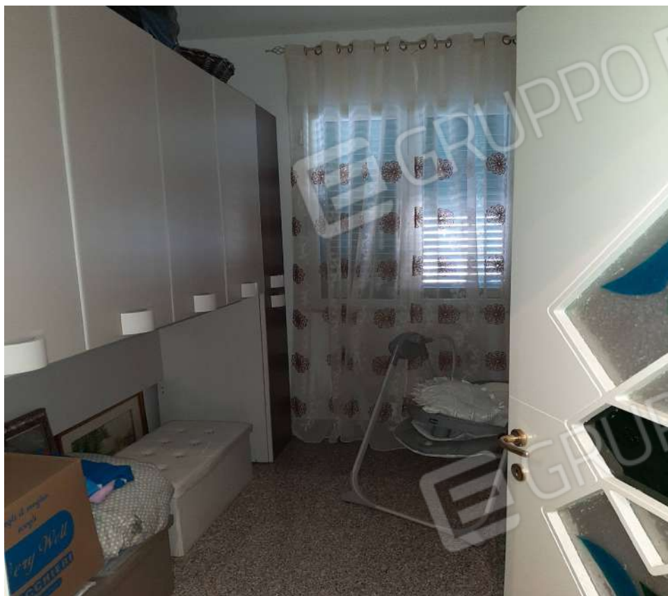
Foto n. 18 ripostiglio tra le stanze letto