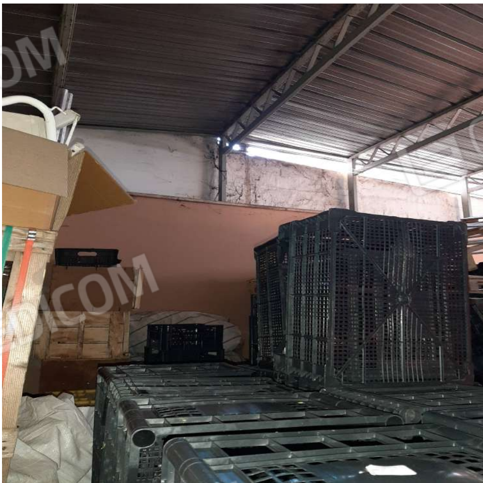
Foto n. 40 vista copertura