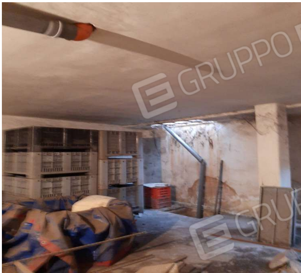
Foto n. 25 vista interna P.S.1.