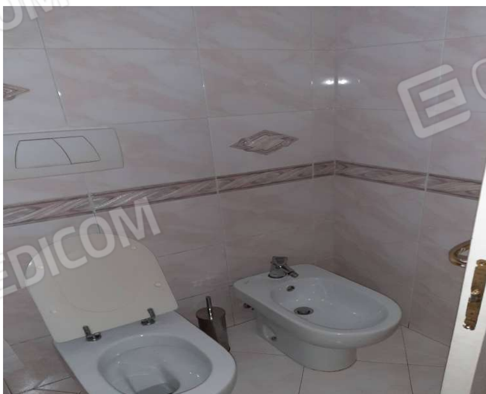
Foto n. 13 primo bagno