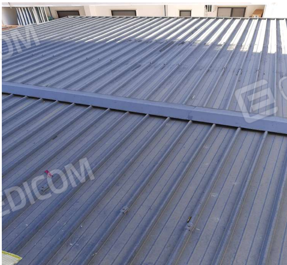
Foto n. 44 vista superiore copertura