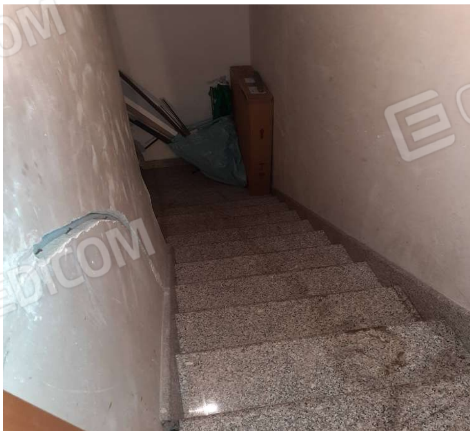
Foto n. 22 rampa accesso dall'androne al P.S.1