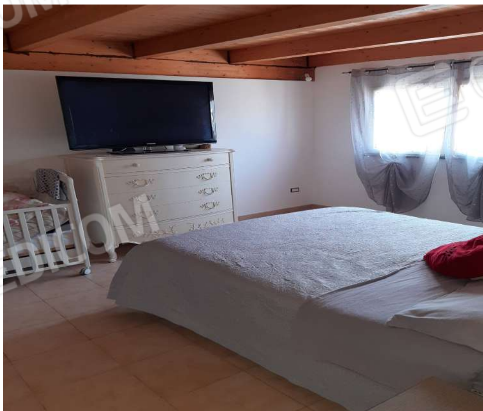
Foto n. 33 letto