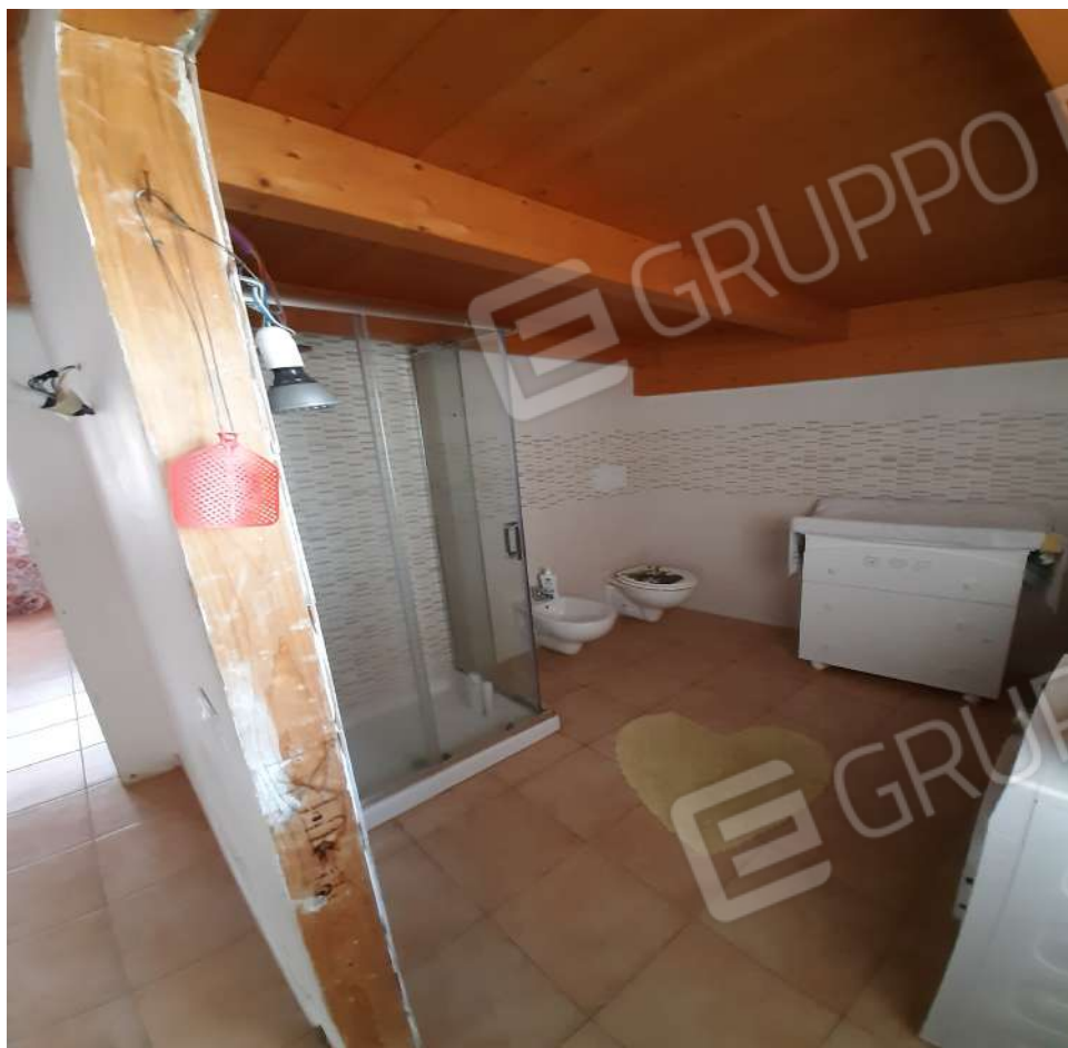
Foto n. 32 bagno