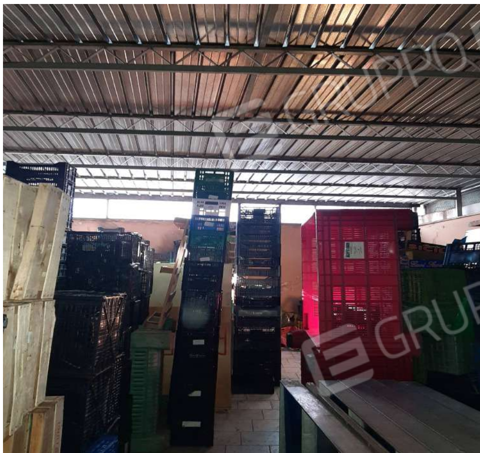
Foto n. 41 vista copertura