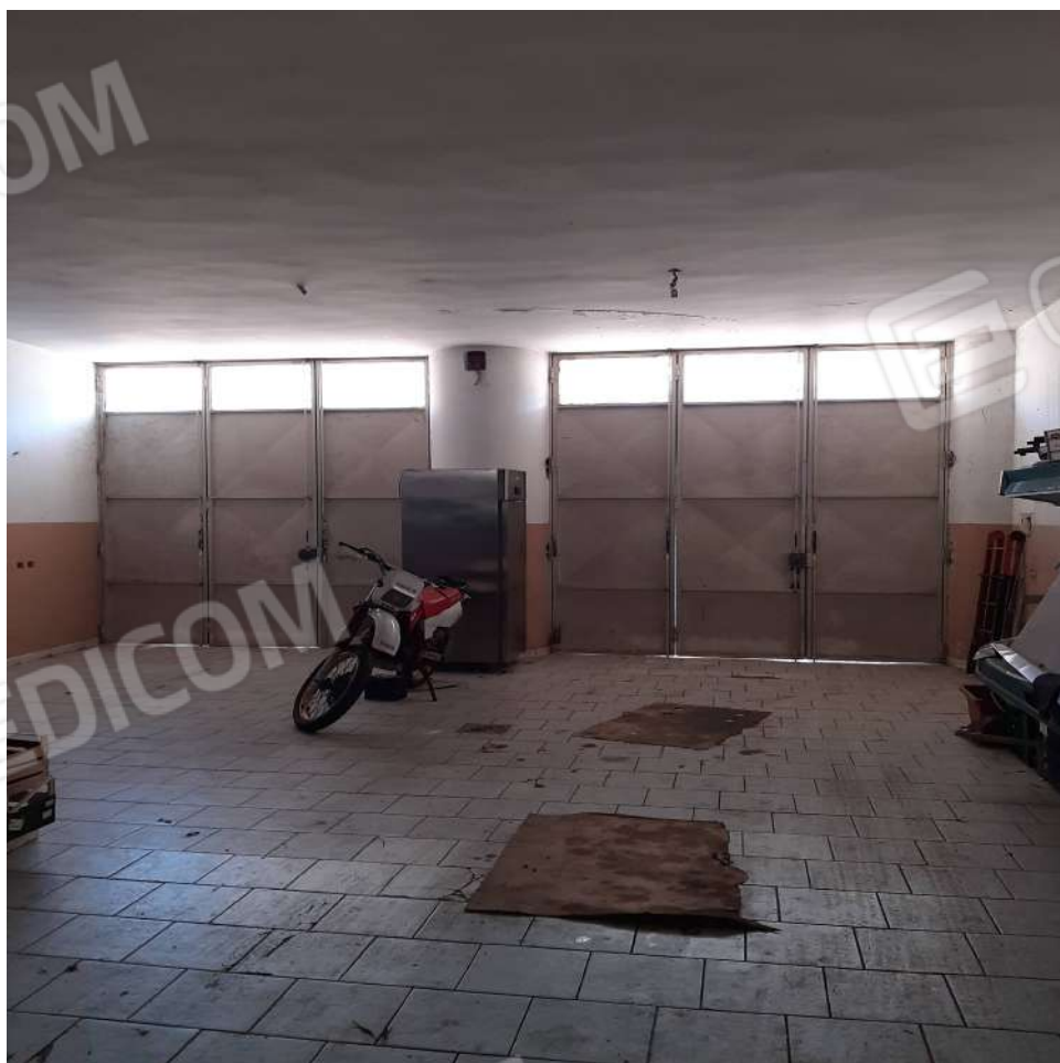
Foto n. 38 vista interna portoni accesso