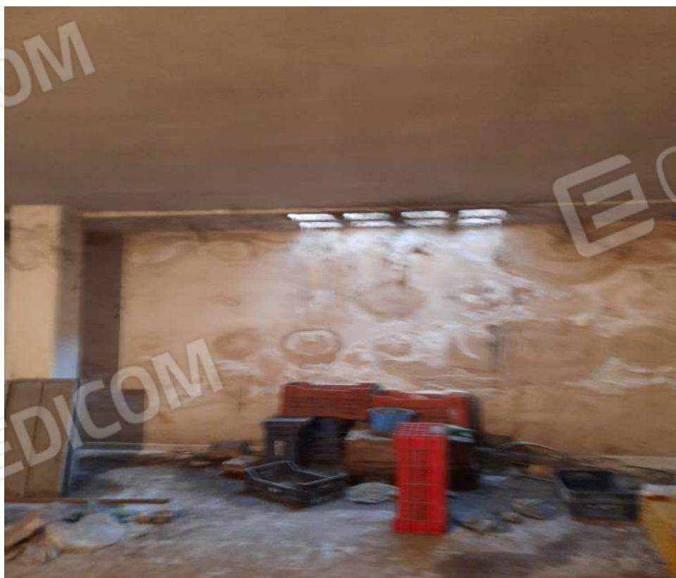
Foto n. 24 vista interna P.S.1