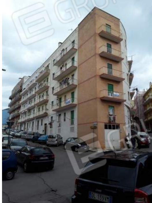
Foto n° 2 : vista del fabbricato via E. De Amicis angolo via Piave

LOTTO n° 2 PUTIGNANO (BA) VIA E. DE AMICIS n°1 Fg. 36 P.Ila 2359 sub.46-49-50