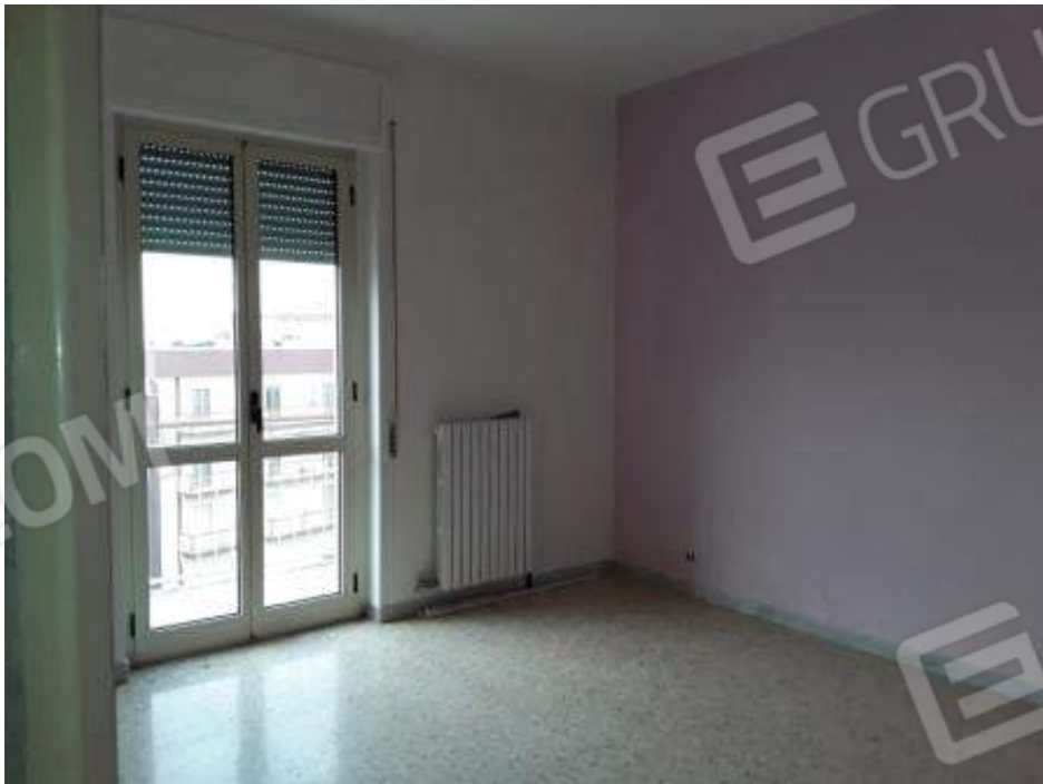
Foto n° 15 : seconda camera da letto con affaccio su via De Amicis