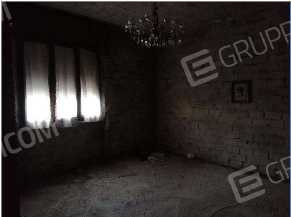
Foto 12 – Vista interna dei locali posti al piano primo dell'unità immobiliare censita al sub 9/11