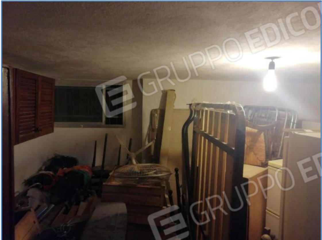
Foto 21 – Vista interna del vano posto al piano terra censito al sub 501