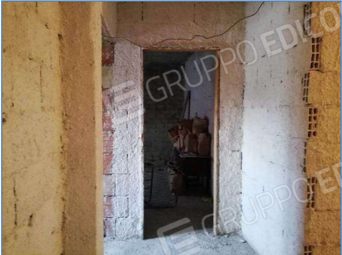
Foto 15 – Vista interna dei locali posti al piano primo dell'unità immobiliare censita al sub 9/11