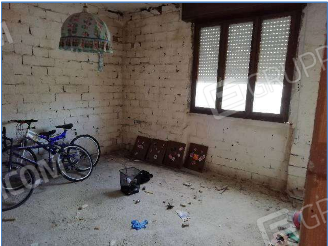
Foto 16 – Vista interna dei locali posti al piano primo dell'unità immobiliare censita al sub 9/11