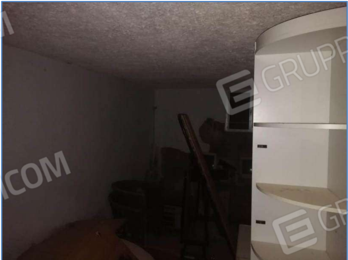
Foto 20 – Vista interna del vano posto al piano terra censito al sub 5