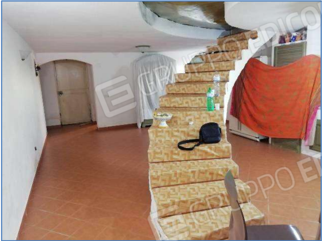
Foto 5 – Vista interna dei locali posti al piano terra censito al sub 5/502