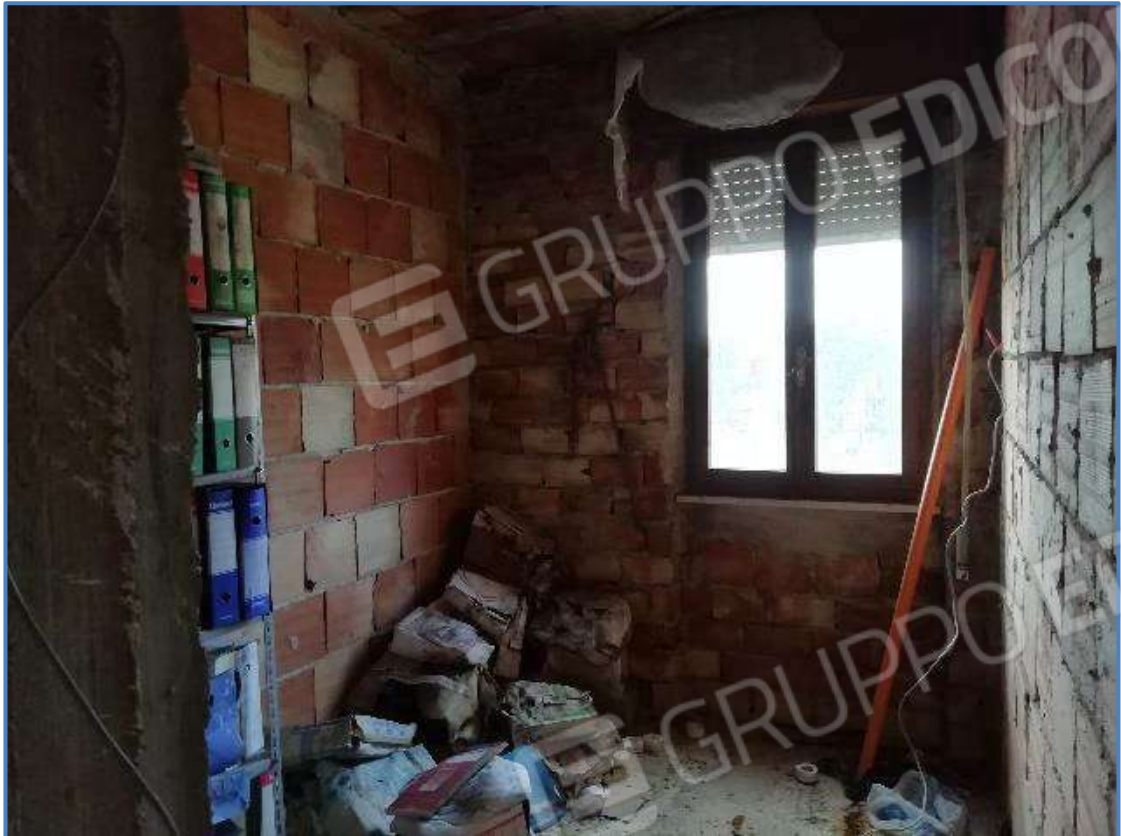
Foto 13 – Vista interna dei locali posti al piano primo dell'unità immobiliare censita al sub 9/11