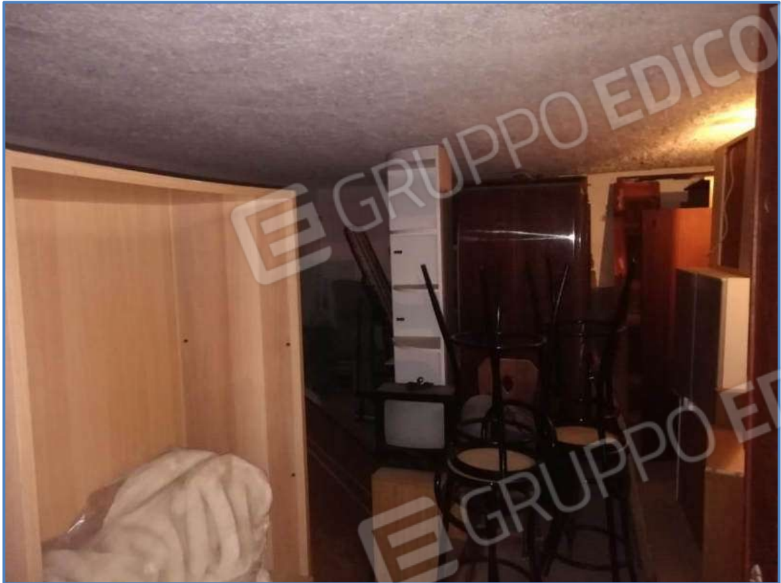
Foto 19 – Vista interna del vano posto al piano terra censito al sub 5