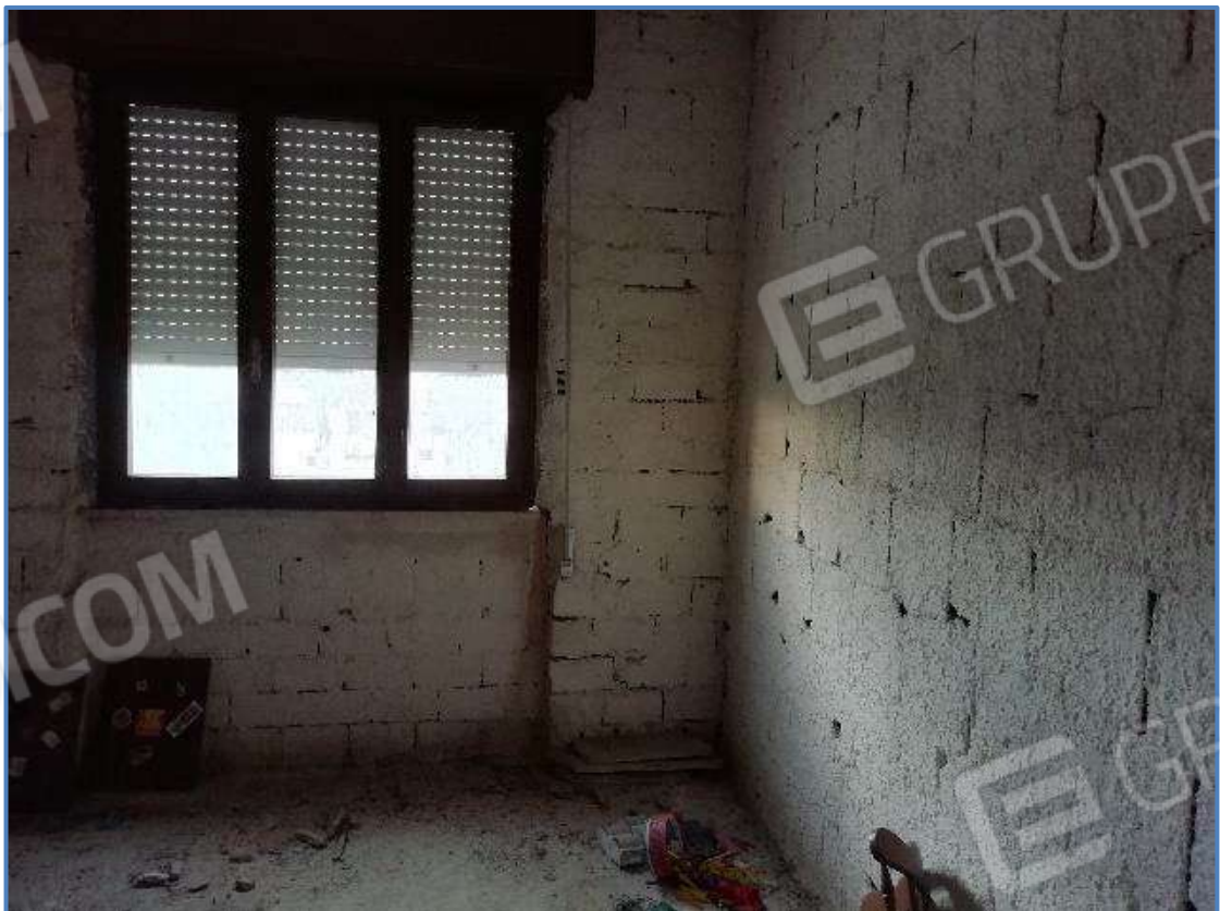
Foto 14 – Vista interna dei locali posti al piano primo dell'unità immobiliare censita al sub 9/11