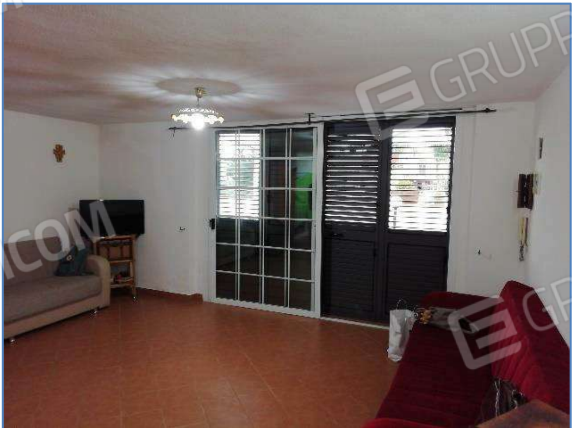
Foto 4 – Vista interna dei locali posti al piano terra censito al sub 5/502