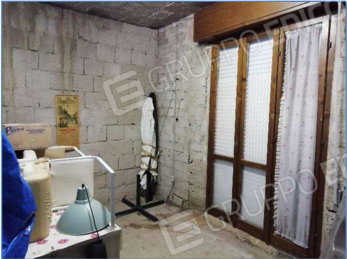
Foto 11 – Vista interna dei locali posti al piano primo dell'unità immobiliare censita al sub 9/11