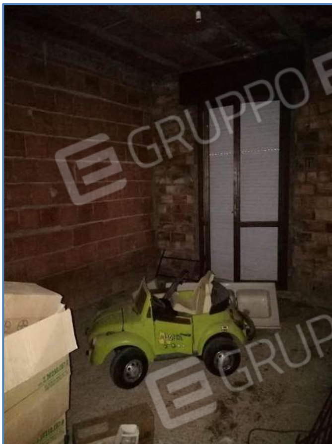
Foto 17 – Vista interna dei locali posti al piano primo dell'unità immobiliare censita al sub 9/11