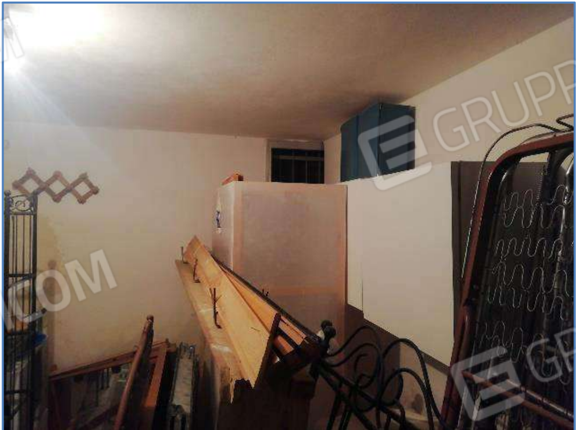
Foto 24 – Vista interna del vano posto al piano terra censito al sub 501