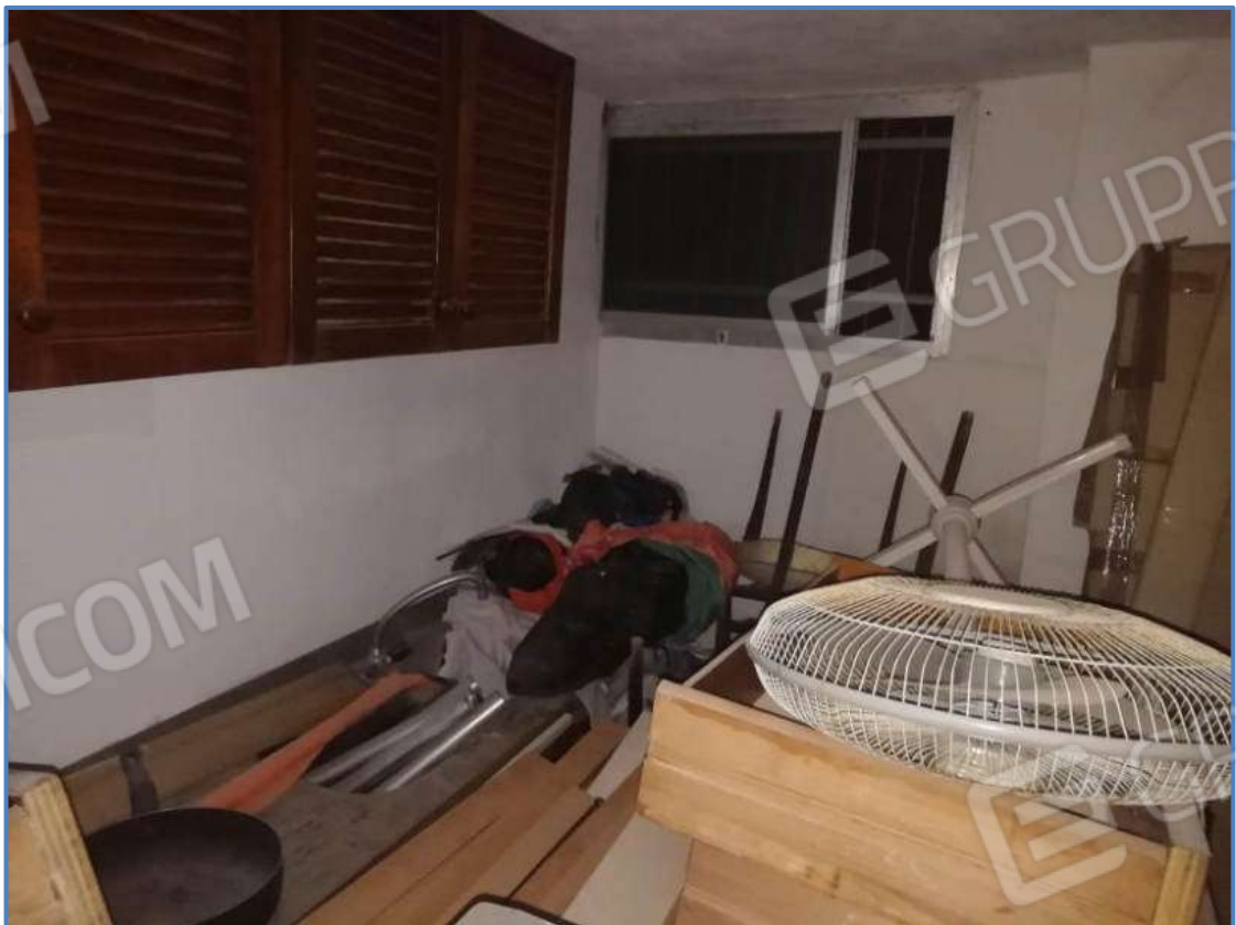
Foto 22 – Vista interna del vano posto al piano terra censito al sub 501