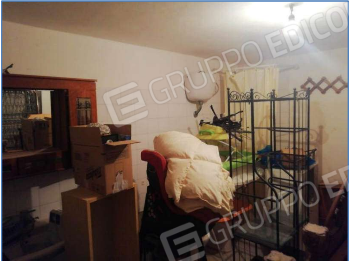
Foto 23 – Vista interna del vano posto al piano terra censito al sub 501