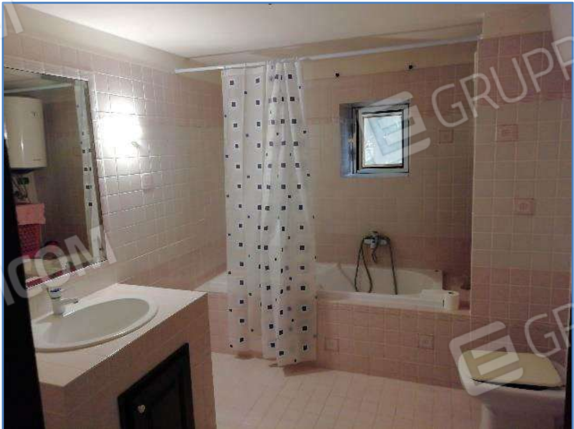
Foto 6 – Vista interna dei locali posti al piano terra censito al sub 5/502