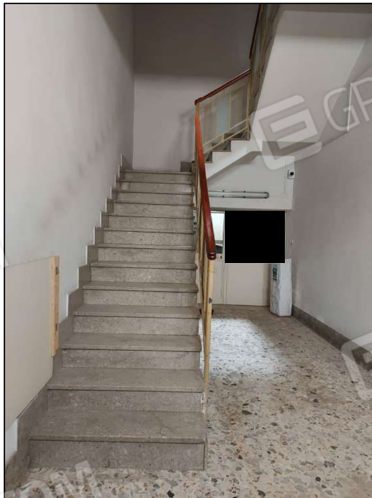
Foto corpo scala ingresso piano terra