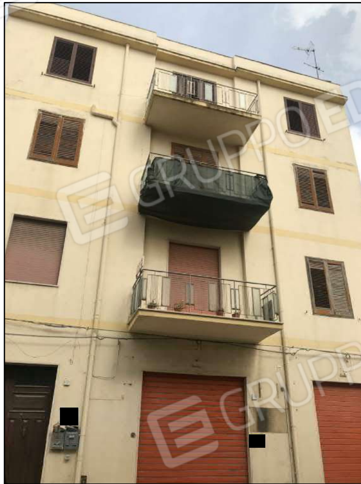
Foto prospetto via Pietro Luna