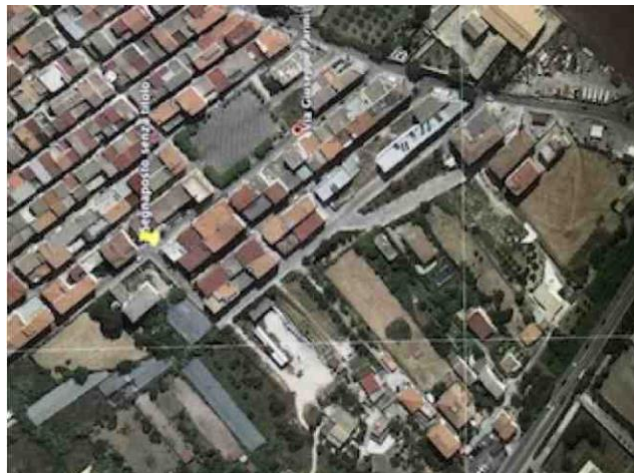
immagine n. 1 aerofoto di via Giuseppe Parini a Partinico

La proprietà confina nel suo intero con la via G. Parini a Nord, con la via Nazario Sauro ad Est, con proprietà la via Filippo Turati a Sud e con proprietà aliena ad Ovest.