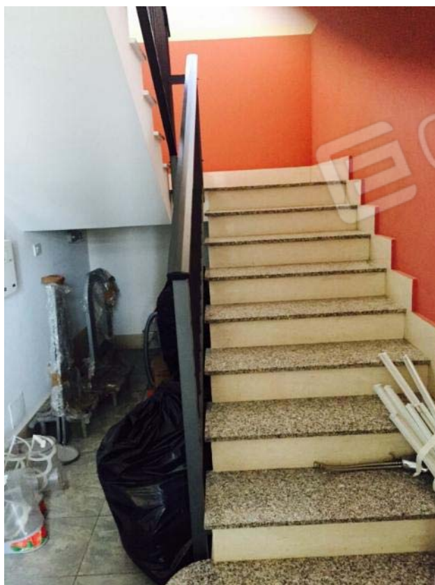
Foto 10 – vano scala di collegamento tra piano terra e piano primo