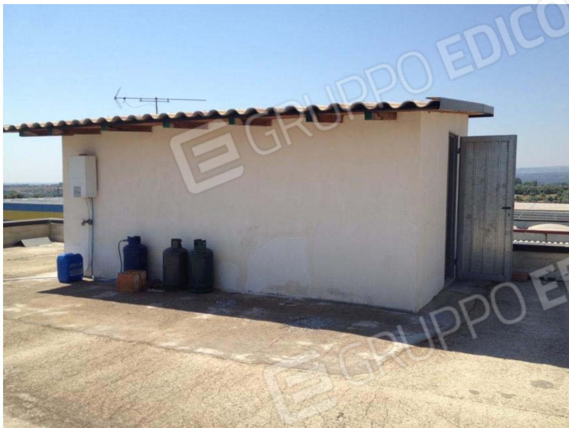
Foto 16 – volume abusivo realizzato in corrispondenza del lastrico solare del corpo A