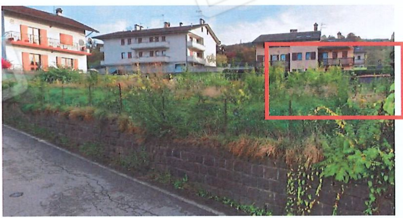
Figura 2 - LOTTO 01 – Garage - rilievo fotografico della porzione di fabbricato