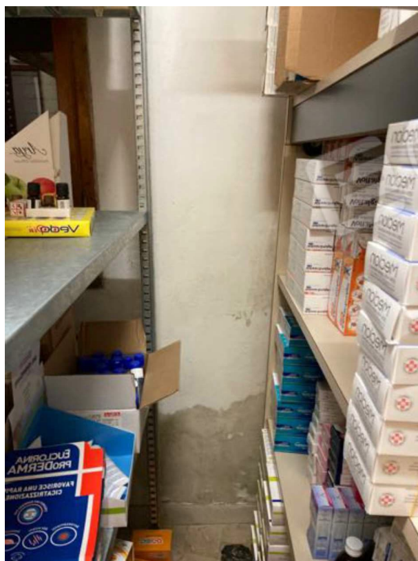
FOTO 7 - Il deposito-magazzino. Si notano i segni infiltrativi di risalita.