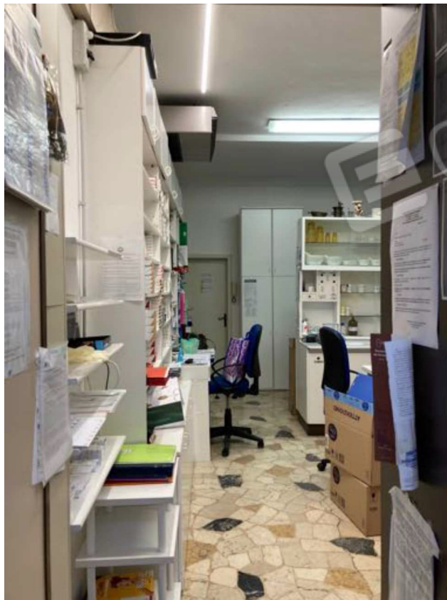
FOTO 5 - Il retro.