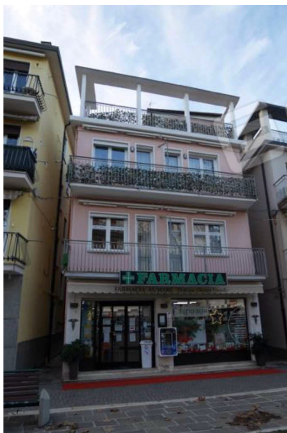
FOTO 1 - Il fabbricato in Via San Marco 629.

Con pallino rosso il punto in cui si trova l'immobile in esame.