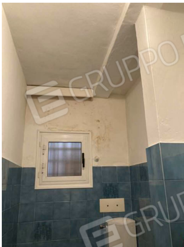
FOTO 6 - Il bagno. Si notano i segni infiltrativi.