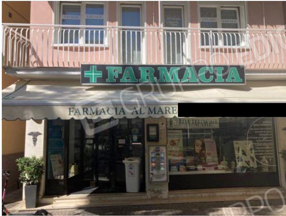
FOTO 2 - L'ingresso.