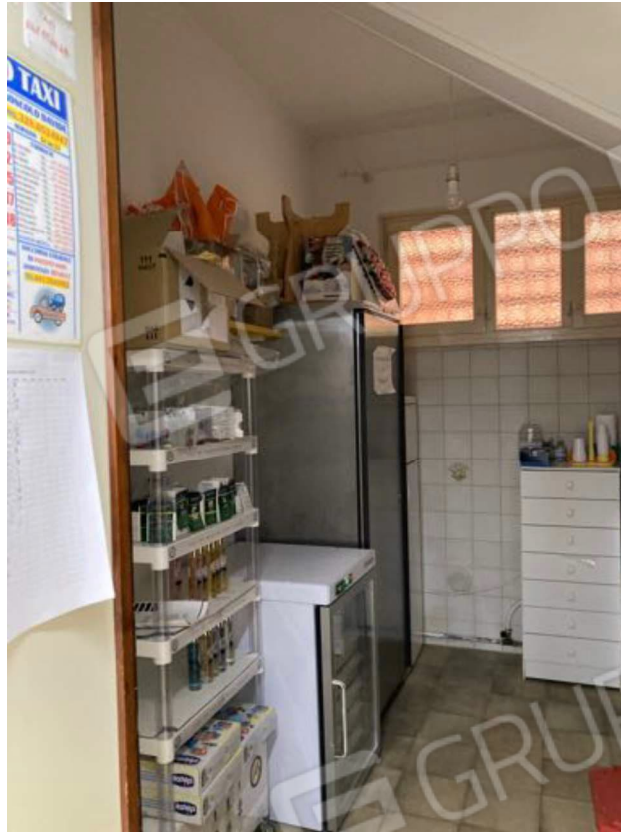
FOTO 4 - Il locale preparazione farmaci.