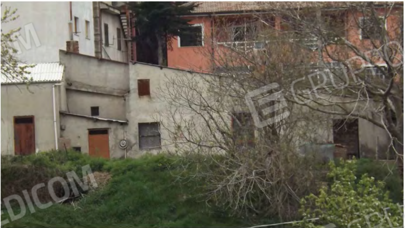
FOTO 1-2 prospetti sud-est