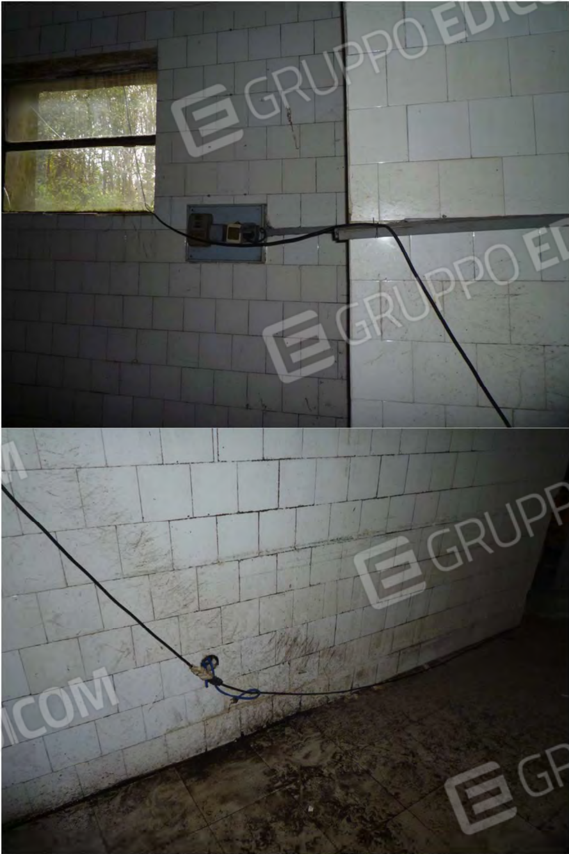
FOTO 30-31 fili elettrici aerei sala lavorazione 3