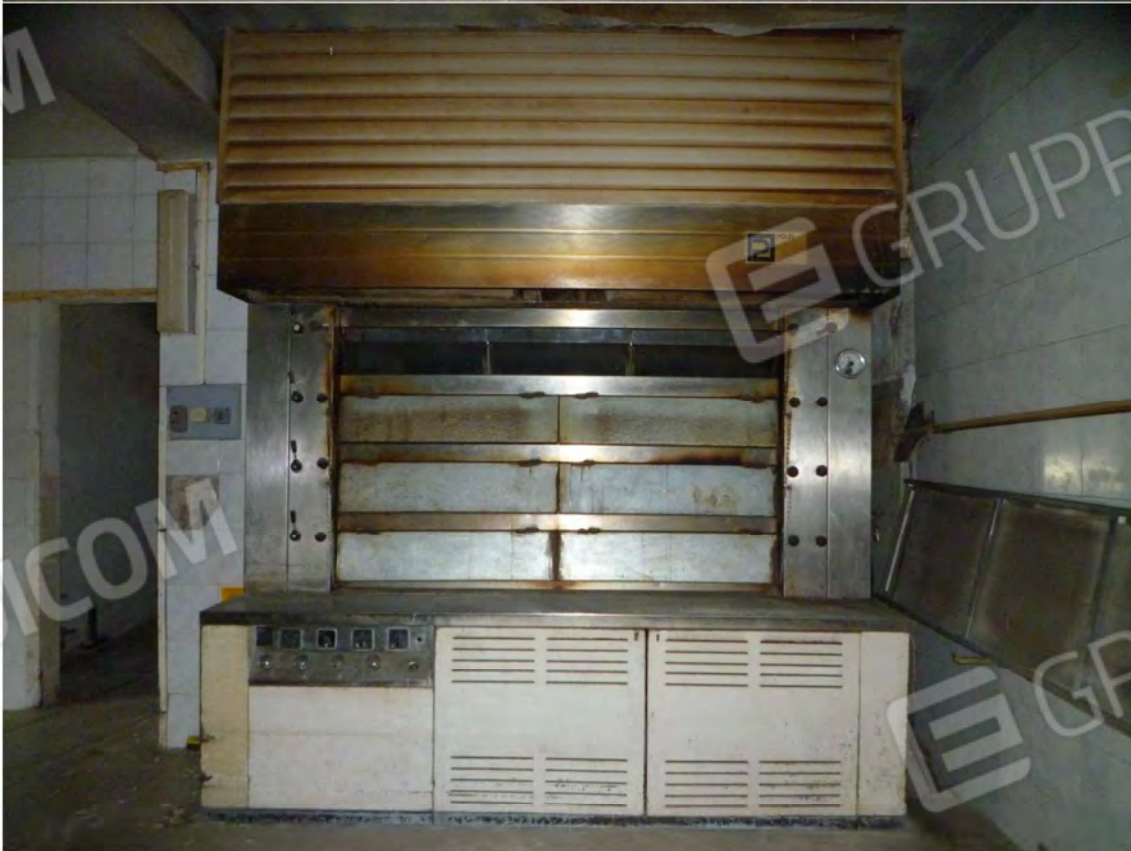
FOTO 9-10 forno a gasolio