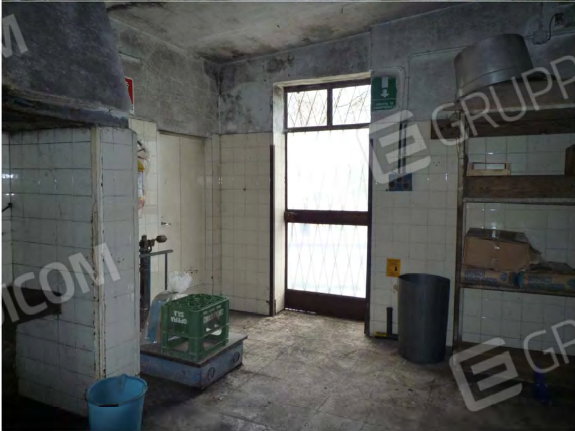
FOTO 36-37 sala lavorazione 4