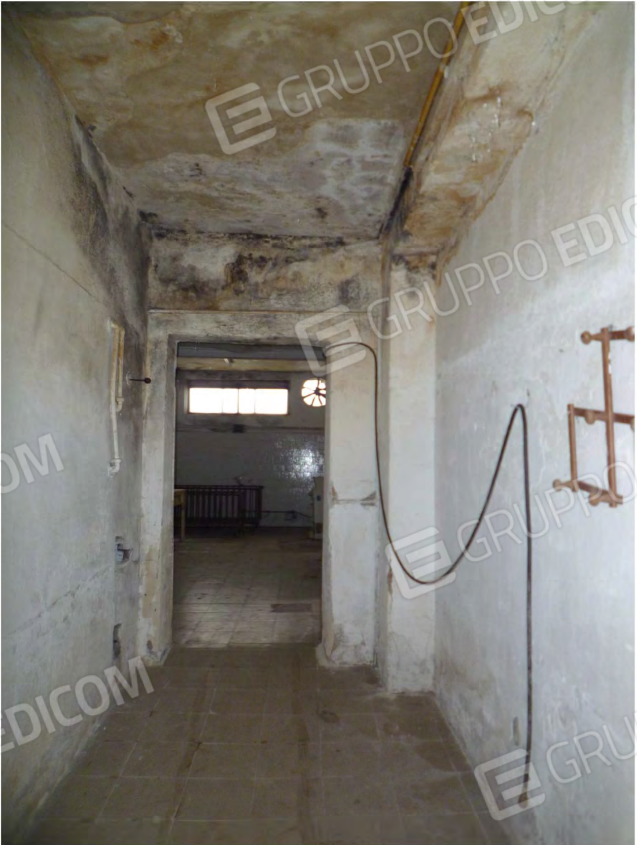
FOTO 22 disimpegno