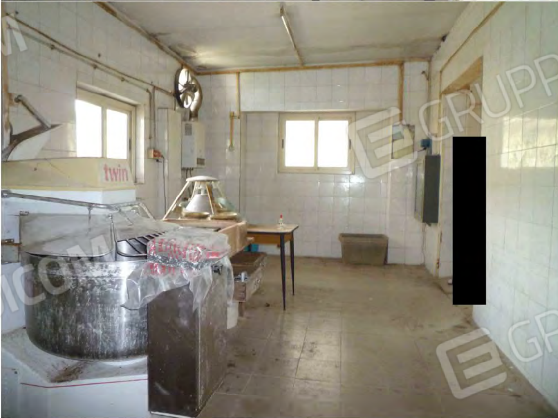
FOTO 13-14 sala lavorazione 1