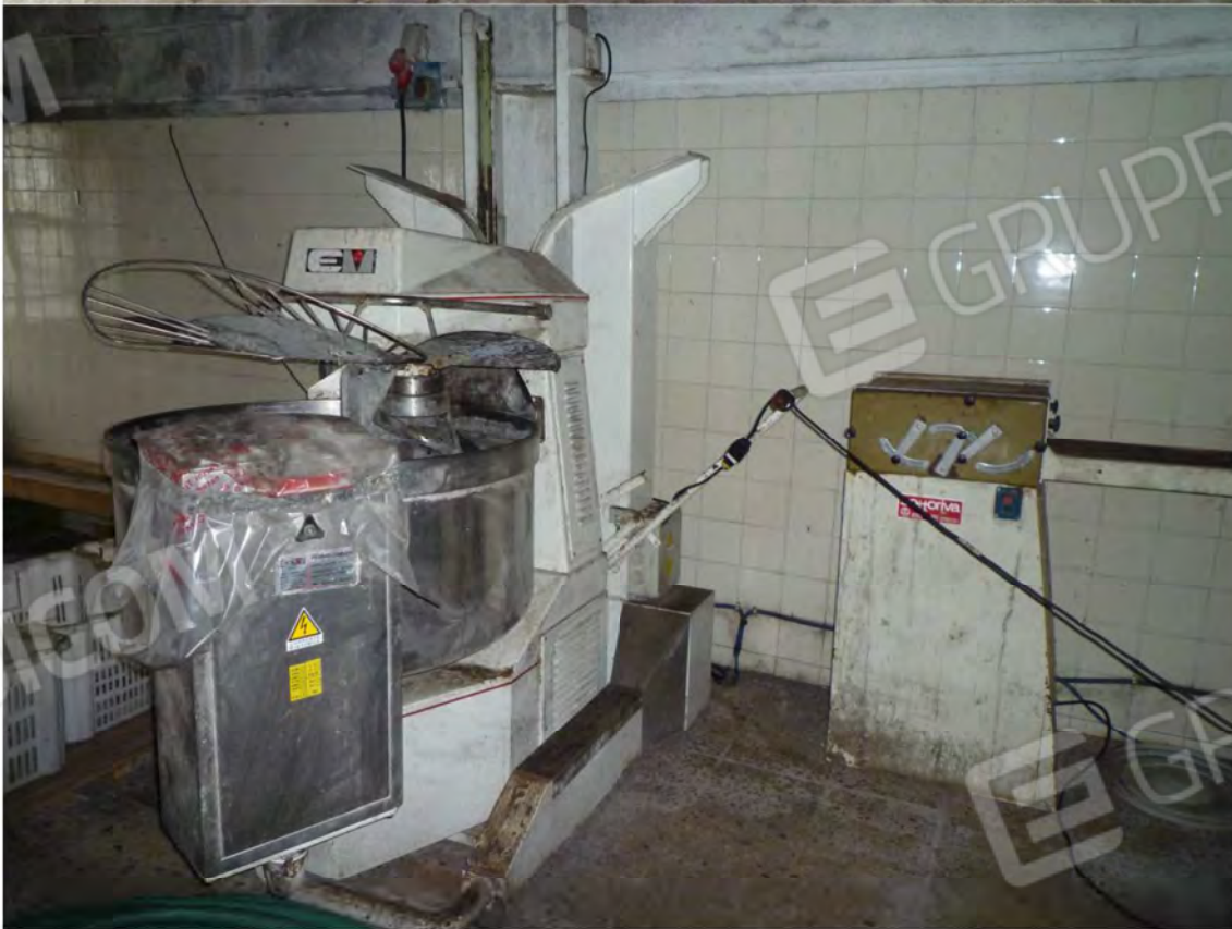
FOTO 40-41 scaffalatura e impastatrice a spirale sala lavorazione 4