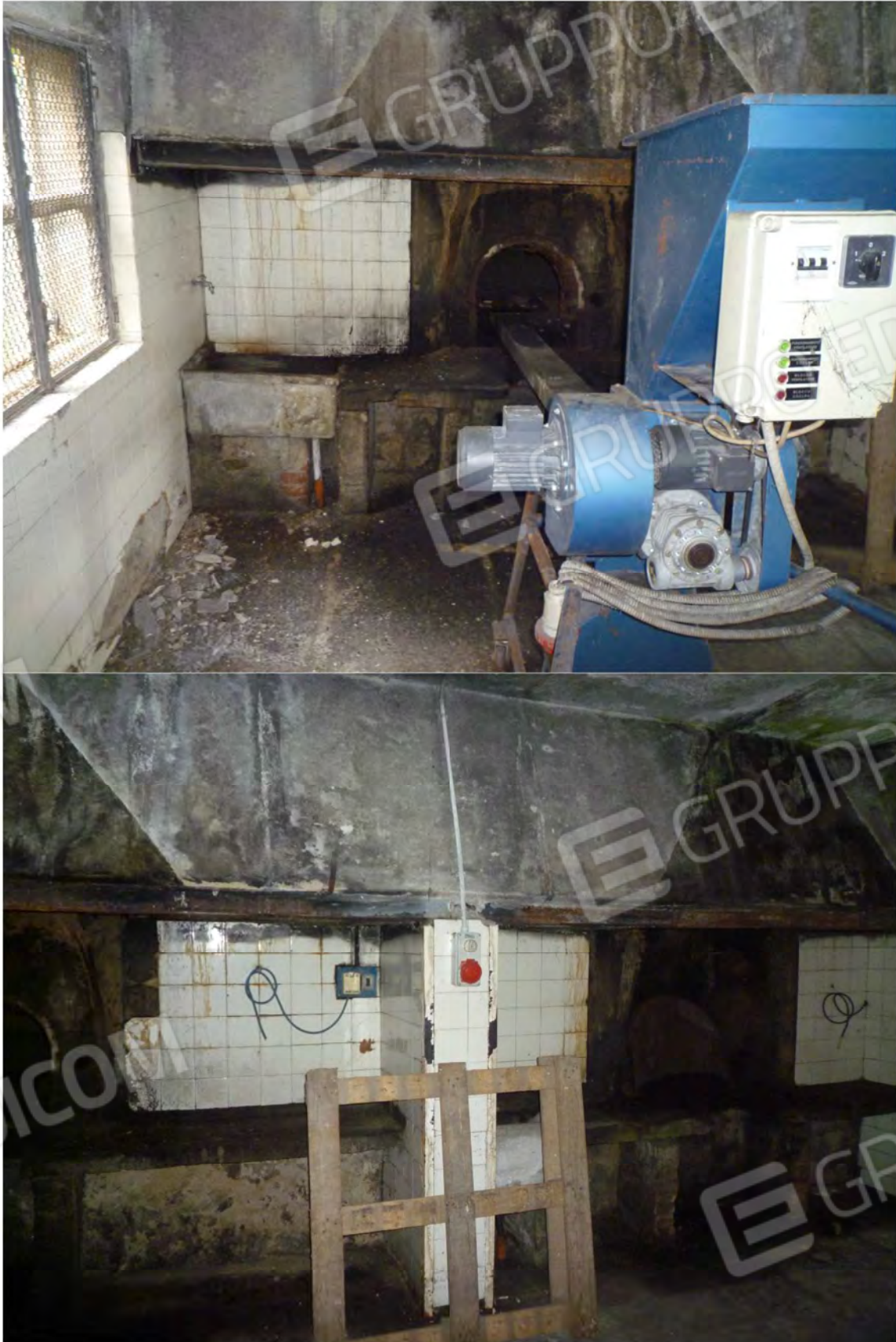
FOTO 38-39 forni a legna sala lavorazione 4