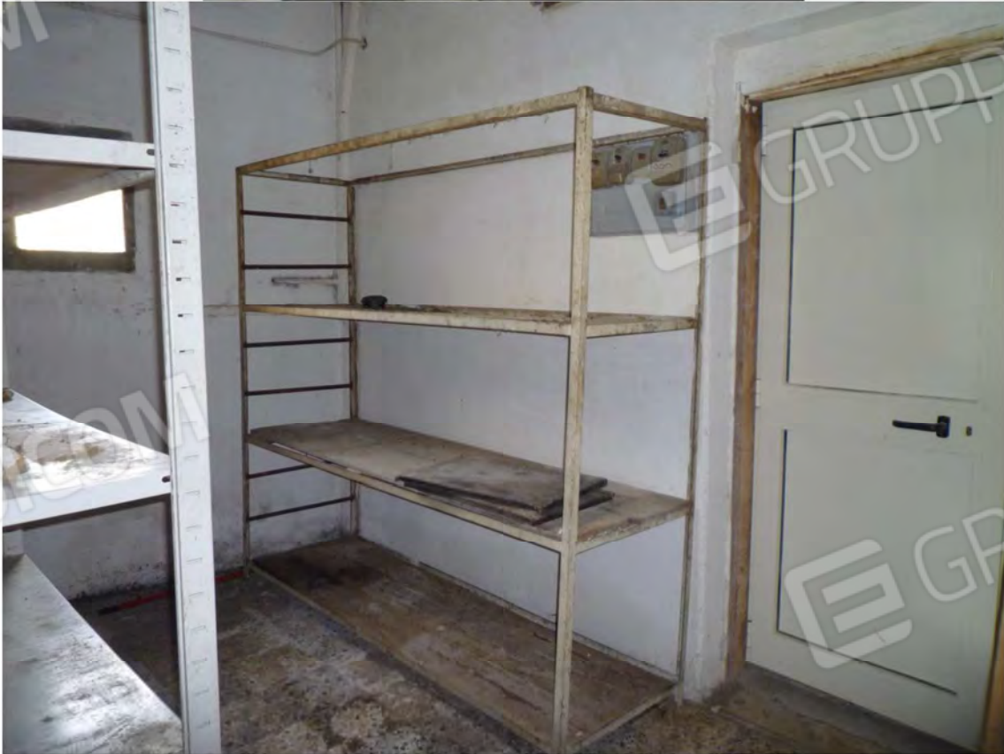
FOTO 18-19 ripostiglio