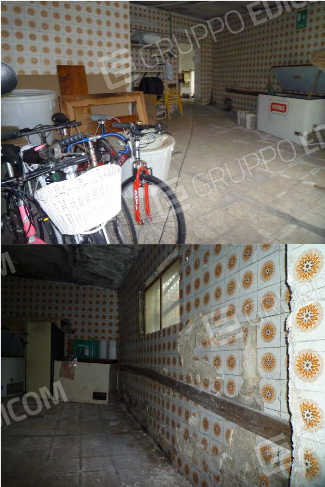
FOTO 34-35 deposito