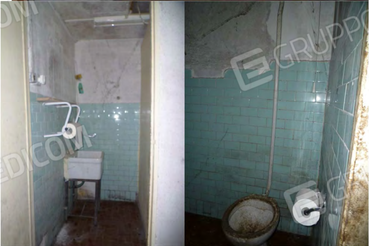
FOTO 20-21 spogliatoio e bagno