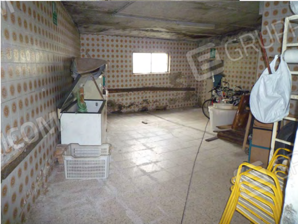
FOTO 32-33 deposito traccia di filo elettrico sul pavimento