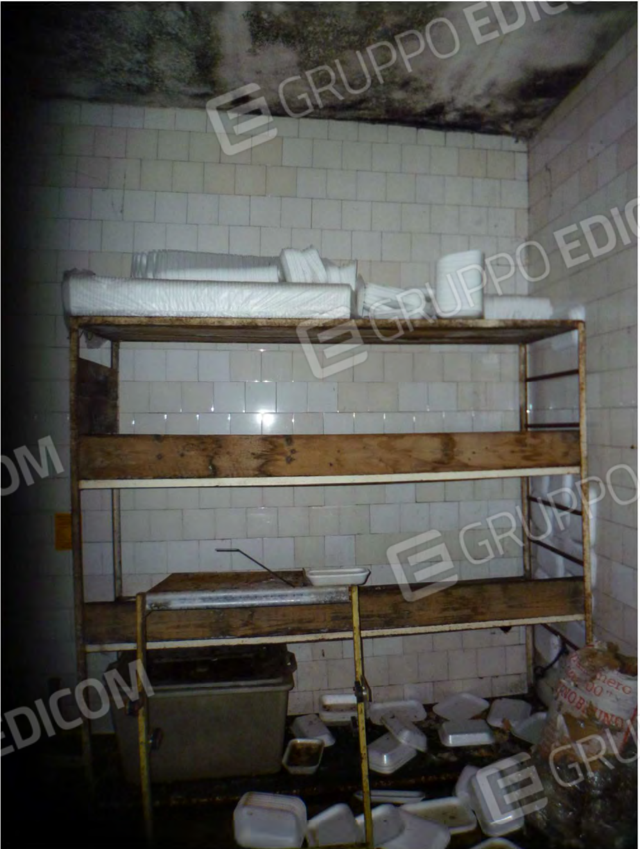
FOTO 29 scaffalatura sala lavorazione 3