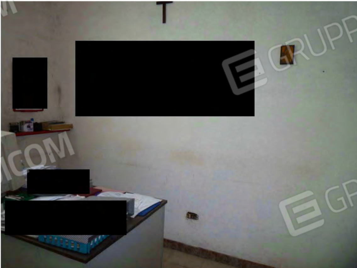
FOTO 52-53 ufficio