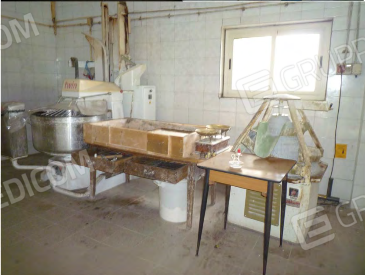
FOTO 15-17 sala lavorazione 1