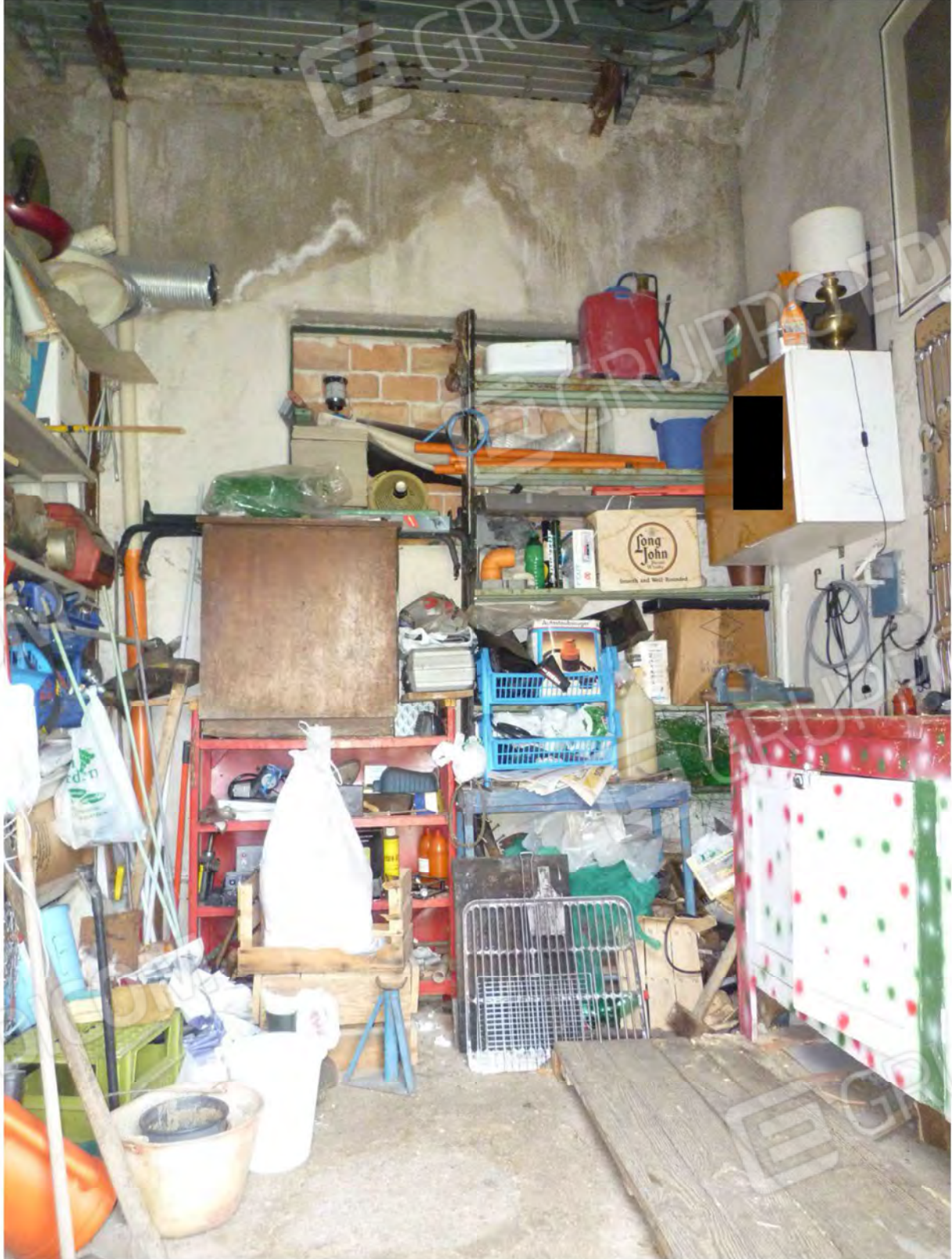
FOTO 54 locale accessorio 1