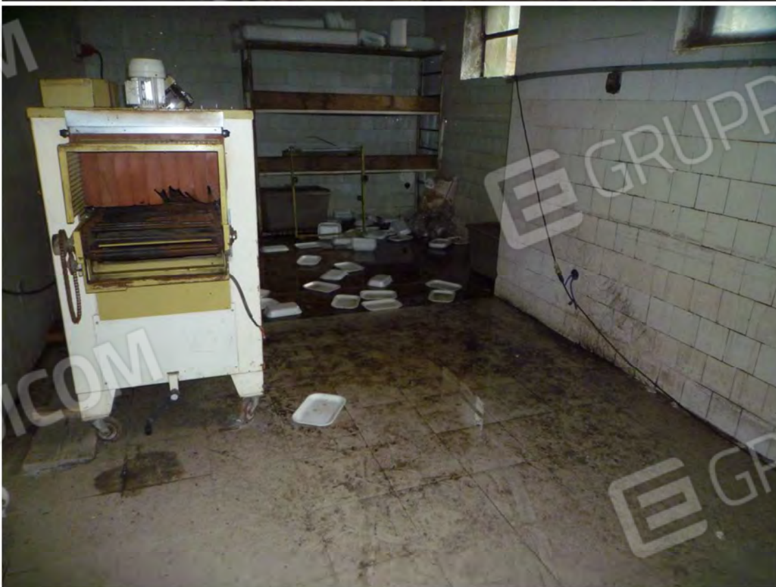
FOTO 25-26 spogliatoio e bagno