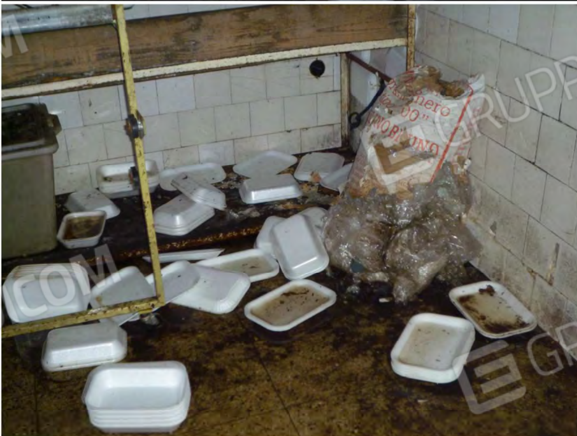
FOTO 27-28 macchina confezionatrice sala lavorazione 3