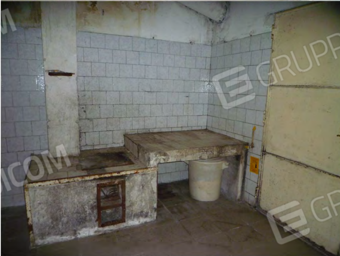
FOTO 23-24 sala lavorazione 2