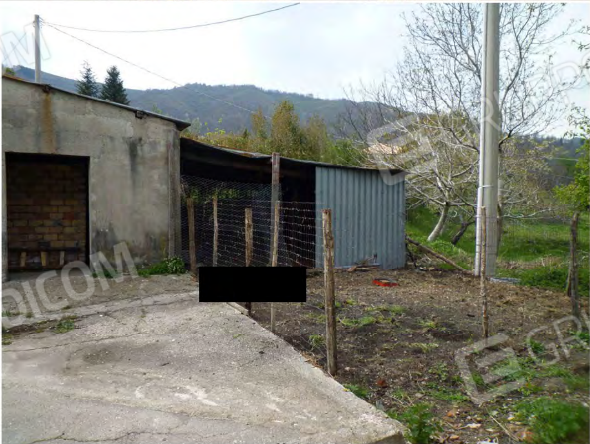
FOTO 46-47-48 retro forni e pollaio