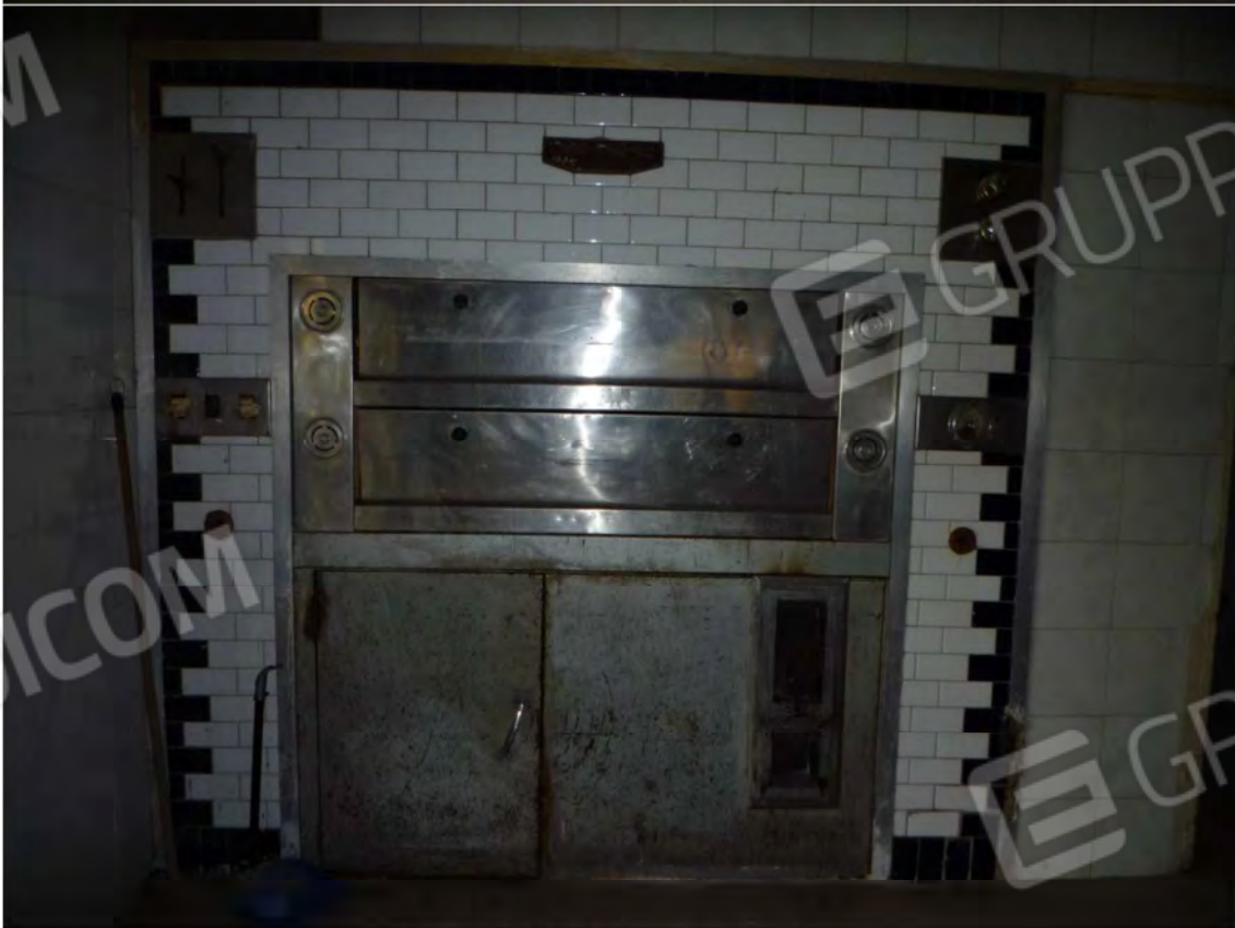
FOTO 11-12 forno meccanico