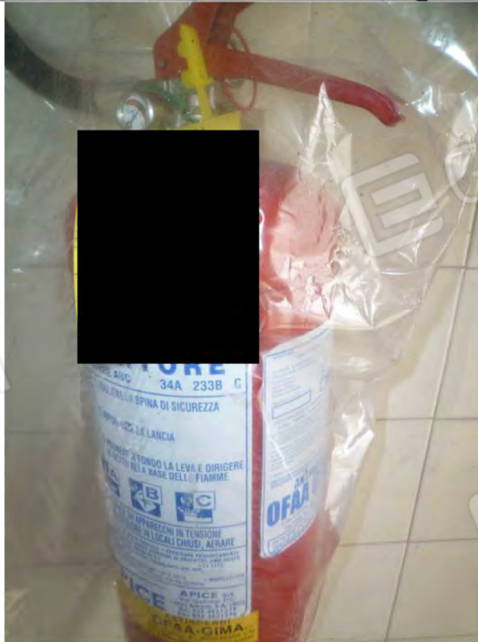
FOTO 44-45 estintore portatile e traccia aerea filo elettrico sala lavorazione 4