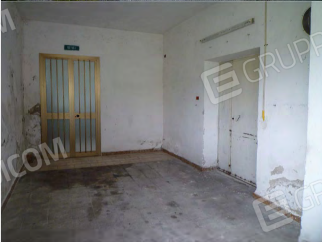
FOTO 49-50 portico e linea di confine su strada comunale