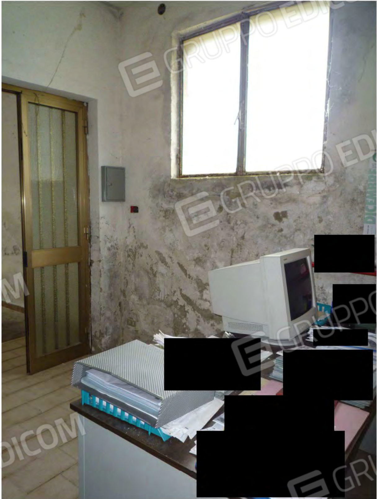
FOTO 51 ufficio