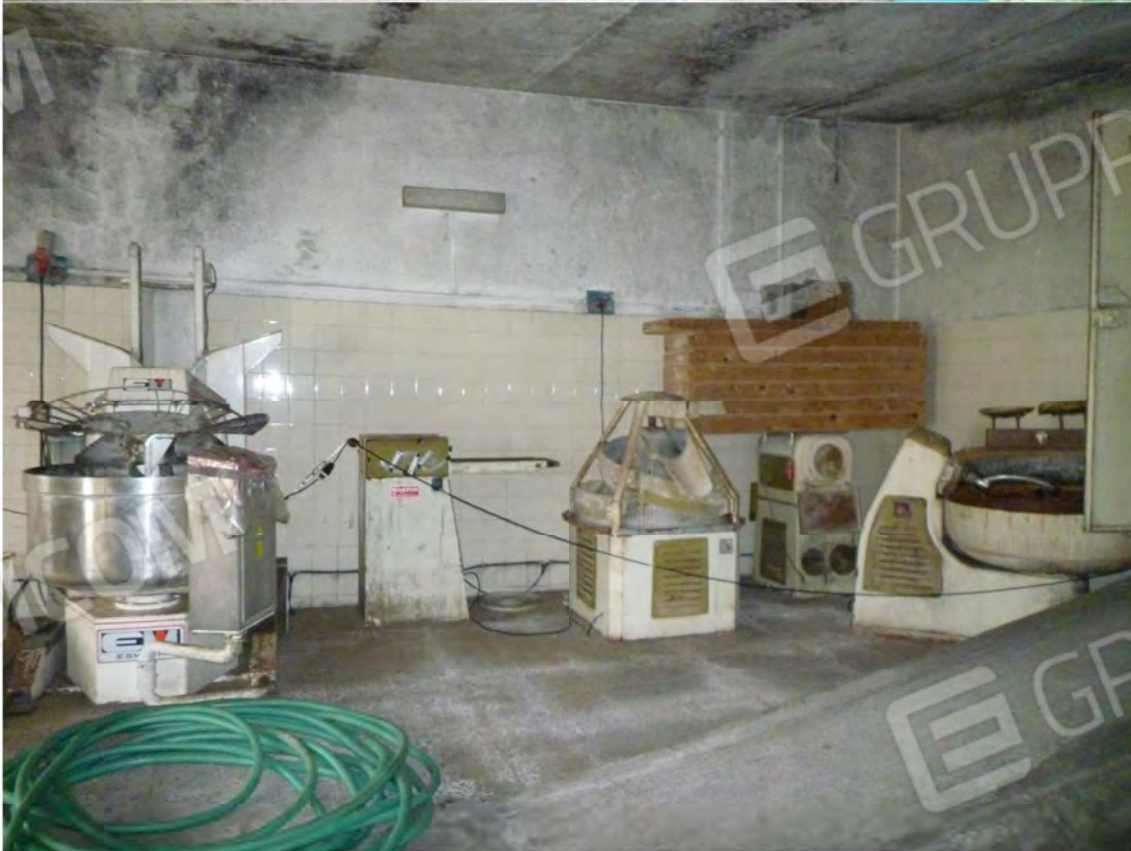
FOTO 42-43 macchinari sala lavorazione 4 traccia filo elettrico aereo