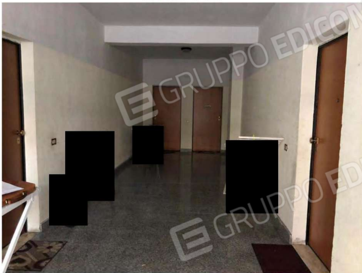
Foto 3 - Androne fabbricato p.lla 632 del foglio 12 del Comune di Mendicino (CS).