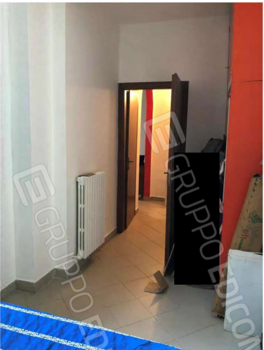
Foto 13 - Appartamento fg.12, p.lla 632, sub.11, disimpegno.