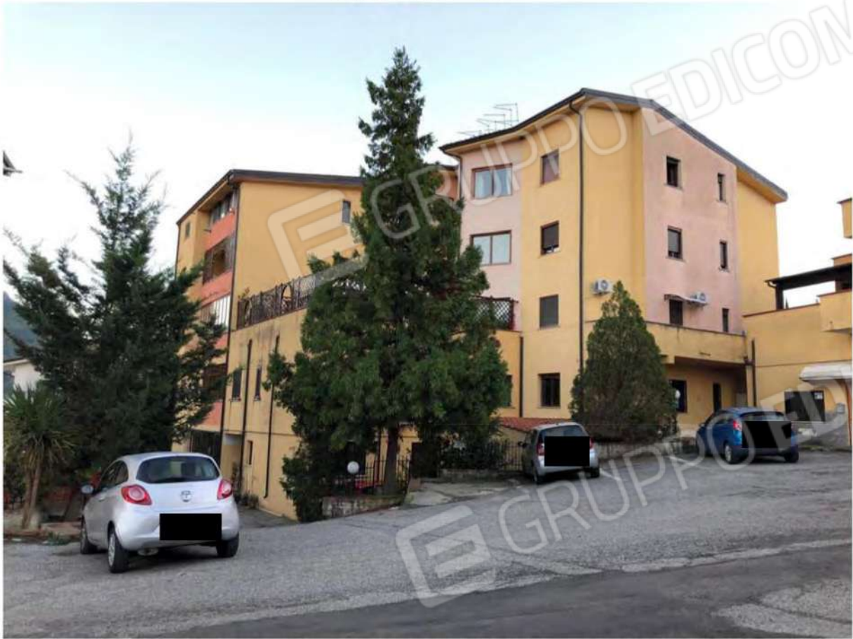
Foto 1 - Fabbricato particella 632 del foglio 12 del Comune di Mendicino (CS).