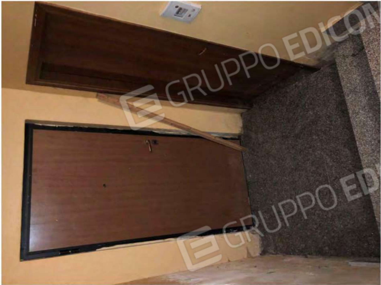
Foto 19 - Pianerottolo seminterrato ingresso cantina, fg.12, p.la 634, sub.17.