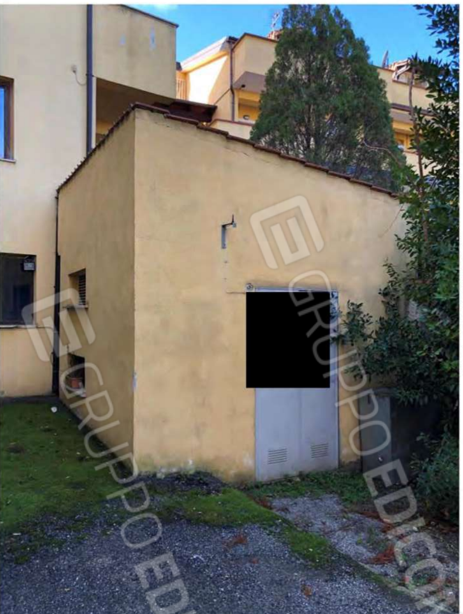
Foto 15 - Cabina elettrica, fig.12, p.lla 633, sub.2.