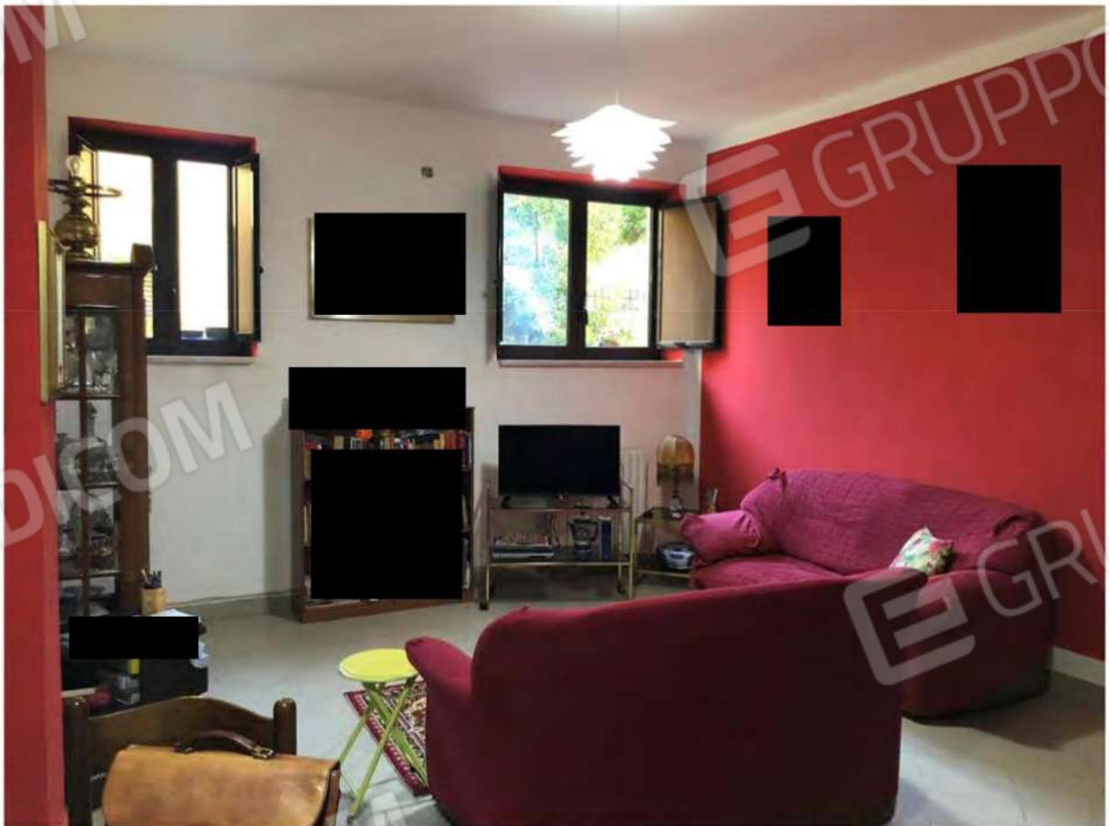
Foto 6 - Appartamento fg.12, p.la 632, sub.11, ingresso-soggiorno.