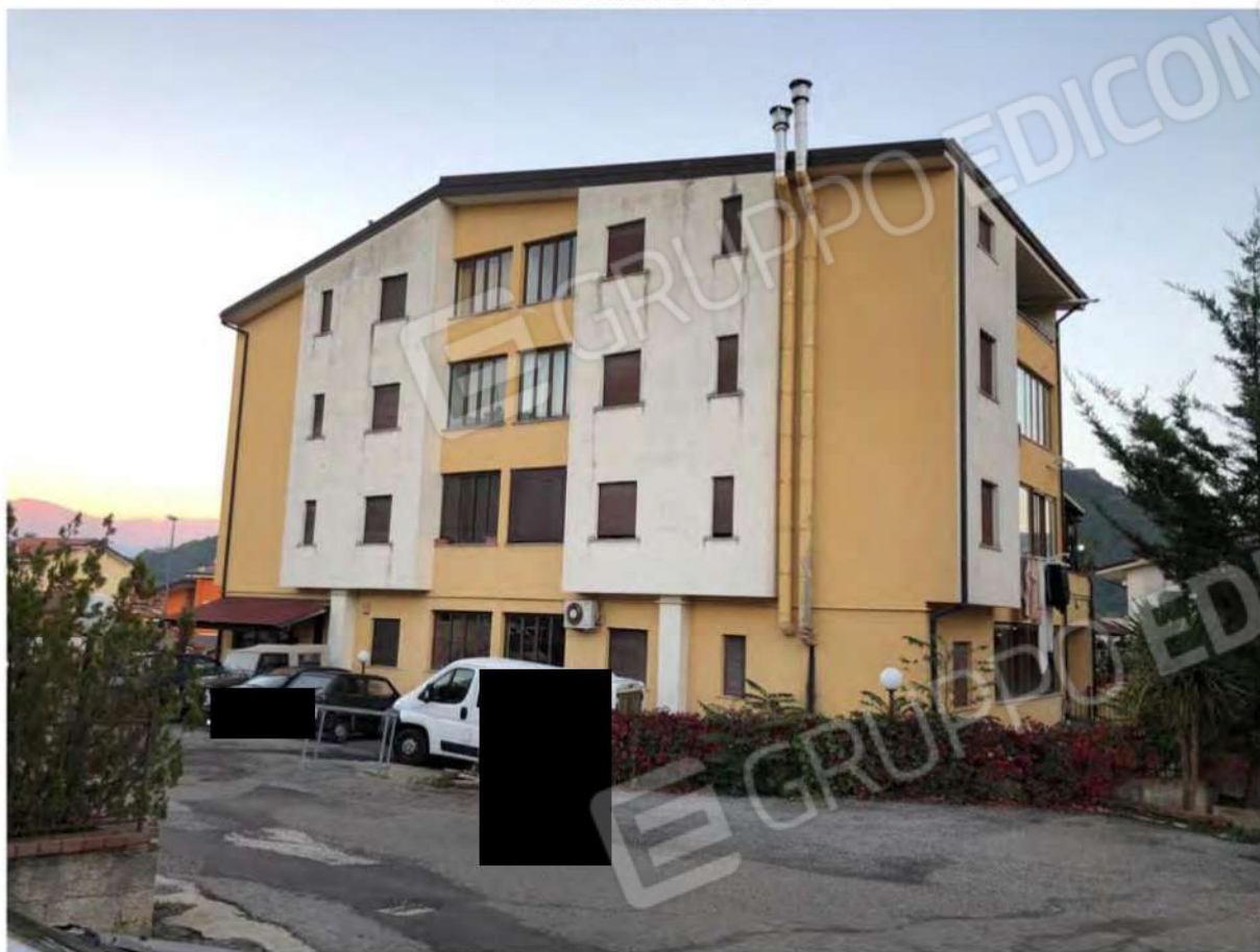
Foto 17 - Fabbricato Mendicino, fg.12, p.lla 634.