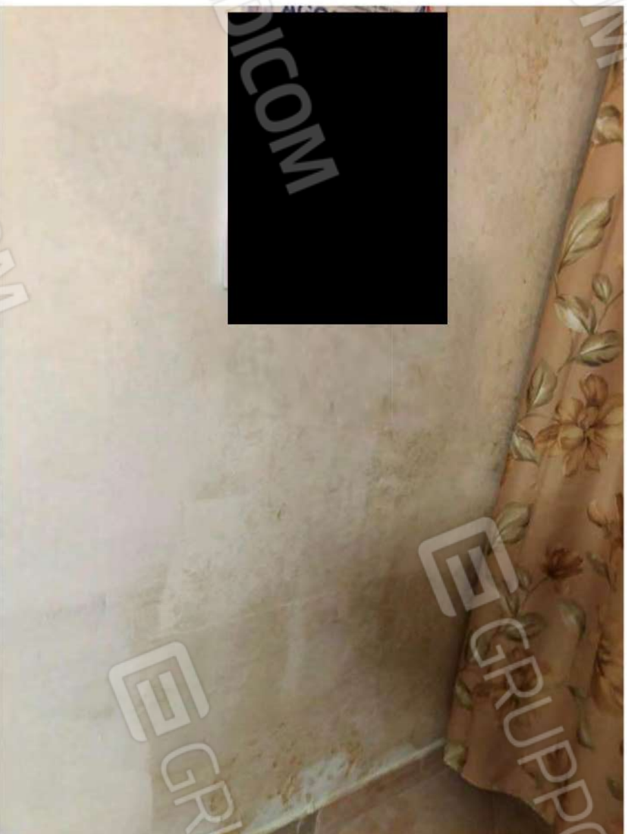
Foto 14 - Appartamento fg.12, p.lla 632, sub.11, parete umida.