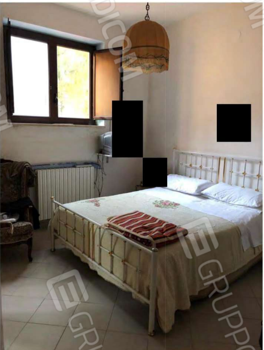
Foto 8 - Appartamento fig.12, p.lla 632, sub.11, camera da letto.