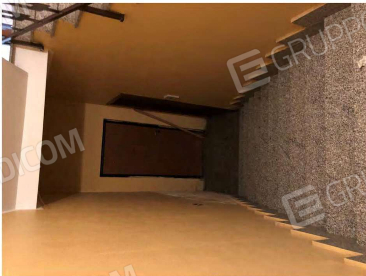
Foto 18 - Rampa piano seminterrato, fabbricato fg.12, p.lla 634.