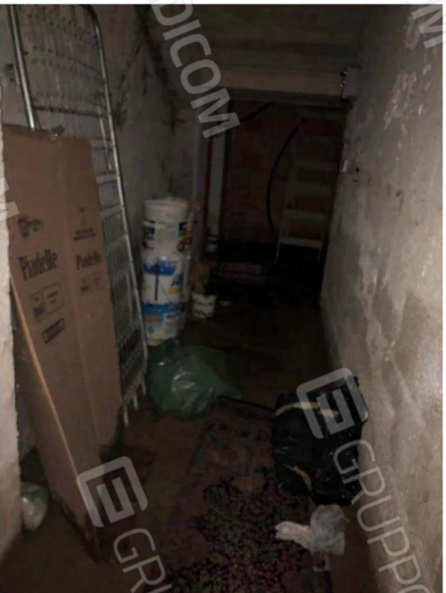
Foto 16 - Cantina sottoscala, fig.12, p.lla 634, sub.17.