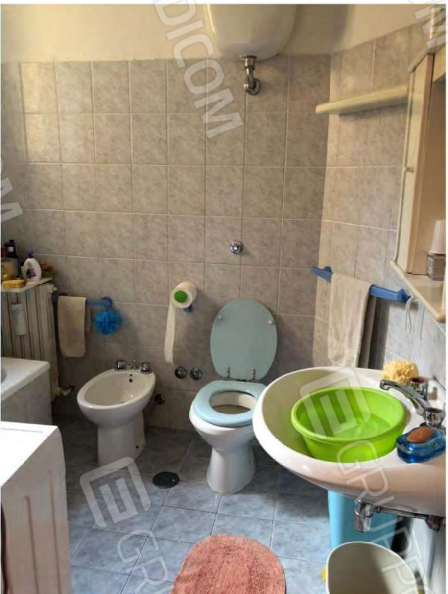
Foto 10 - Appartamento fig.12, p.lla 632, sub.11, bagno.