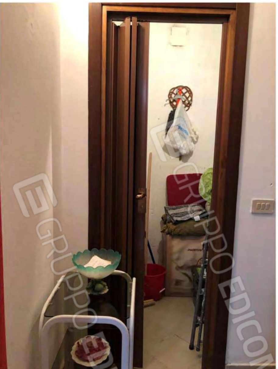
Foto 11 - Appartamento fig.12, p.lla 632, sub.11, ripostiglio.