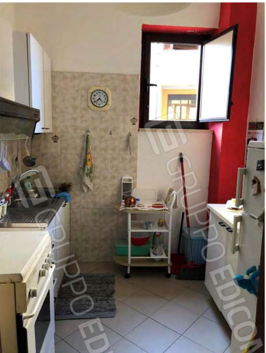
Foto 7 - Appartamento fig.12, p.lla 632, sub.11, cucina.