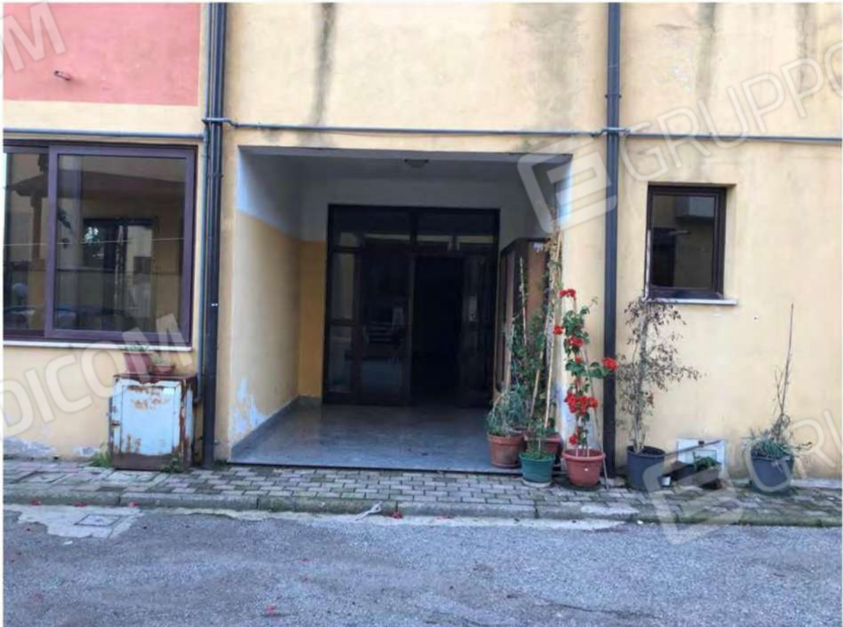
Foto 2 - Ingresso fabbricato p.lla 632 del foglio 12 del Comune di Mendicino (CS).