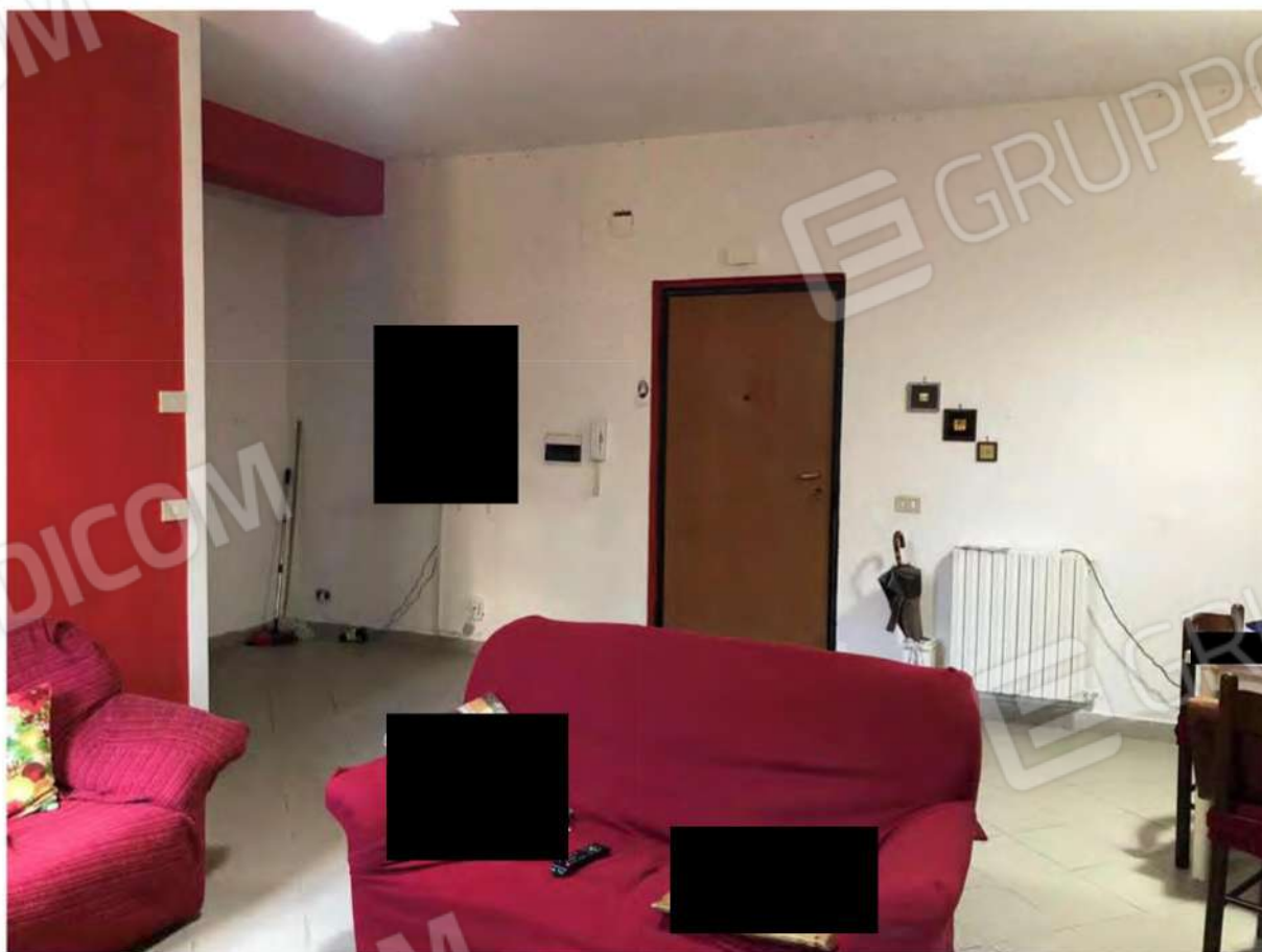
Foto 4 - Appartamento fg.12, p.lla 632, sub.11, ingresso-soggiorno.