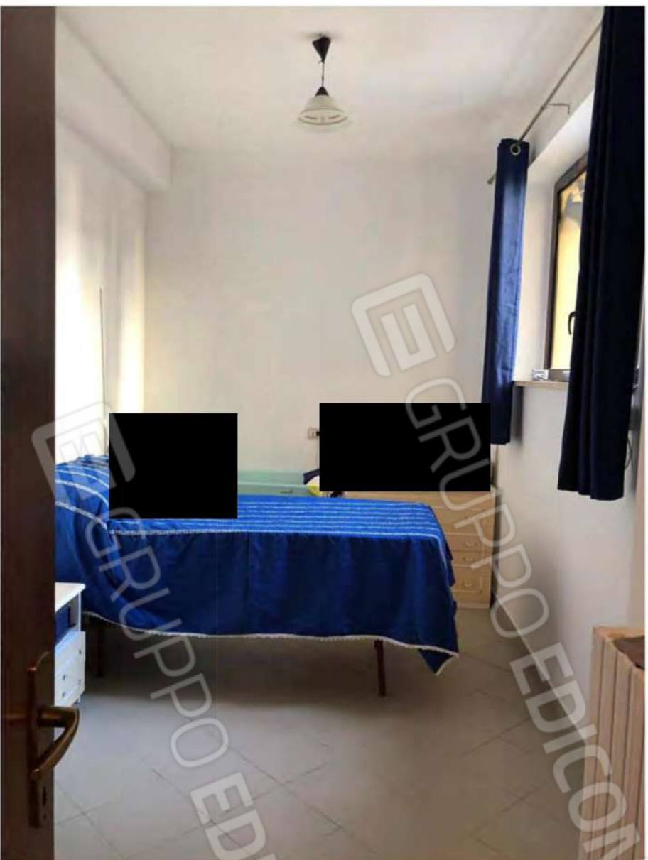
Foto 9 - Appartamento fig.12, p.lla 632, sub.11, camera da letto.