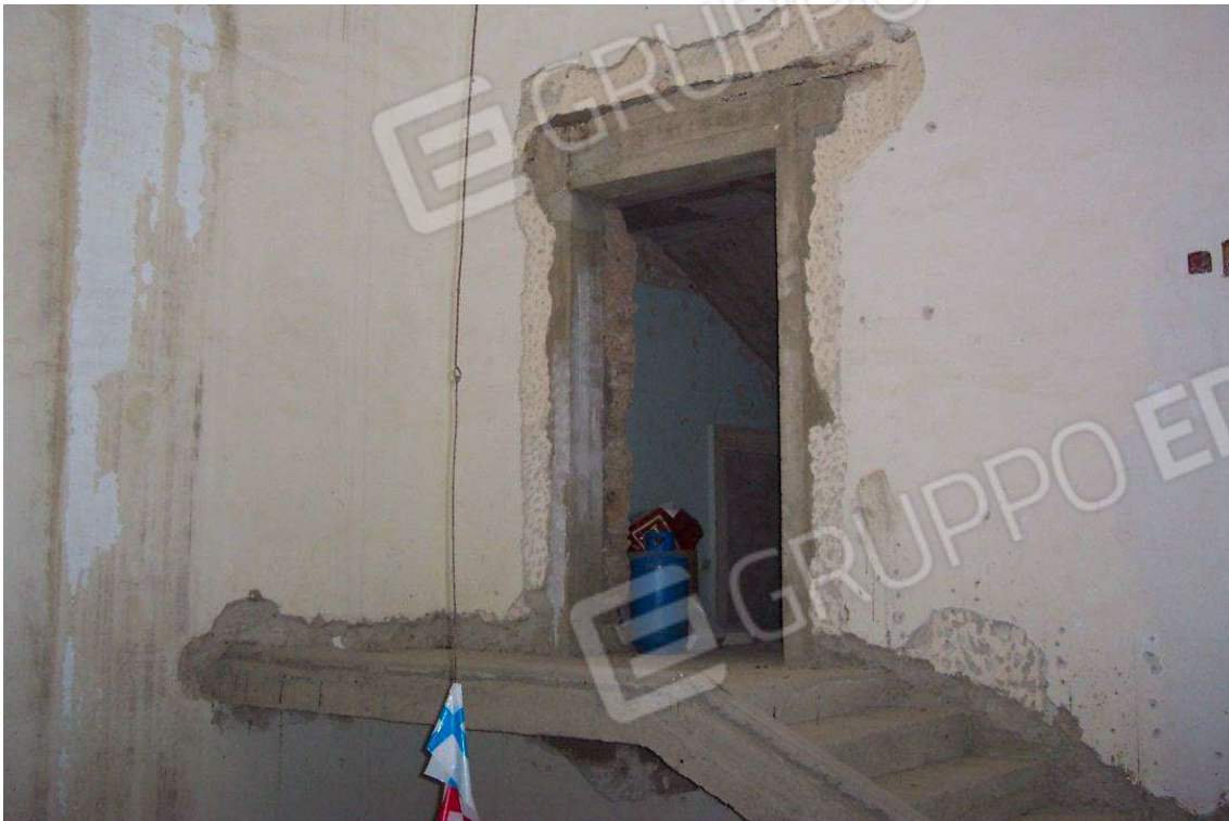
Foto 5 – Lotto 2: Rampa per accesso al vano scala della mansarda particella 74 sub 14