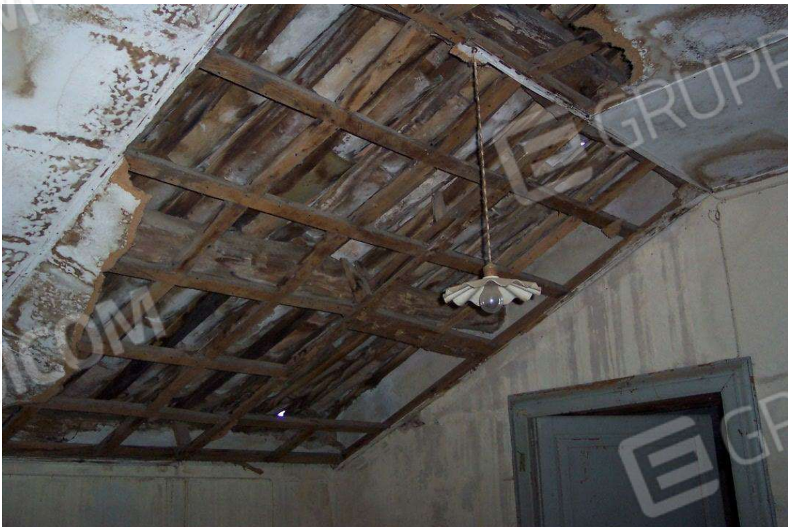
Foto 8 – Lotto 2: particolare dello stato di degrado della copertura e della controsoffittatura