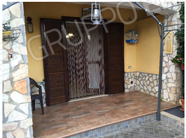
PORTICATO SUL LATO EST