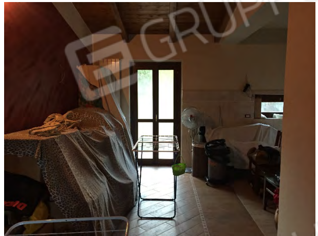
CAMERA AL PRIMO PIANO