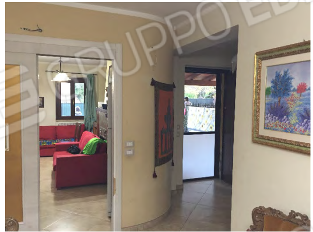
DISIMPEGNO AL PIANO TERRA