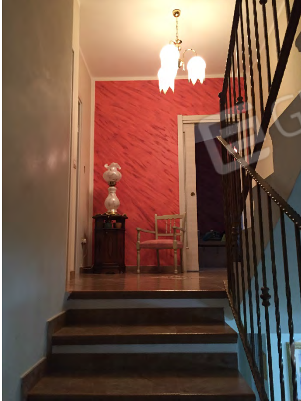
DISIMPEGNO DEL PIANO PRIMO