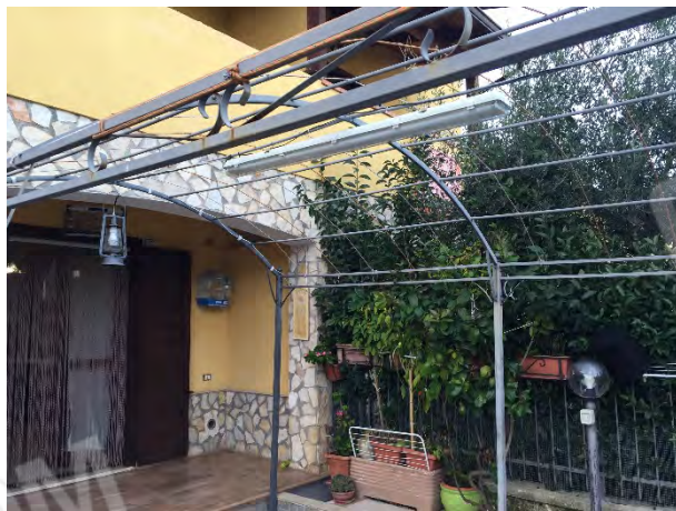
CORTE SUL LATO EST