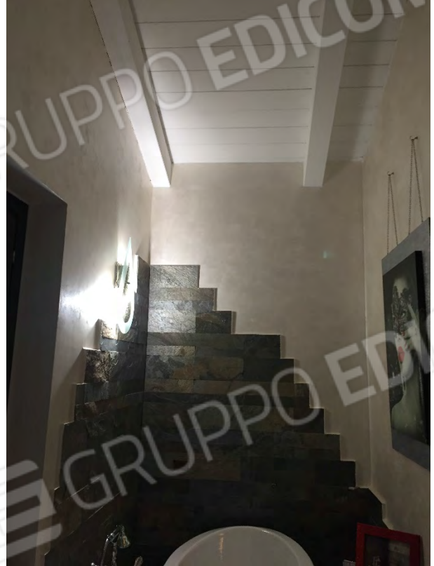
BAGNO NEL SOTTOTETTO