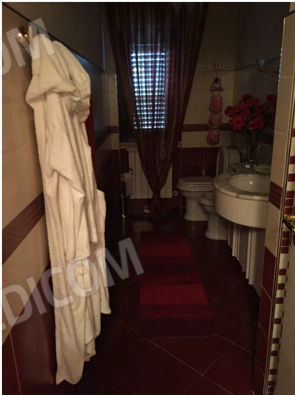
BAGNO AL PRIMO PIANO