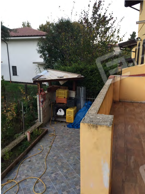
CORTE POSTERIORE - LATO OVEST