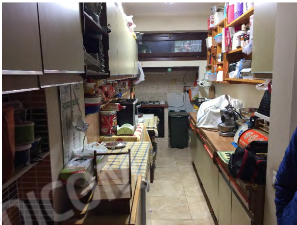
RIPOSTIGLIO AL PIANO TERRA