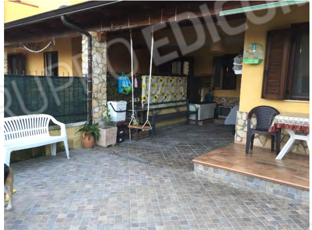
CORTE E PORTICATO FRONTE EST