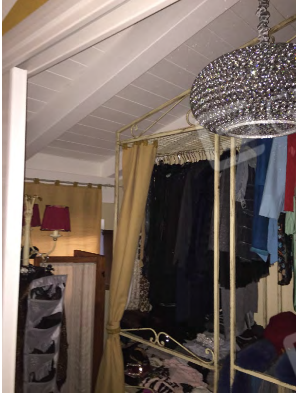
CABINA ARMADIO NEL SOTTOTETTO