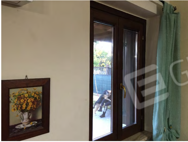
INFISSO AL PIANO TERRA