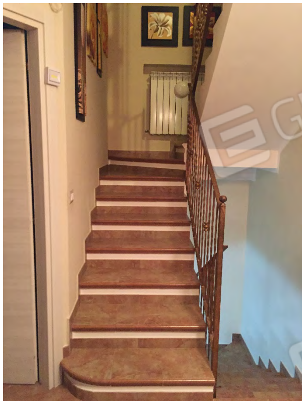
SCALA DI COLLEGAMENTO AL PRIMO PIANO