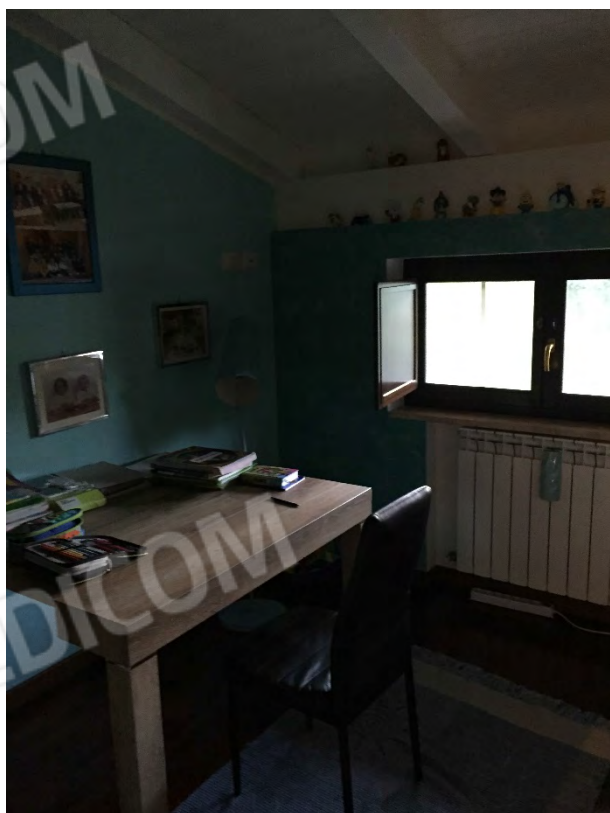
STUDIO NEL SOTTOTETTO