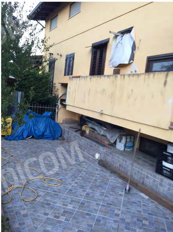
CORTE POSTERIORE - LATO OVEST