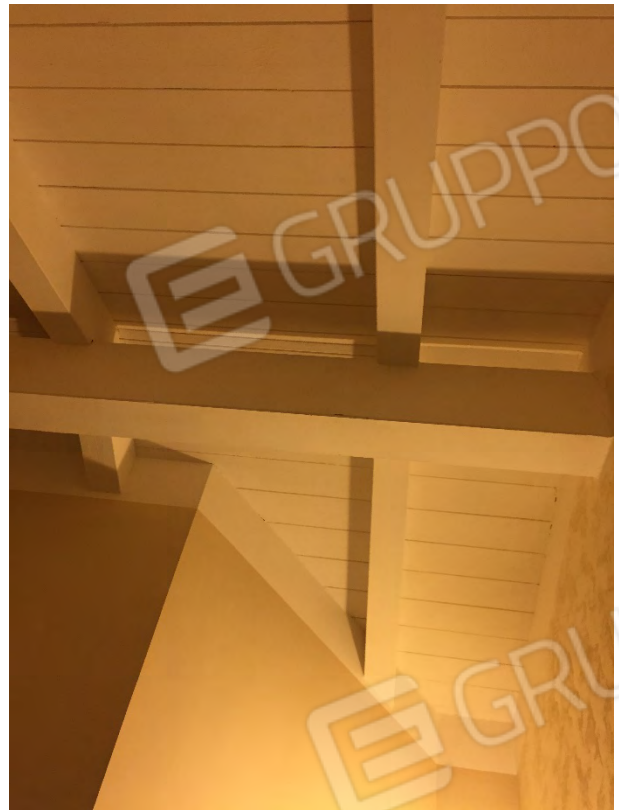
SOTTOTETTO CO TRAVI IN LEGNO