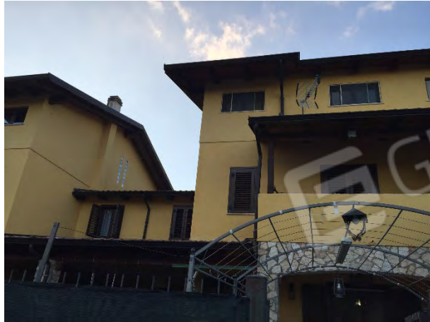
FRONTE EST DEL FABBRICATO