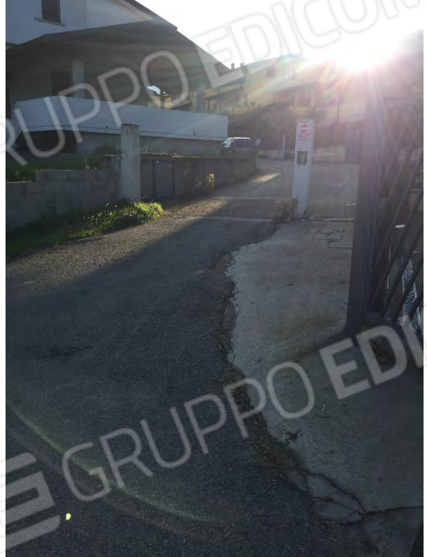
INGRESSO STRADA PRIVATA