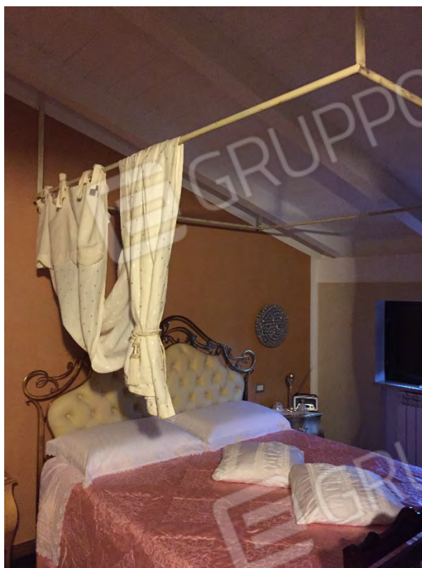
CAMERA DA LETTO NEL SOTTOTETTO