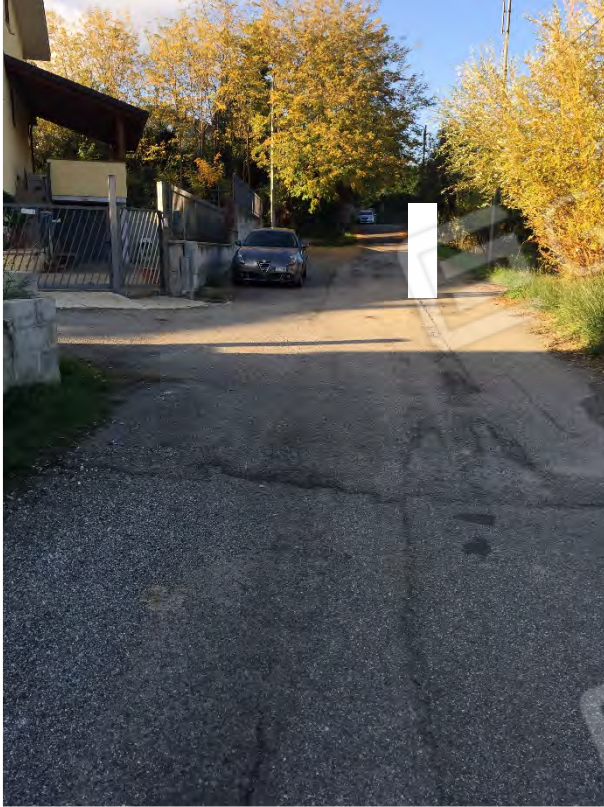
VISTA DI VIA DELL'ACQUA SULFUREA