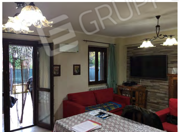
CUCINA-PRANZO AL PIANO TERRA