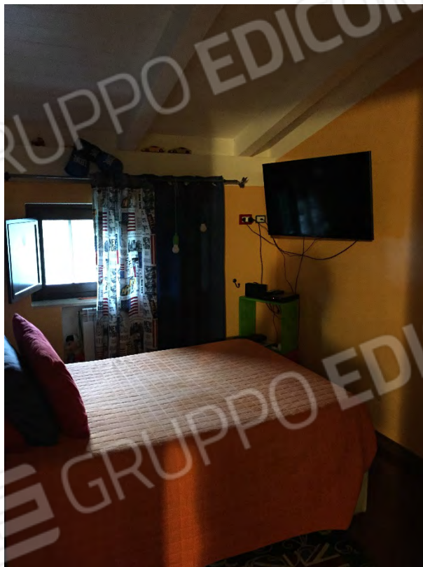
CAMERA NEL SOTTOTETTO