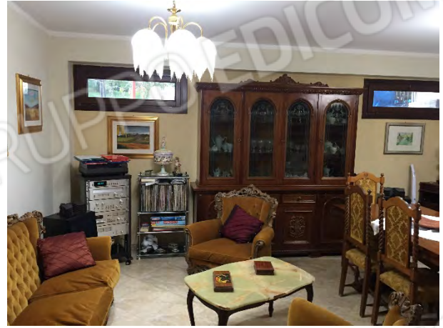
SOGGIORNO AL PIANO TERRA