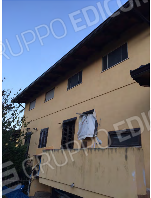
FRONTE POSTERIORE – LATO OVEST