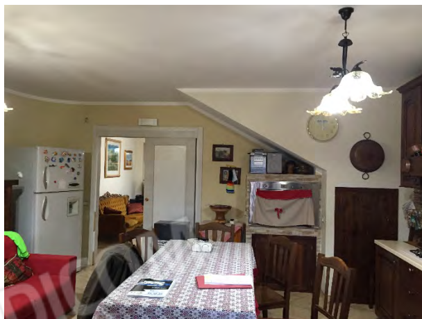
CUCINA-PRANZO AL PIANO TERRA