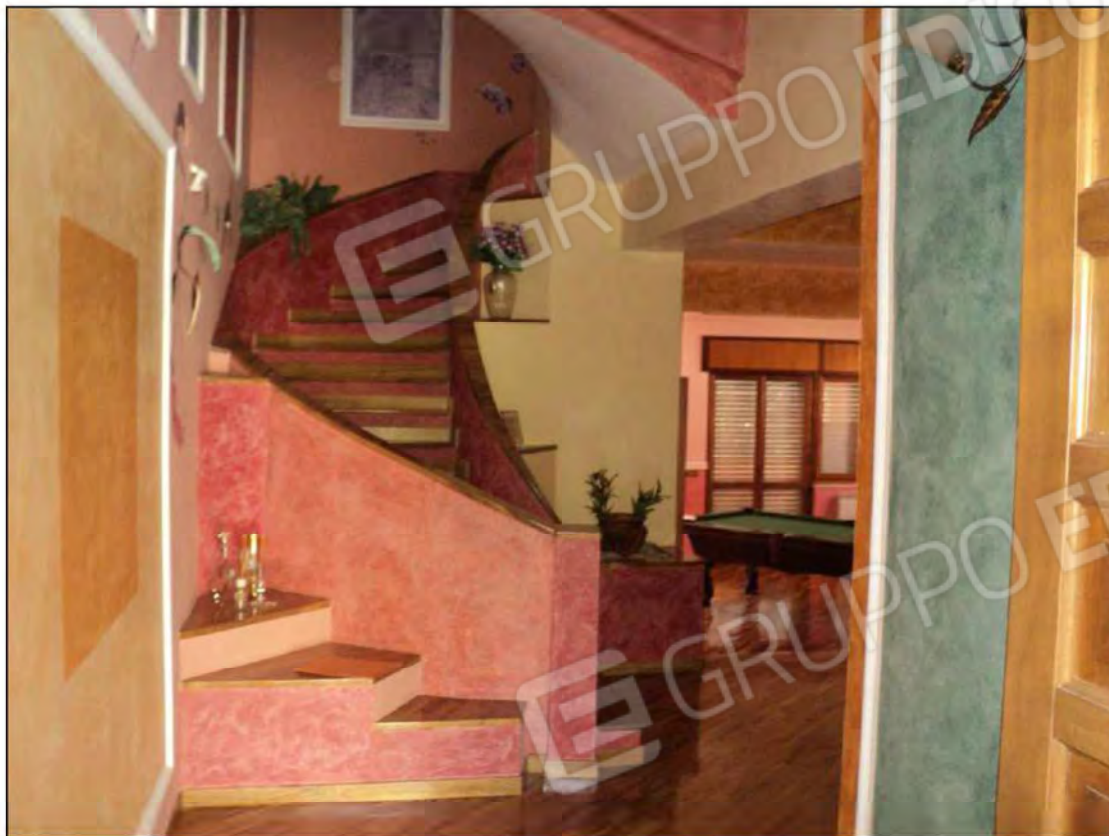
Foto N.13: Ingresso disimpegno con scala circolare al piano terra che collega i vari piani.