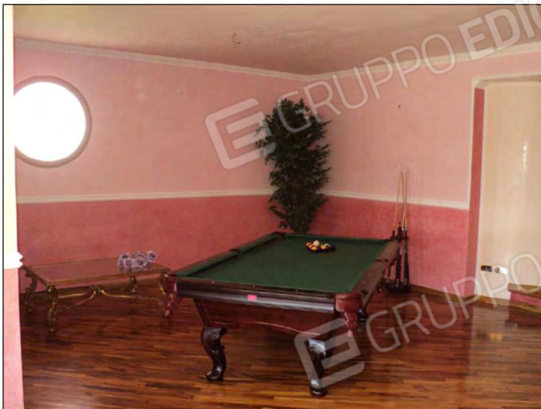
Foto NN.17,18: Ampio Salone a quota diversa dell'ingresso al piano terra