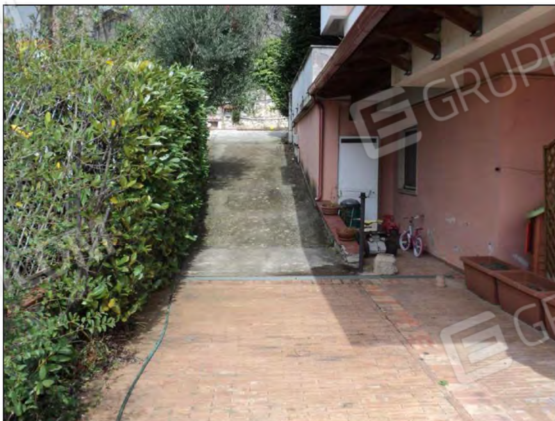
Foto N.4: Rampa ingresso piano seminterrato sul lato Sud della villa.