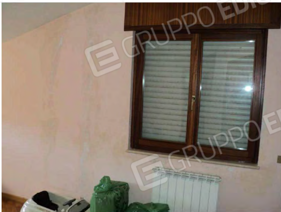
Foto N.31: Locale di sgombero con macchie di umidità alla parete al piano sottotetto.