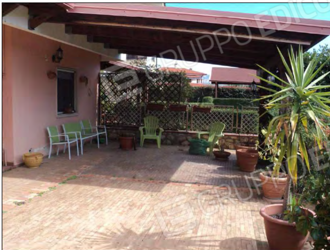
Foto NN.5,6: Spazio esterno coperto e zona a verde sul lato Est della villa.