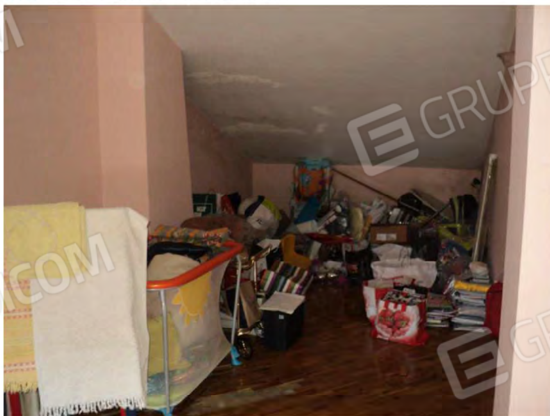
Foto N.30: Locale di sgombero con macchie di umidità al soffitto e alla parete e parquet mancante al piano sottotetto.