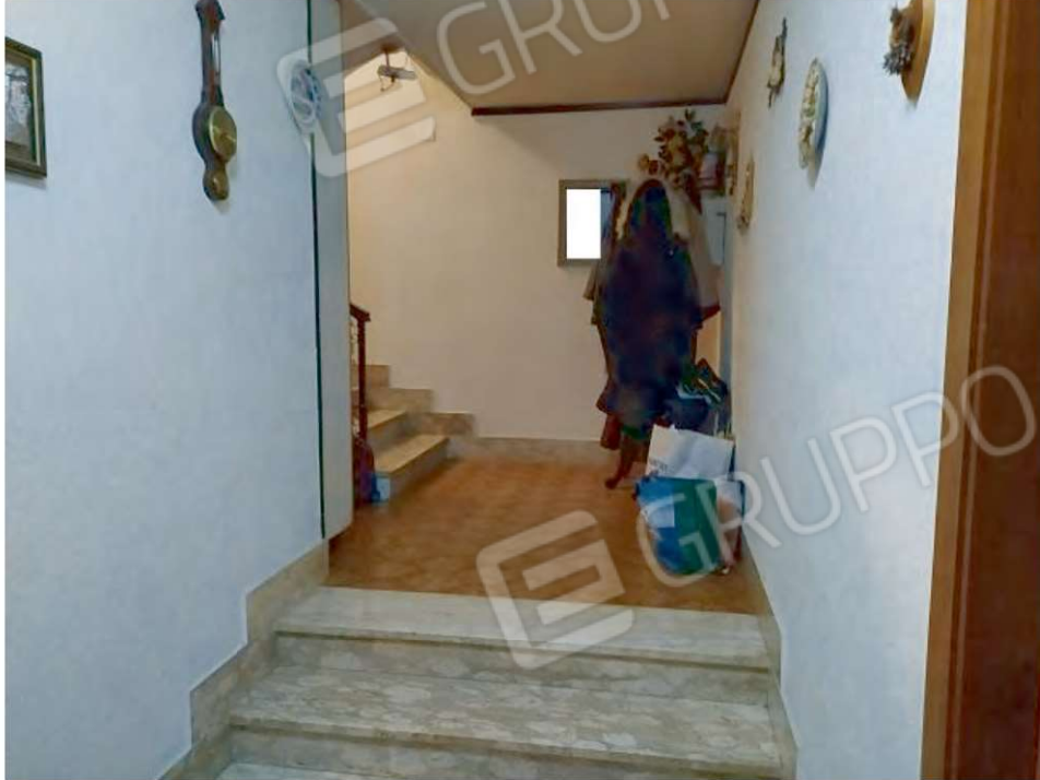
FOTO N. 7 – Ingresso con rampa di scale per l'accesso al primo piano