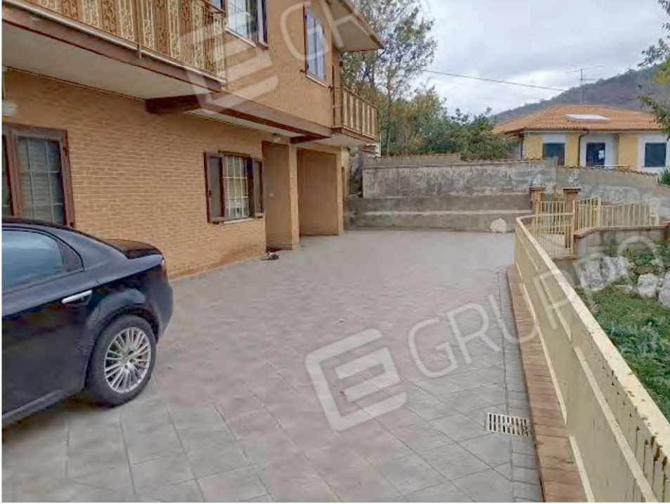
FOTO N. 5 – Vista del cortile pertinenziale antistante il fabbricato