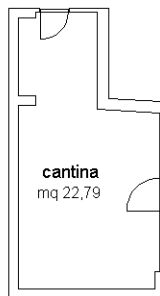
PIANO INTERRATO H=2.50ml