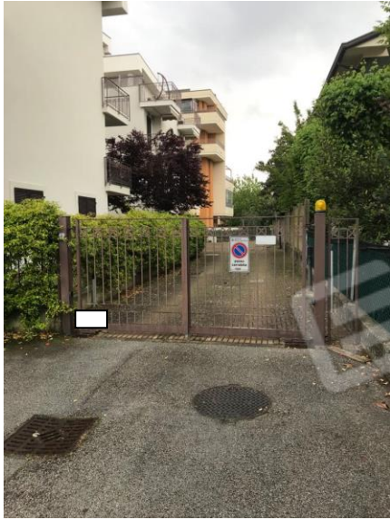
Vista da Via Conti