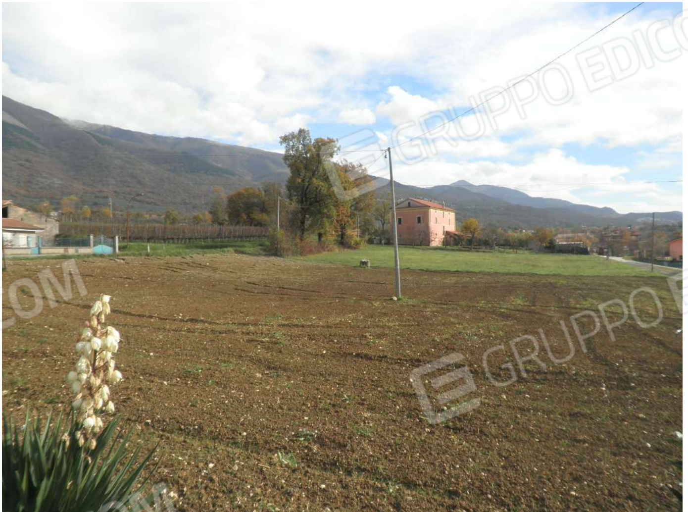
TERRENO DI PROPRIETA' fg 6 p.Ila 15