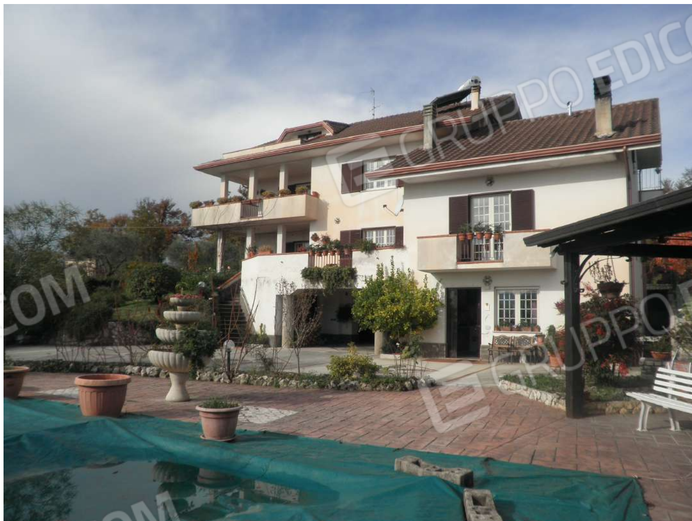
FABBRICATO RESIDENZIALE fg 2 p.lla 346