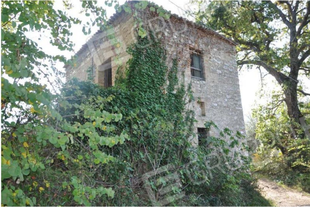
Fotografia n.13 – Lotto n.2 – Altra visuale del fabbricato rurale censito al Foglio n. 34, Particella n. 45, Subalterni nn.1 e 2 ripresa dalla strada vicinale.