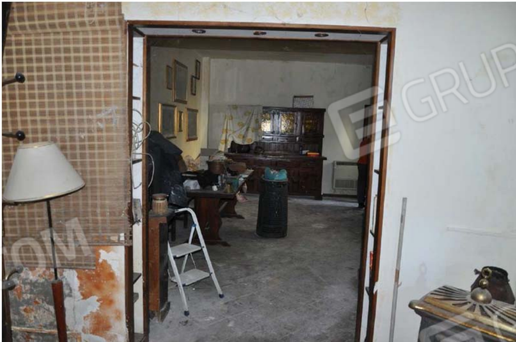
Fotografia n.20 – Lotto n.3 – Piano Terra – L'Ambiente Soggiorno-Pranzo.