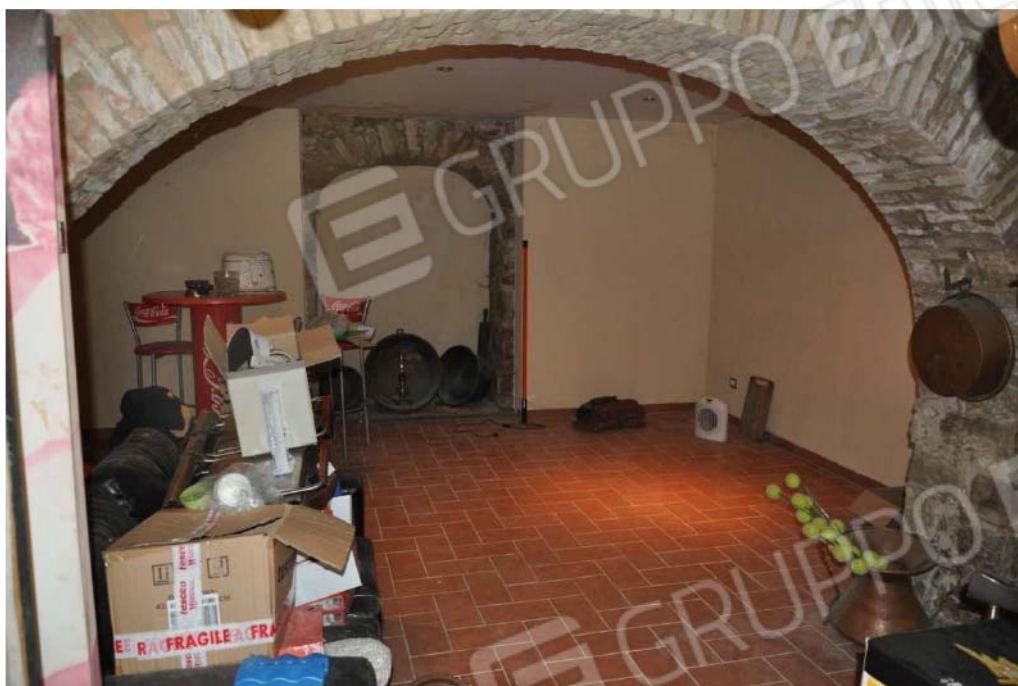
Fotografia n.5 – Lotto n.1 – Piano Seminterrato. L’Ambiente Deposito.