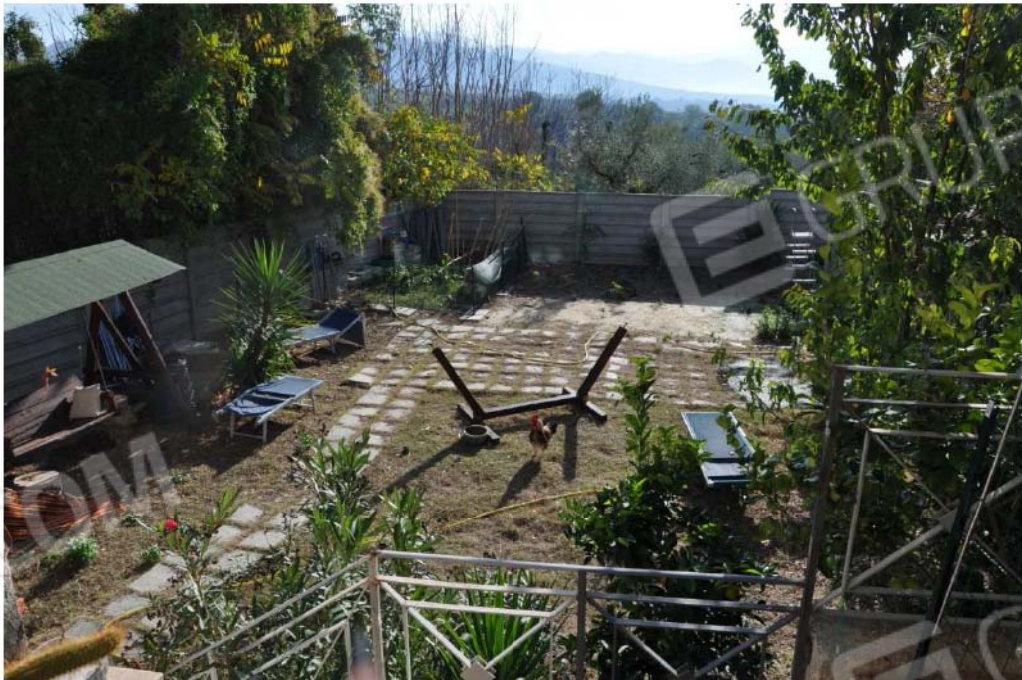
Fotografia n.4 – Lotto n.1 – Parte della corte esterna di pertinenza del Fabbricato sito in Via Colle della Noce n.1 ripreso dal corpo di fabbrica.