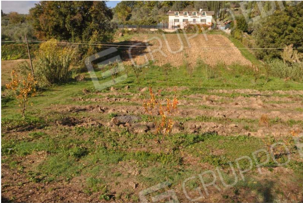
Fotografia n.17 – Lotto n.2 – La Particella di Terreno censita al Foglio n. 34 con il numero 87.