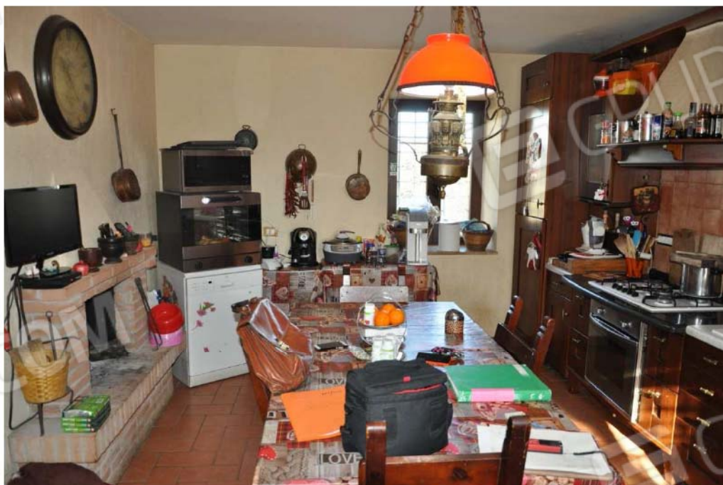
Fotografia n.6 – Lotto n.1 – Piano Terra. L’Ambiente Cucina.