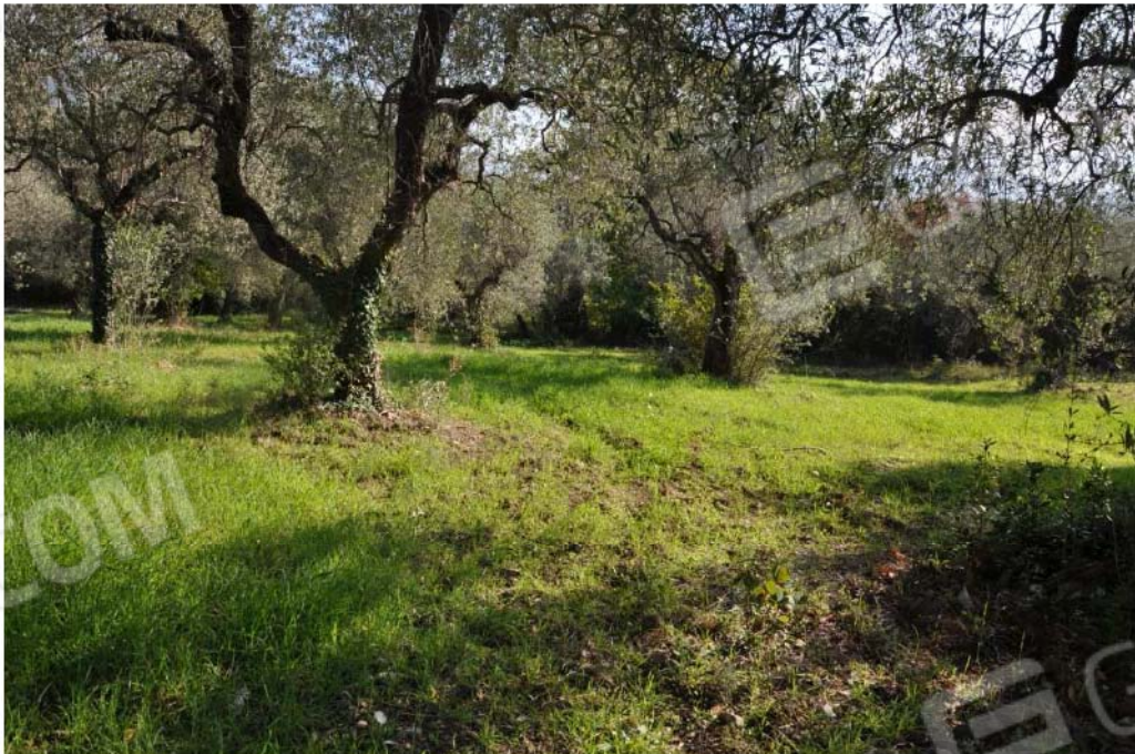
Fotografia n.16 – Lotto n.2 – La Particella di Terreno censita al Foglio n. 34, con il numero 46.