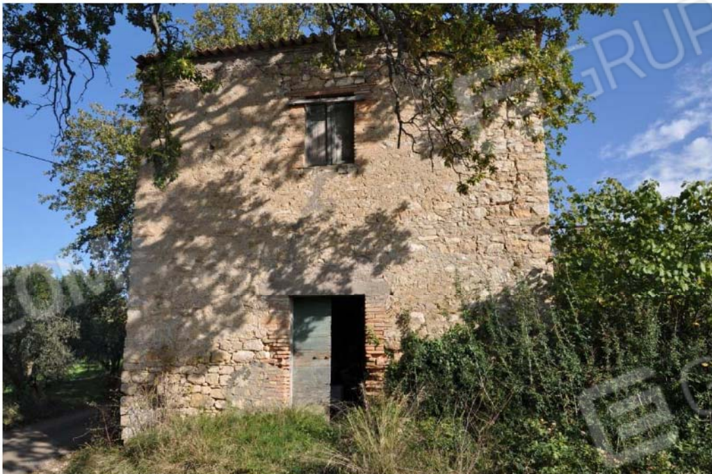
Fotografia n.12 – Lotto n.2 – Altra visuale del fabbricato rurale censito alla Particella n. 45, Subalterni nn.1 e 2.