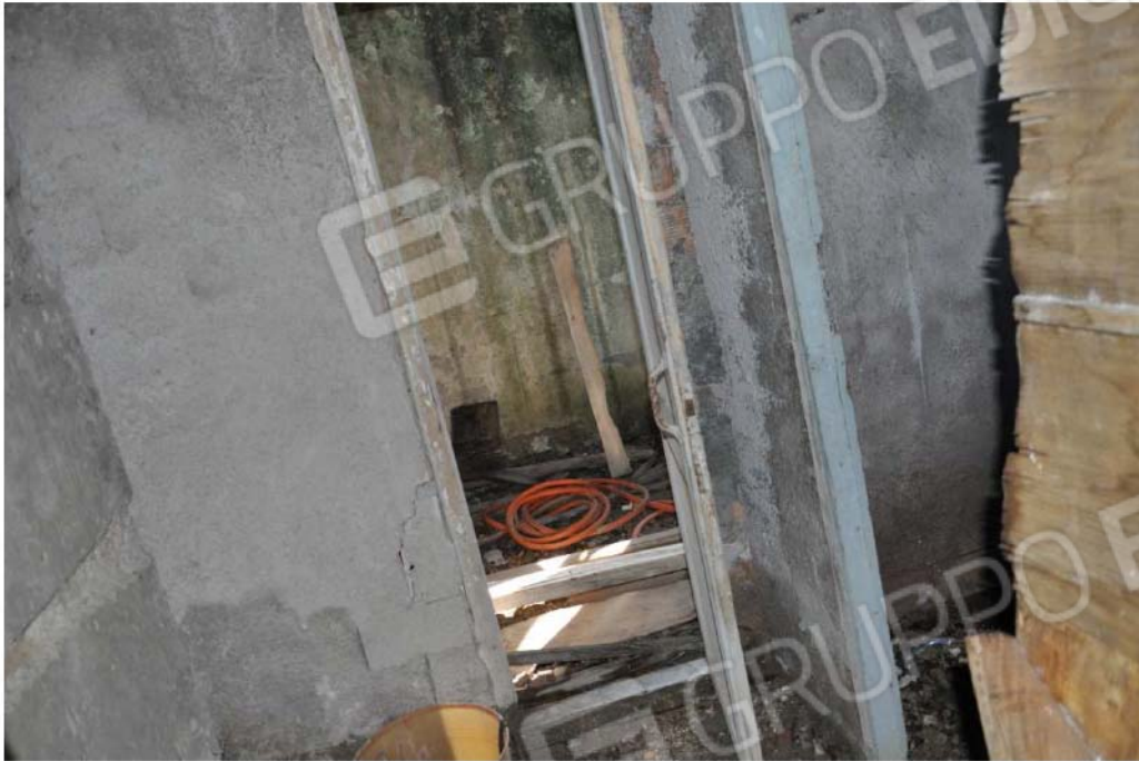
Fotografia n.15 – Lotto n.2 – Piano Primo – Gli Ambienti interni.