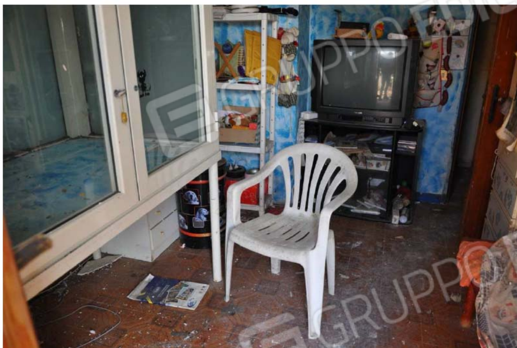
Fotografia n.23 – Lotto n.3 – Piano Primo – L’Ambiente Camera.