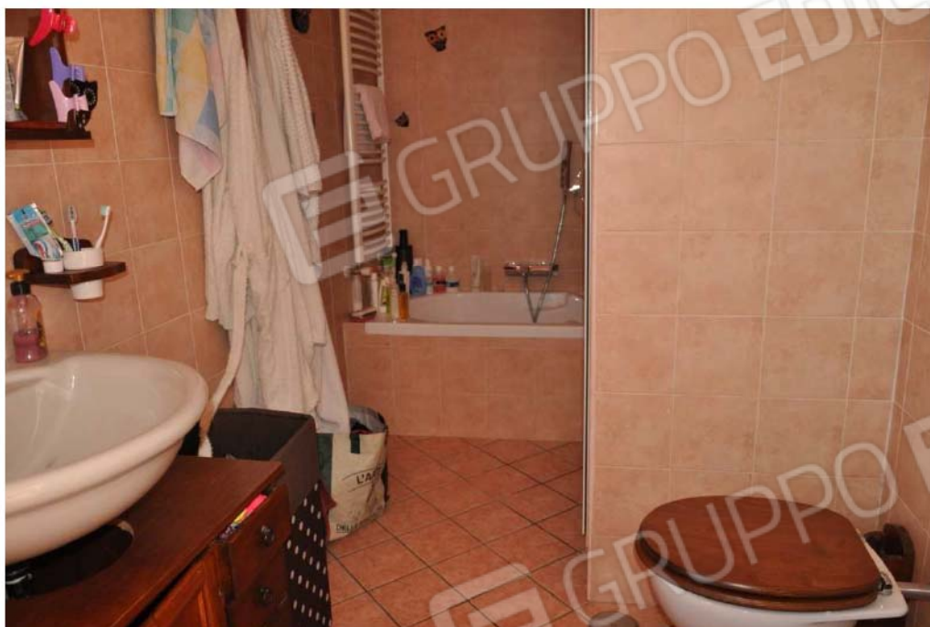
Fotografia n.9 – Lotto n.1 – Piano Primo. L'Ambiente Bagno.