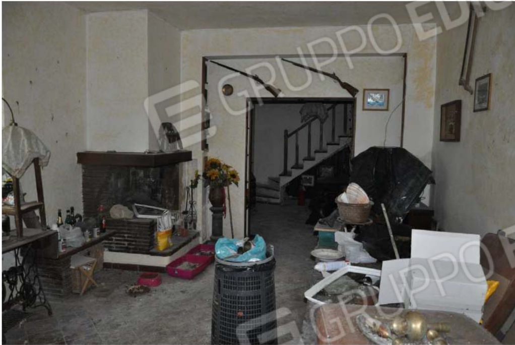
Fotografia n.21 – Lotto n.3 – Piano Terra – Altra visuale dell’Ambiente Soggiorno-Pranzo.