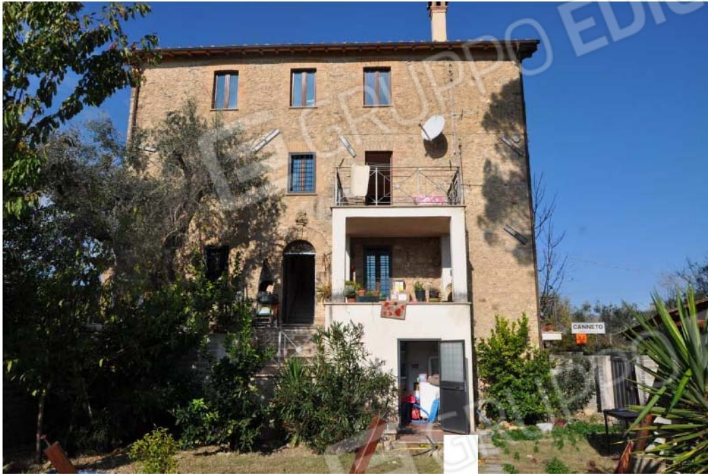
Fotografia n.3 – Lotto n.1 – Il prospetto Est del Fabbricato sito in Via Colle della Noce n.1 ripreso dalla corte esterna di pertinenza.