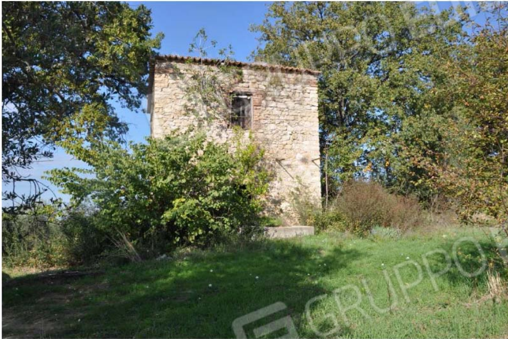
Fotografia n.11 – Lotto n.2 – Il fabbricato rurale censito al Foglio n.34, Particella n. 45, Subalterni nn.1 e 2.