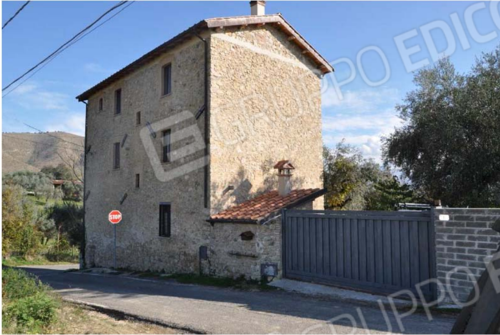
Fotografia n.1 – Lotto n.1 – I prospetti Sud ed Ovest del Fabbricato sito in Via Colle della Noce n.1 censito al Foglio n. 34, Part. n. 41.