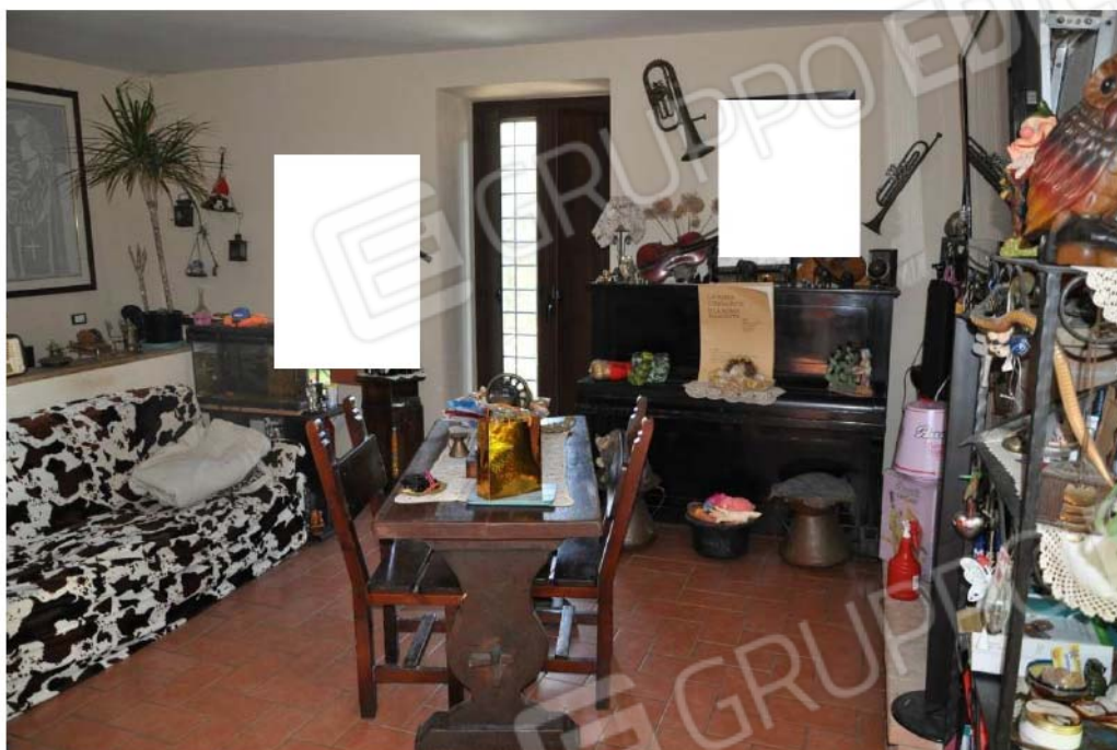
Fotografia n.7 – Lotto n.1 – Piano Terra. L’Ambiente Soggiorno-Pranzo.