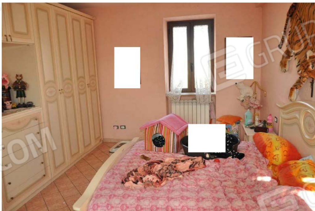
Fotografia n.8 – Lotto n.1 – Piano Primo. L’Ambiente Camera.