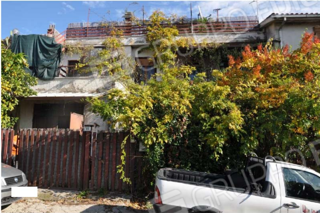
Fotografia n.19 – Lotto n.3 – Il fabbricato ubicato in Via XXV Aprile n.11 censito al Foglio n. 35, Particella n. 450.