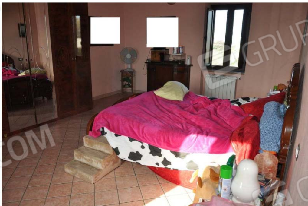
Fotografia n.10 – Lotto n.1 – Piano Secondo. L'Ambiente Camera.