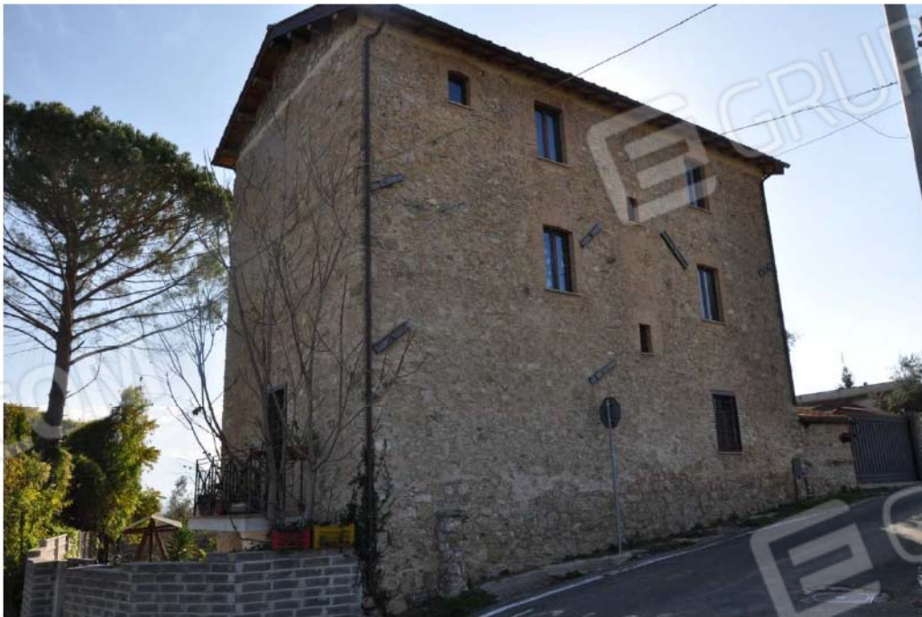
Fotografia n.2 – Lotto n.1 – I prospetti Nord ed Ovest del Fabbricato sito in Via Colle della Noce n.1.