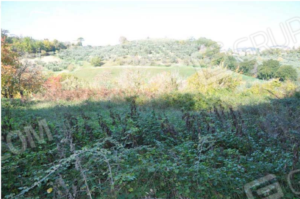
Fotografia n.18 – Lotto n.2 – La Particella di Terreno censita al Foglio n. 36 con il numero 38.