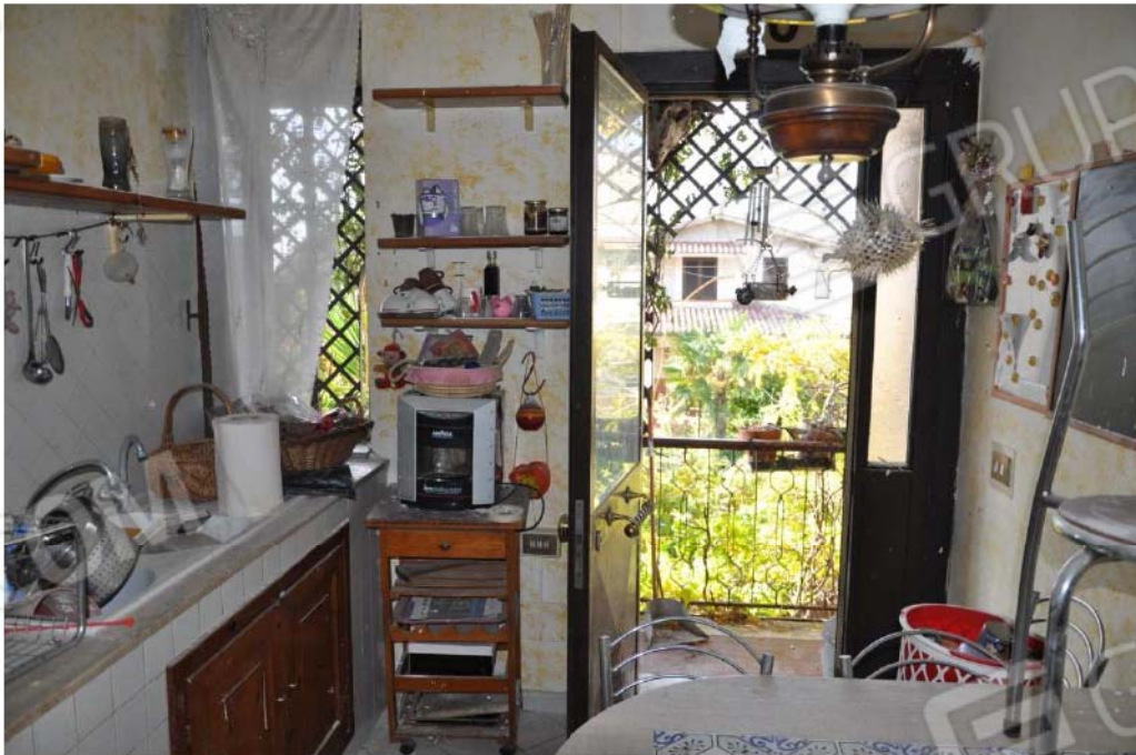
Fotografia n.22 – Lotto n.3 – Piano Primo – L’Ambiente Cucina.