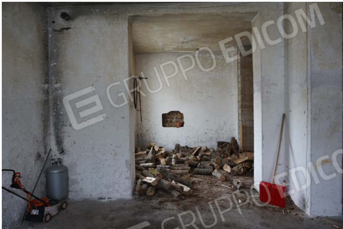
Foto n. 2 Lab. artigianale 2 Piano Terra