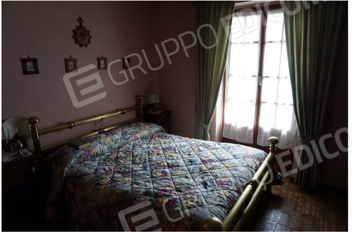
Foto n. 4 Camera 2 Piano Primo