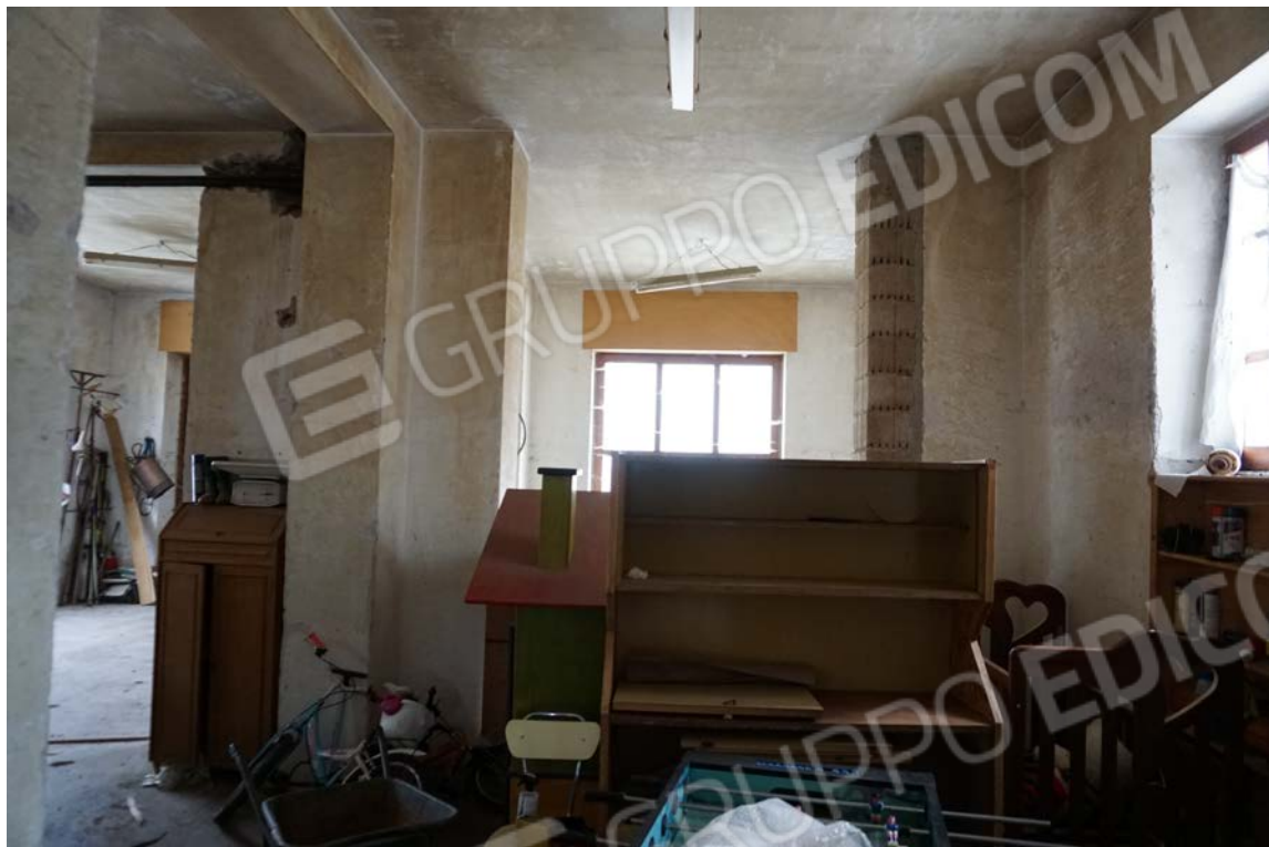
Foto n. 4 Lab. artigianale 4 Piano terra