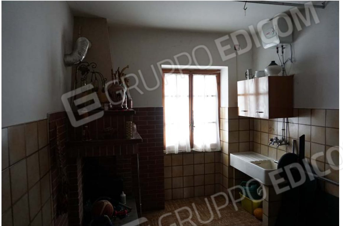
Foto n. 2 Cucina 1 Piano Terra