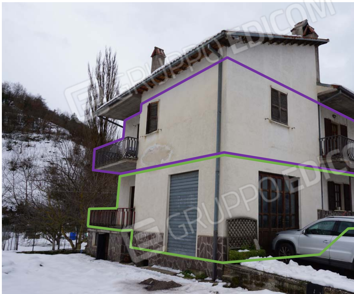
Foto n. 4 Esterno del Fabbricato Prospetto Nord - Est Lotto 001 - 002 - 003 - 004