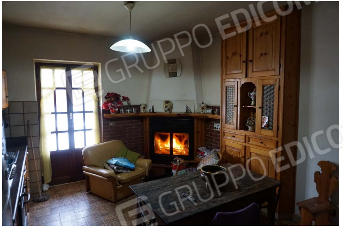
Foto n. 2 Soggiorno Piano Primo