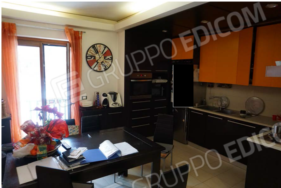
Foto n. 2 Camera 3 Piano Primo