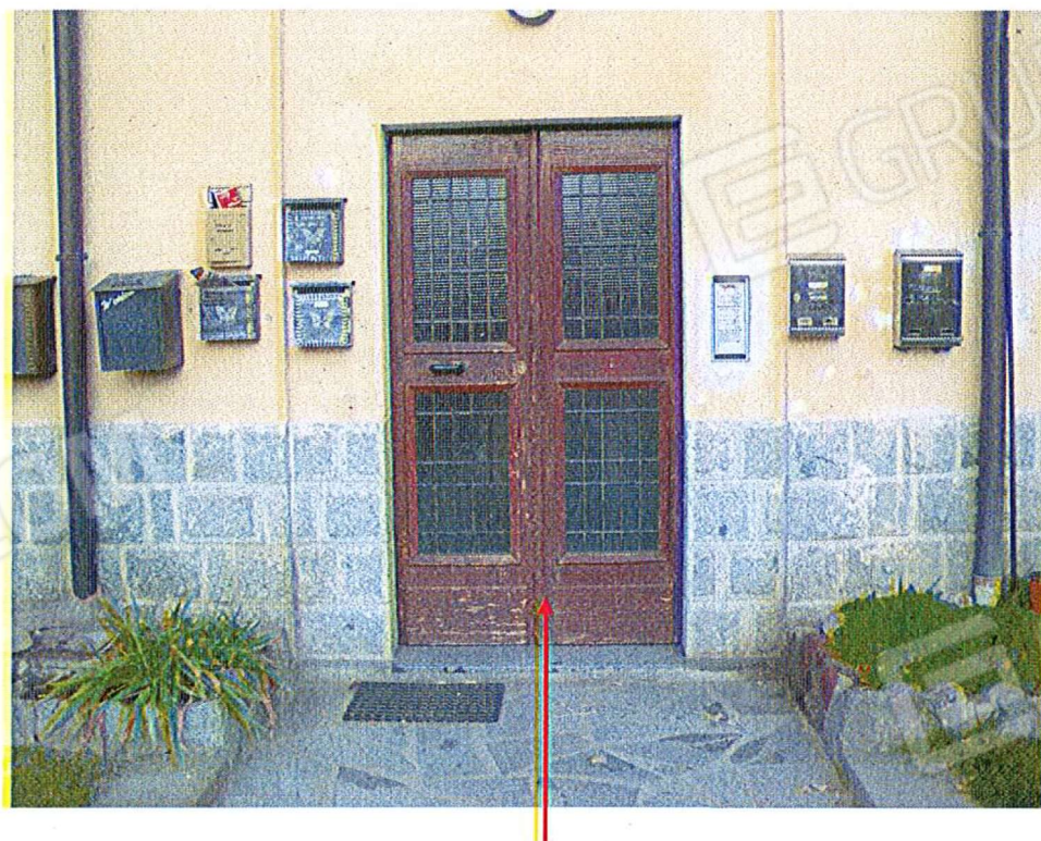
Portone di accesso al complesso immobiliare