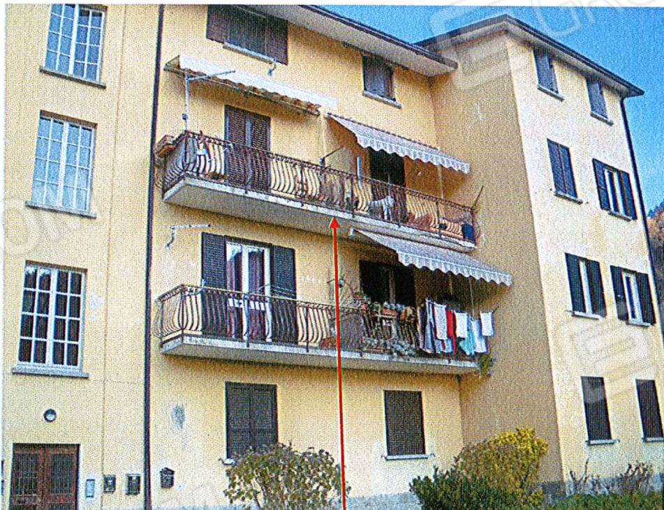
Vista fronte sud- ovest- u.i. mapp. 1225 sub 10- piano 2 ^