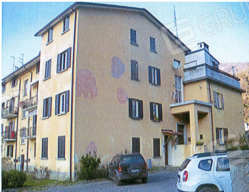
Vista fronte sud- est