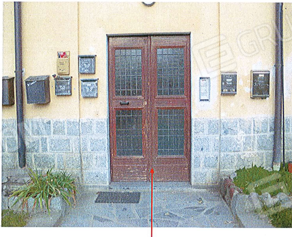
Portone di accesso al complesso immobiliare