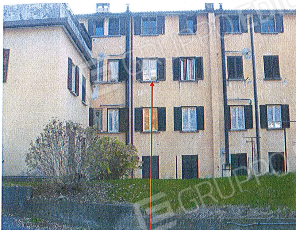
Vista fronte nord- est- u.i. mapp. 1225 sub 10- piano 2 ^