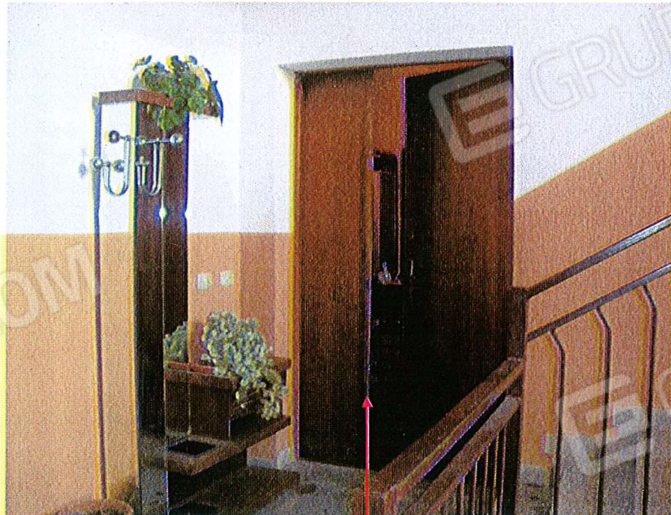
Vista entrata all'appartamento di cui al mapp. 1225 sub 10- piano 2 a