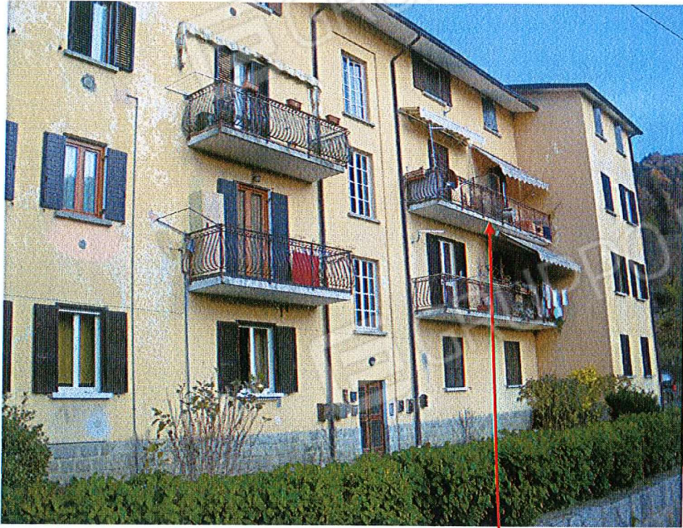
Vista fronte sud- ovest- u.i. mapp. 1225 sub 10 - piano 2 ^

Viste generali del fabbricato in cui sono inseriti i mappali oggetto di pignoramento