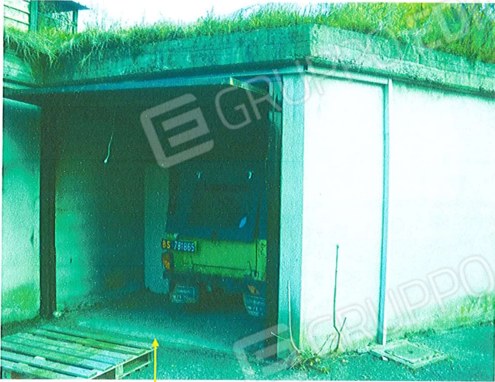
Vista autorimessa di cui ai sub. 32