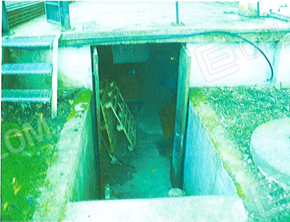
Vista locale caldaia dismesso ( comune ad altre u.i. )