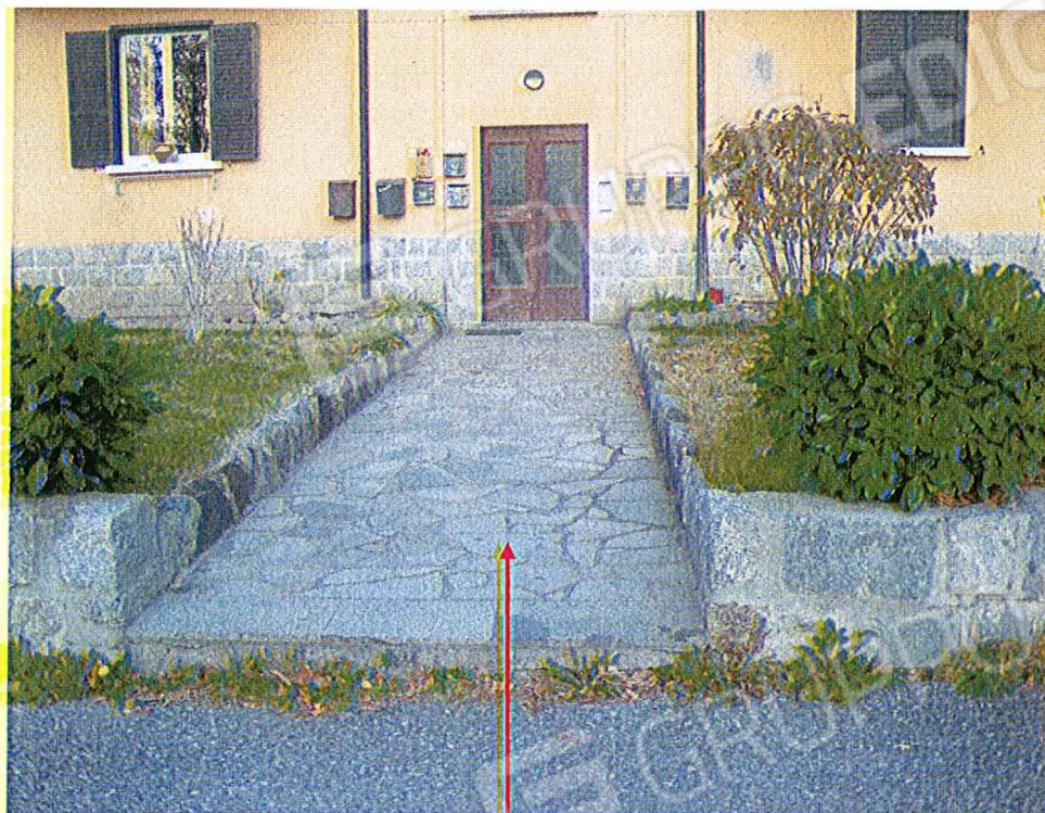
Accesso pedonale al complesso immobiliare