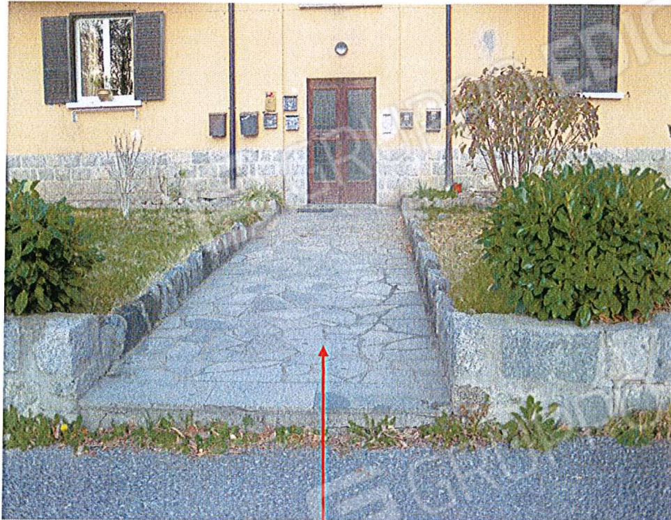
Accesso pedonale al complesso immobiliare