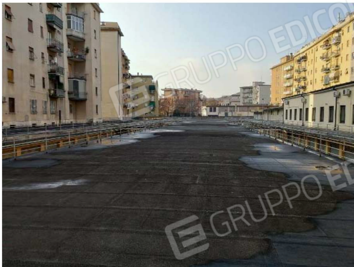
Foto 03 – esterno edificio, copertura autorimesse non accessibile sul retro dell'immobile , vista camere e cucina