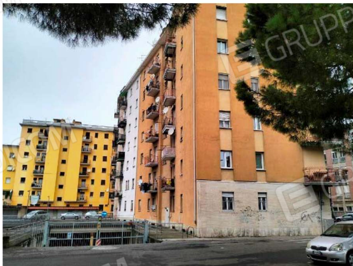
Foto 02 – esterno edificio , prospetto laterale e retro del complesso condominiale