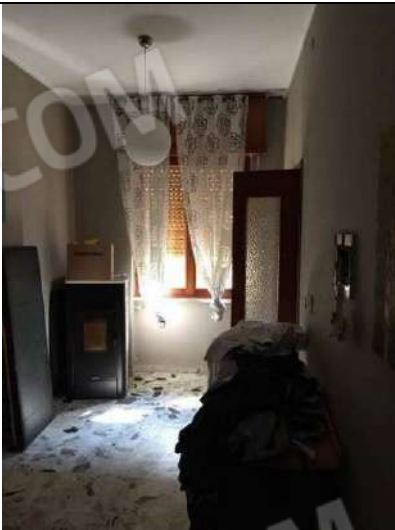
Fig. 17: Corridoio