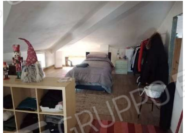
Fig. 28: Sottotetto/soffitta comune (trasformata in abitazione)