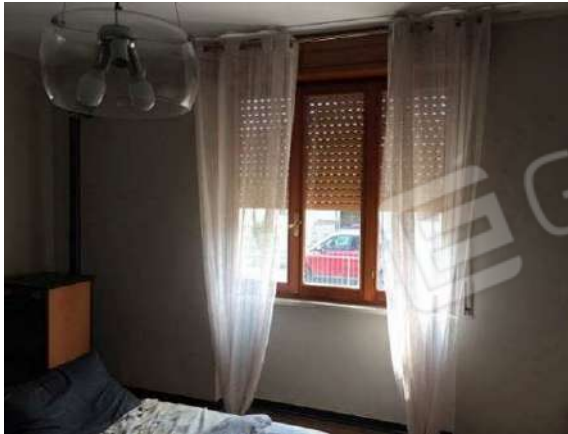
Fig. 19: Camera