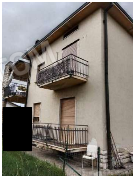
Fig. 07: Prospetto sud