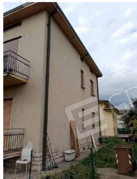
Fig. 08: Prospetto est