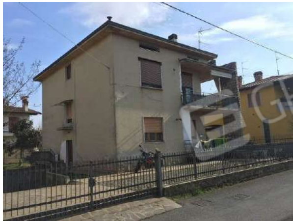
Fig. 03: Vista del fabbricato da Nord-Ovest da via Ortigara