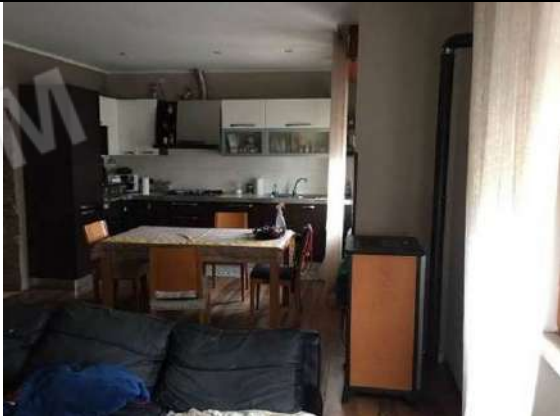
Fig. 15: Soggiorno /cucina