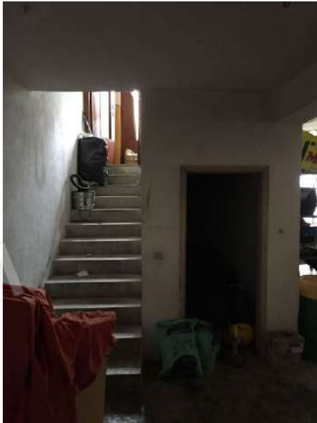
Fig. 21: Piano seminterrato