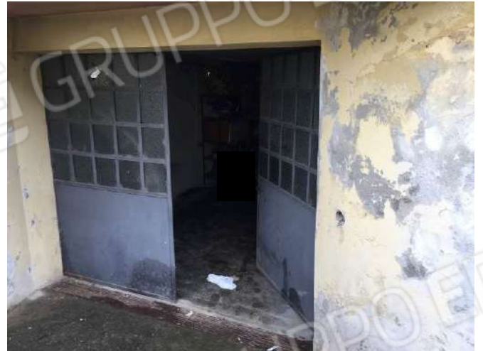
Fig. 22: Ingresso all'autorimessa