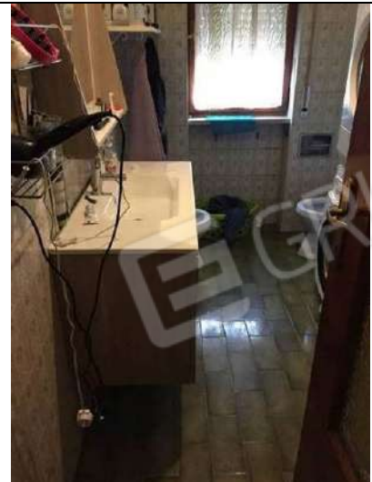
Fig. 18: Bagno