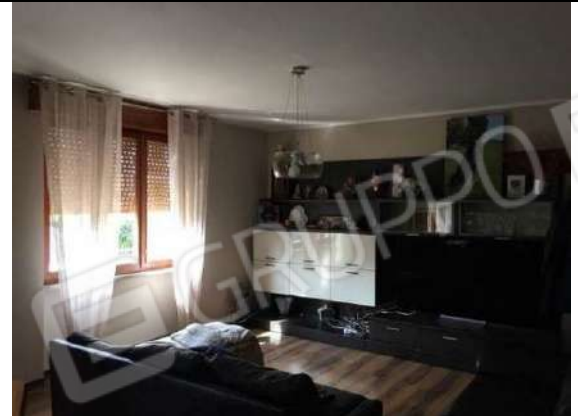
Fig. 16: Soggiorno