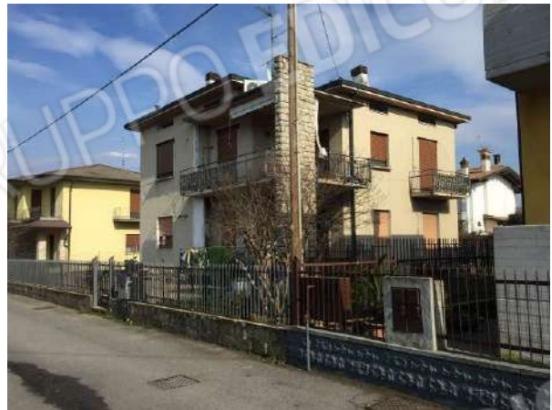
Fig. 04: Vista del fabbricato da Sud-Ovest da via Ortigara