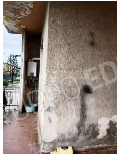
Fig. 14: Portico esclusivo