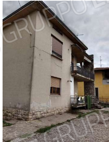
Fig. 06: Prospetto Ovest