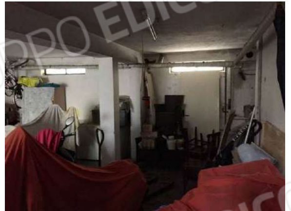
Fig. 20: Autorimessa seminterrata