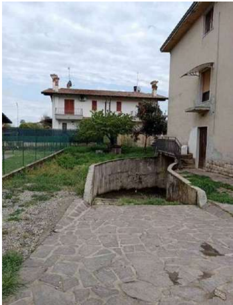
Fig. 05: Prospetto Nord con scivolo di accesso al piano interrato