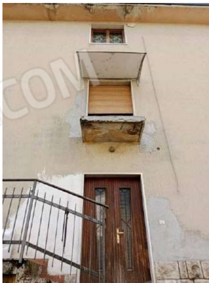
Fig. 23: Accesso al vano scale comune dalla corte