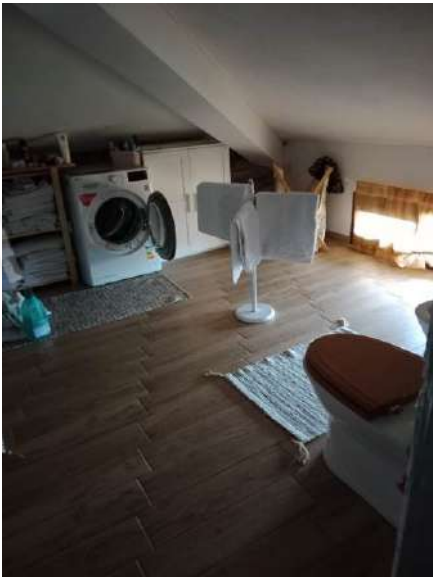
Fig. 27: Bagno lavanderia piano sottotetto/soffitta (trasformato in abitazione)