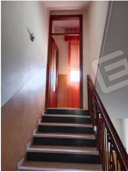
Fig. 25: Scala comune con accesso precluso