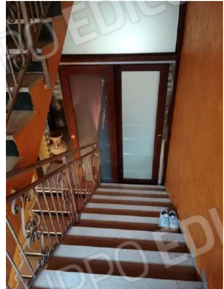
Fig. 26: Scala comune piano primo con accesso precluso al piano sottotetto