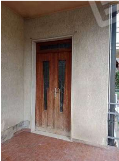
Fig. 13: Ingresso esclusivo all'abitazione dal portico