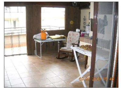
Foto 06 - Vista interna