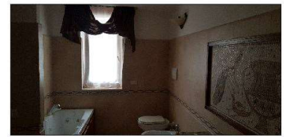
Foto 04 - Bagno