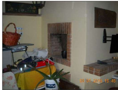
Foto 07 - Vista interna