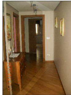
Foto 03 - Disimpegno