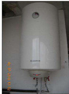
Foto 17 - Boiler elettrico