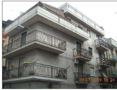
Foto 14 - Prospetto esterno