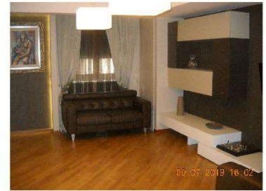
Foto 02 - Salone