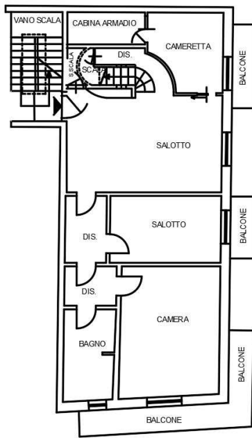
Planimetria stato attuale