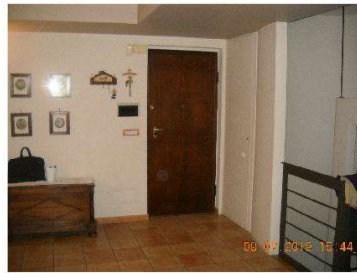
Foto 01 - Ingresso