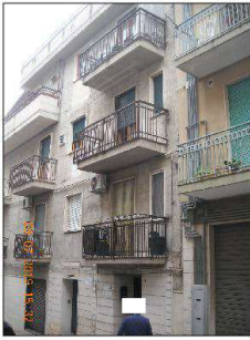
Foto 13 - Prospetto esterno