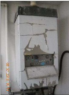
Foto 16 - Caldaia