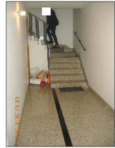
Foto 15 - Disimpegno