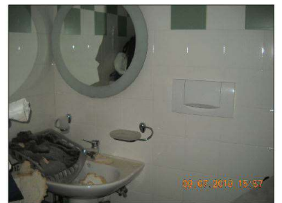
Foto 12 - Bagno