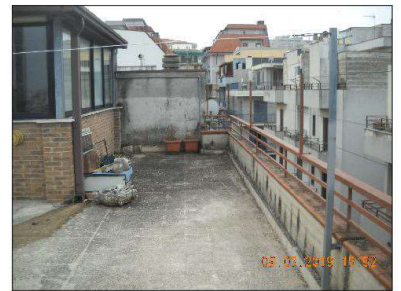
Foto 10 - Vista esterna