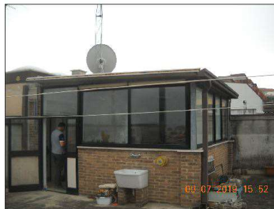
Foto 11 - Vista esterna