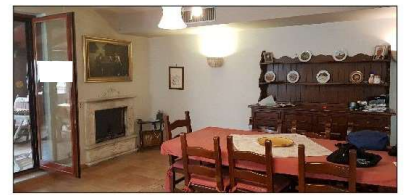
Foto 08 - Vista interna