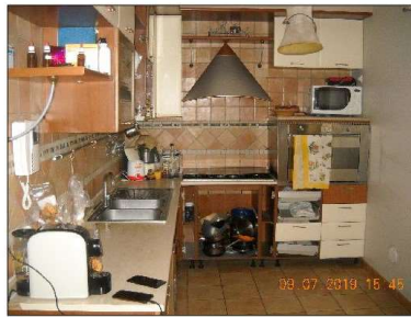
Foto 05 - Cucina