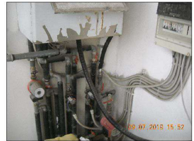
Foto 18 - Impiantistica