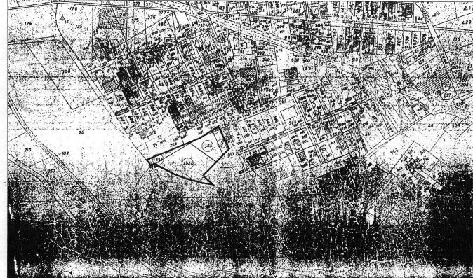
STRALCIO PLANIMETRICO CATASTALE AGGIORNATO scala 1:4000

A DEL L.C. I P.R.C. ATASTALE EROFOTOGRAMMETRICO