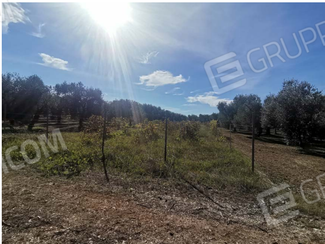
6. vista da nord