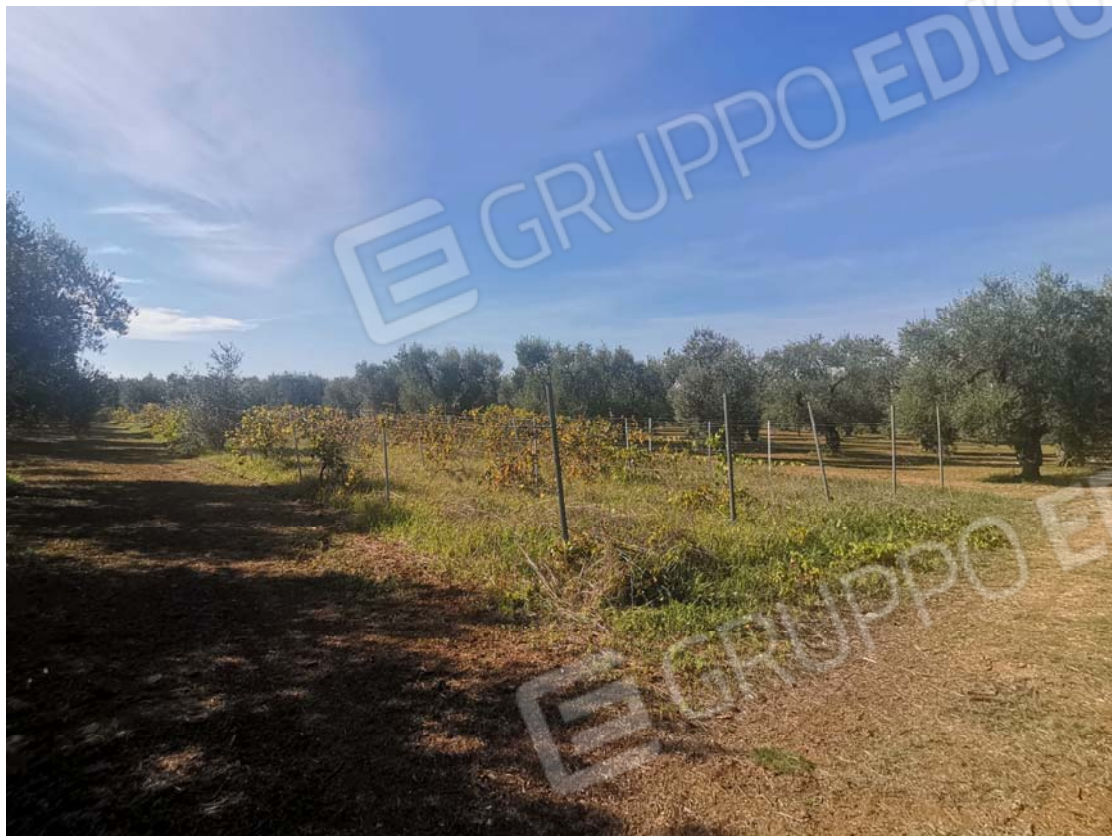
5. vista da nord est