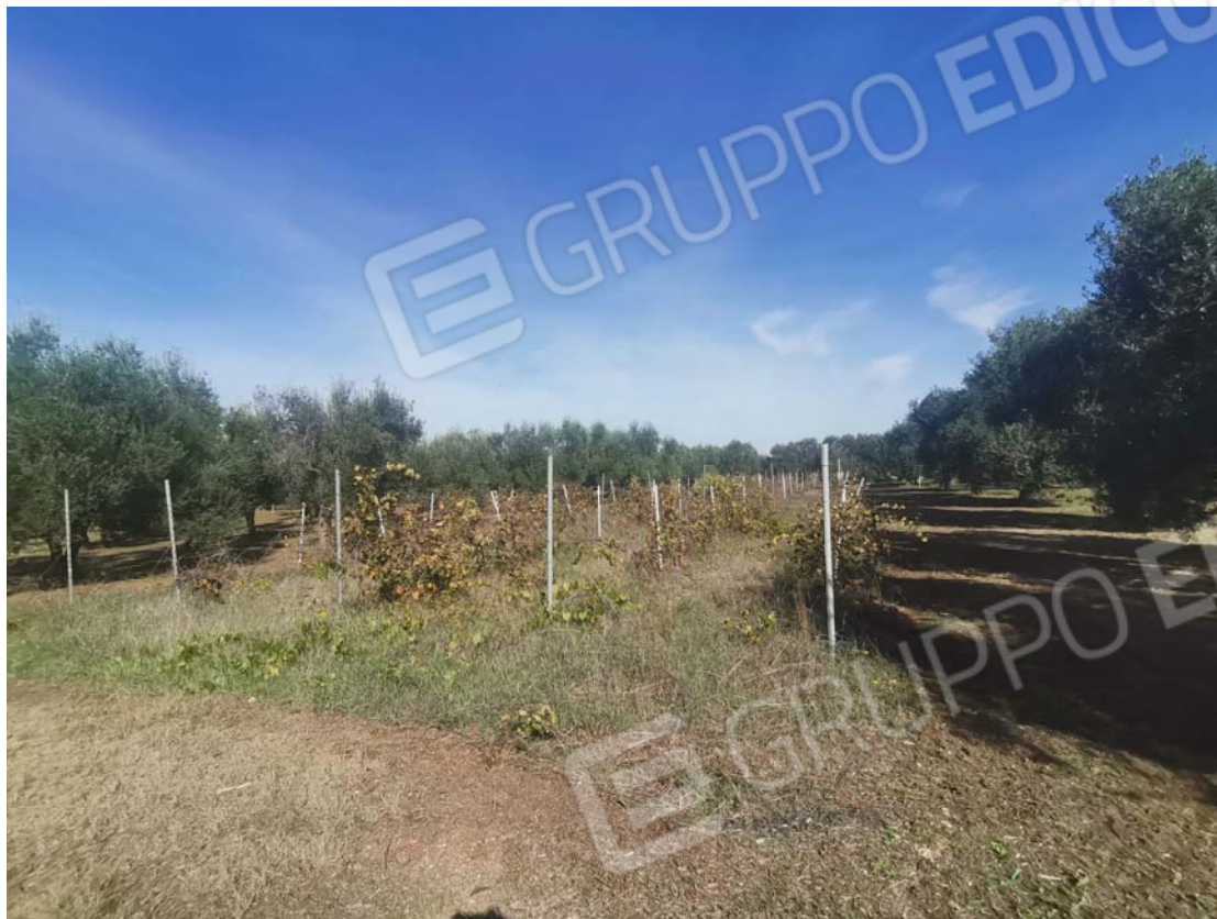
3. vista da sud