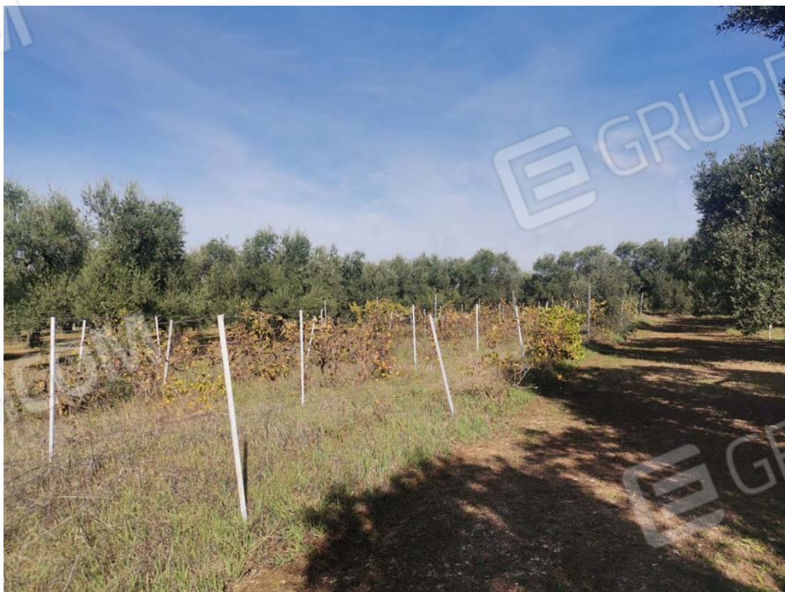
4. vista lato est