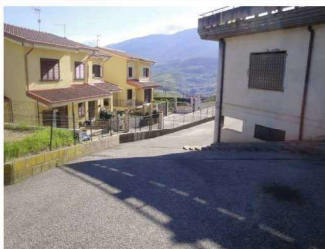
Terreni lotto 2.B

IMMOBILI GRUPPO 2 - TERRENI LOTTI "2.A" E "2.B" DOCUMENTAZIONE FOTOGRAFICA - PAG. 1 DI 1