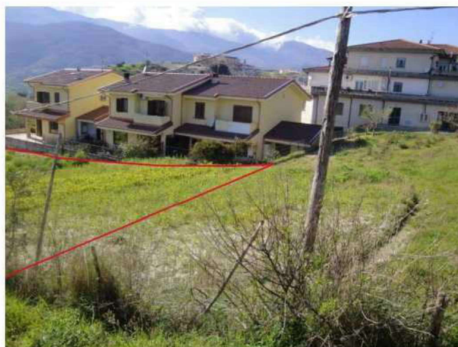
Terreni lotto 2.A