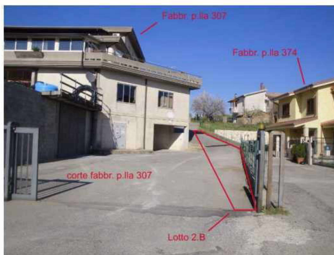
Terreni lotto 2.B