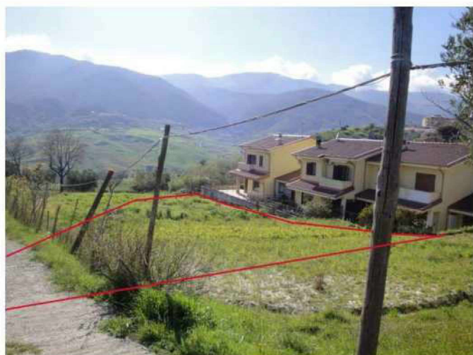
Terreni lotto 2.A

RELAZIONE DI STIMA DEGLI IMMOBILI ACQUISITI AL FALLIMENTO (SENTENZA N° 8/2013 R.F. TRIBUNALE DI COSENZA)