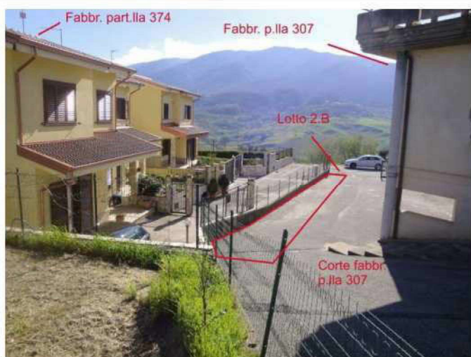
Terreni lotto 2.B