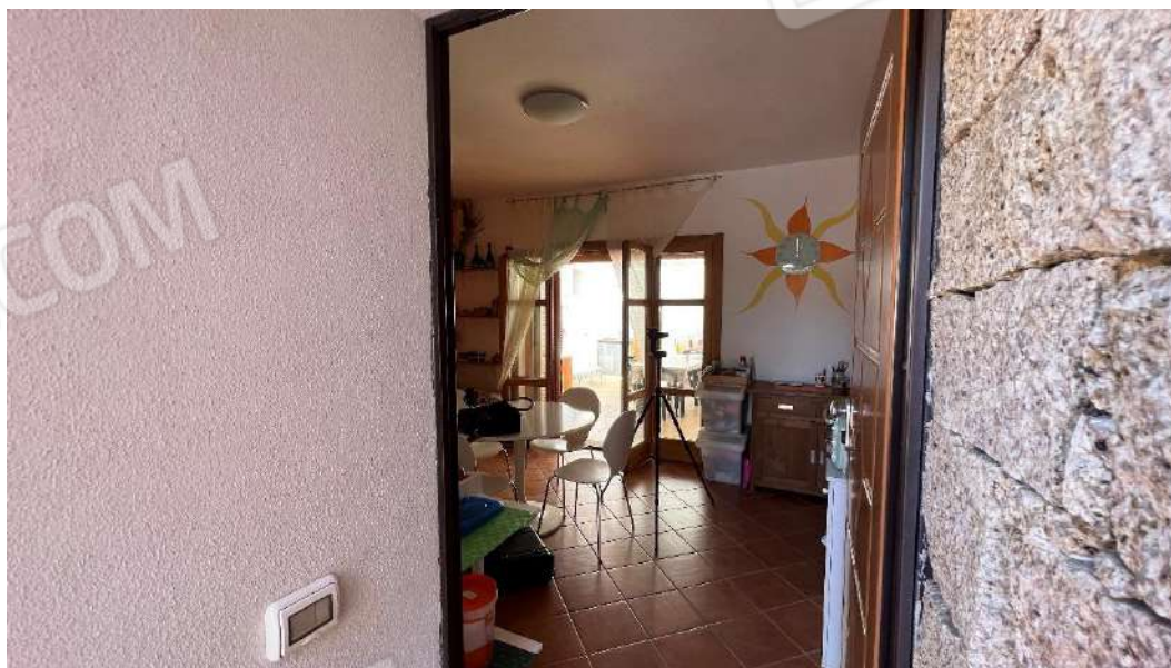
Figura 5 – Viste della facciata di ingresso al subalterno 2 piano terra