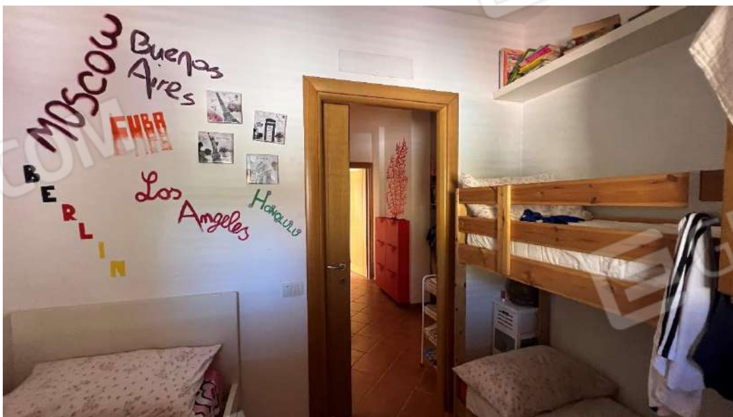
Figura 9 – Viste subalterno 2 piano terra – ripostiglio – attualmente arredato a camera da letto