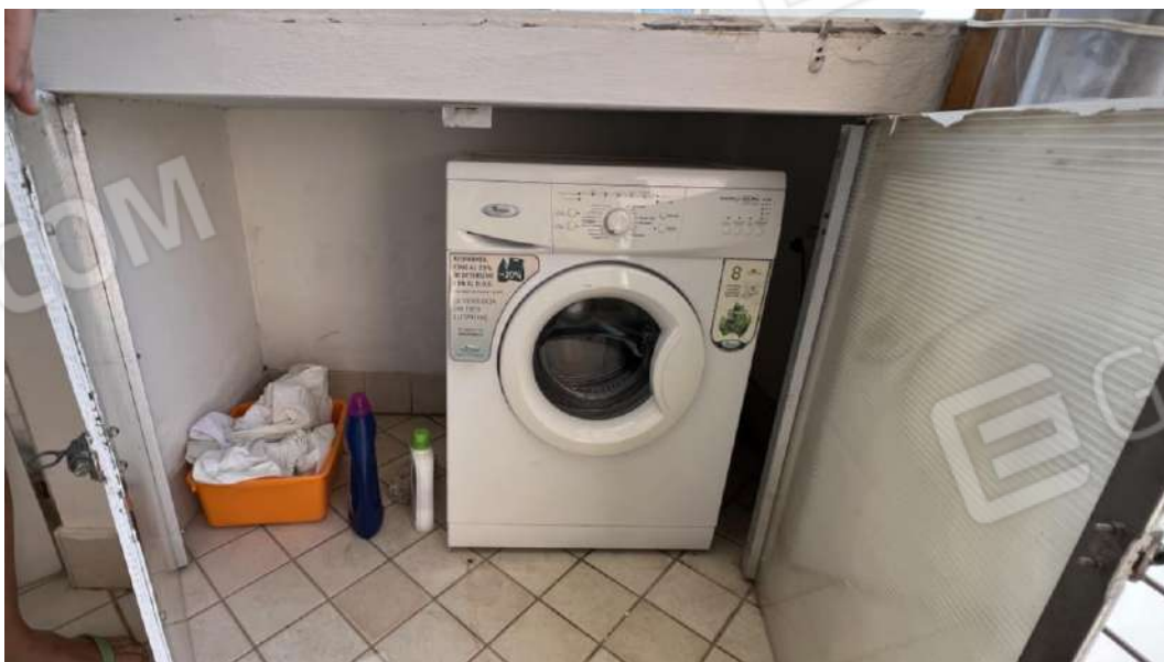
Figura 21 – Viste subalterno 7 piano primo – terrazza con spazio attrezzato a lavanderia