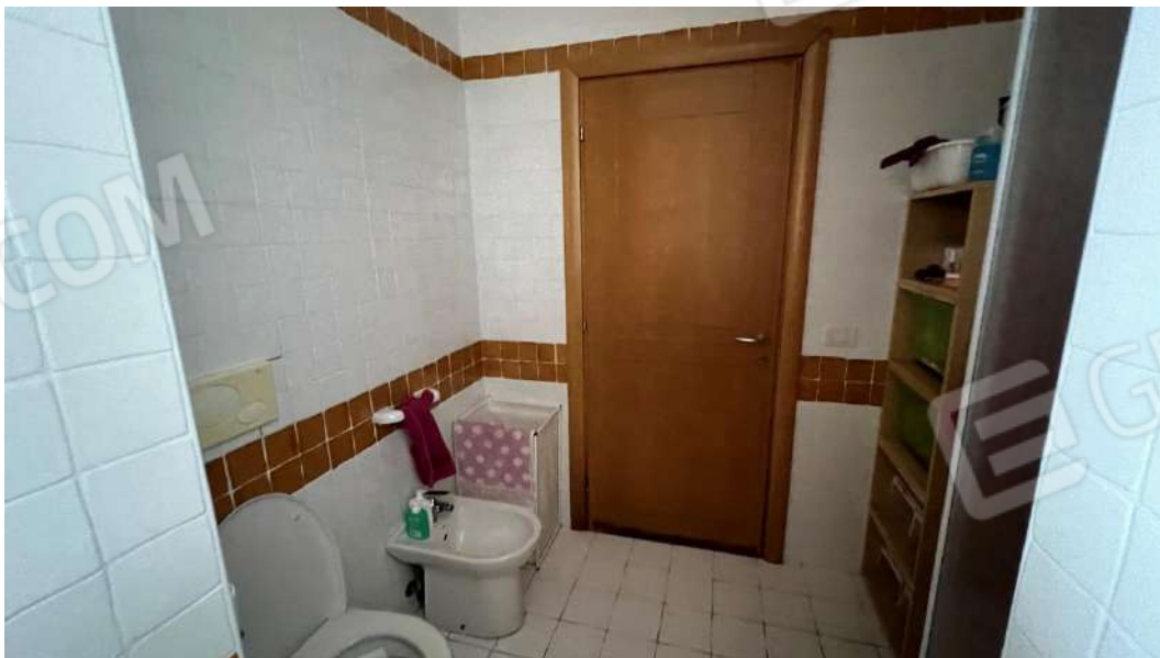
Figura 10 – Viste subalterno 2 piano terra – bagno