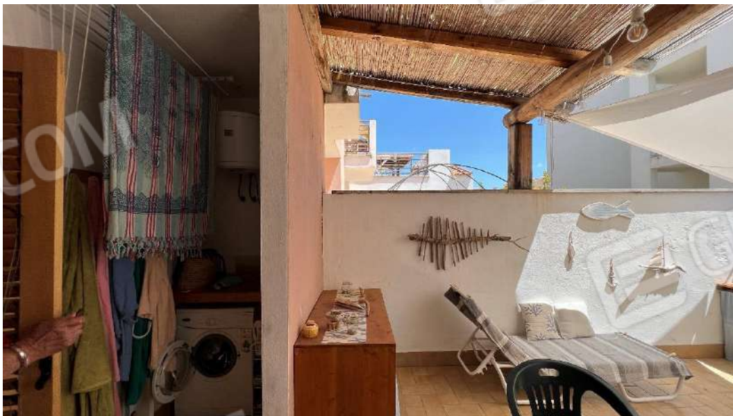
Figura 12 – Viste subalterno 2 piano terra – terrazza con spazio attrezzato a lavanderia