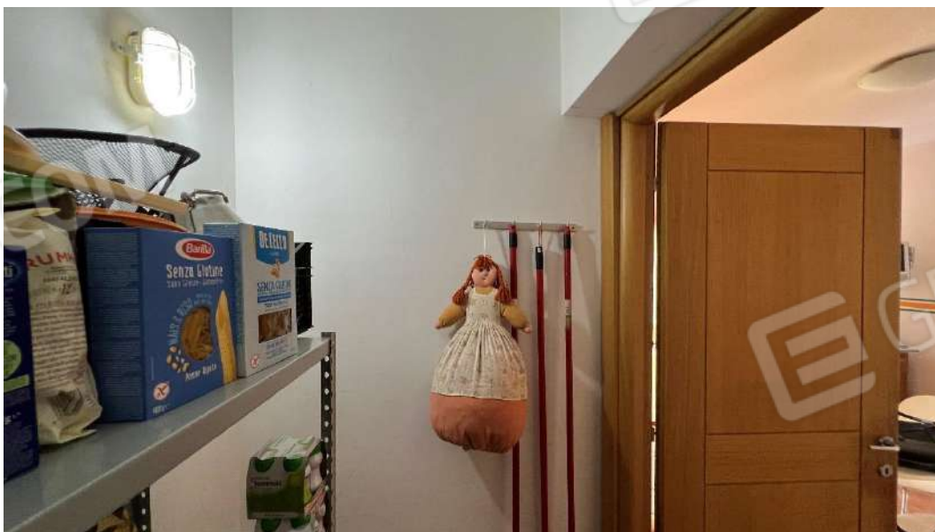
Figura 7 – Viste subalterno 2 piano terra – sottoscala