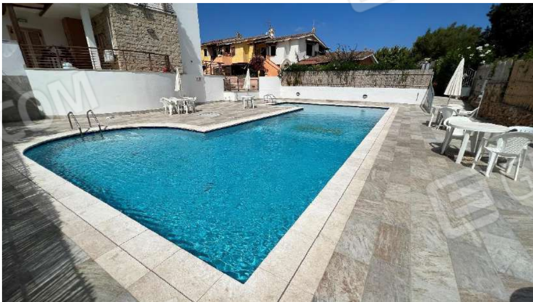
Figura 3 – Viste del complesso residenziale