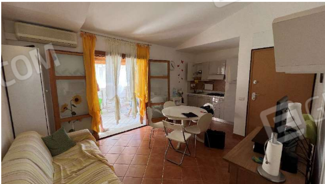
Figura 15 – Viste subalterno 7 piano primo – zona giorno