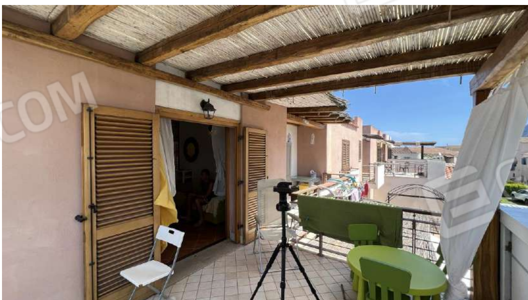
Figura 20 – Viste subalterno 7 piano primo – terrazza