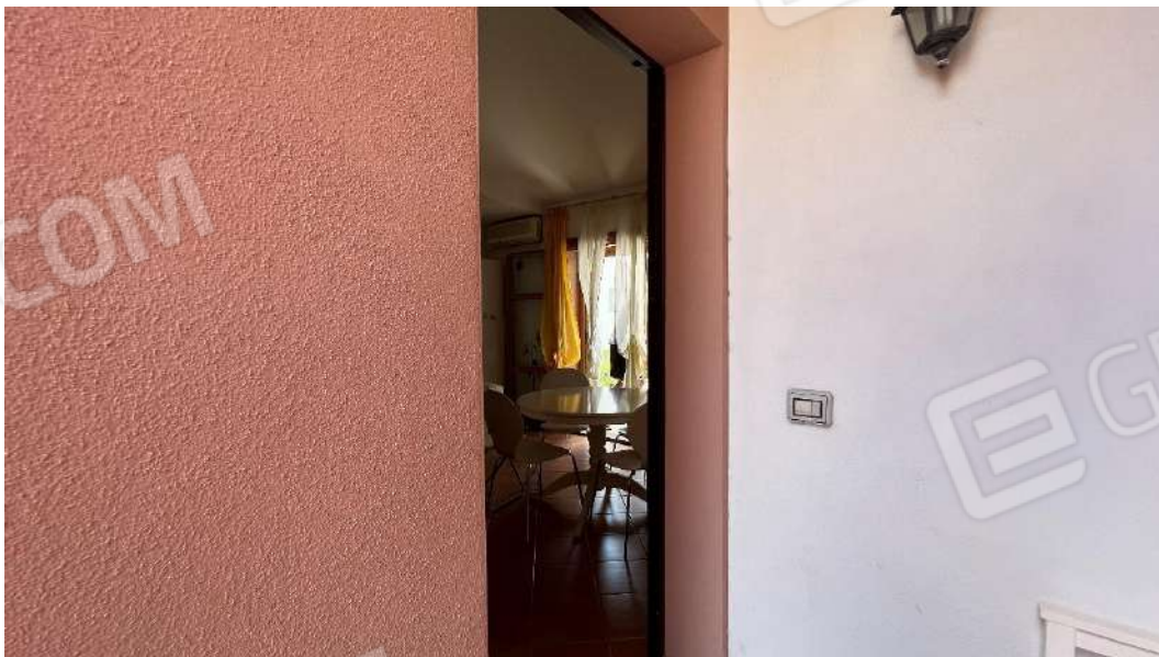
Figura 14 – Viste della facciata di ingresso al subalterno 7 piano primo