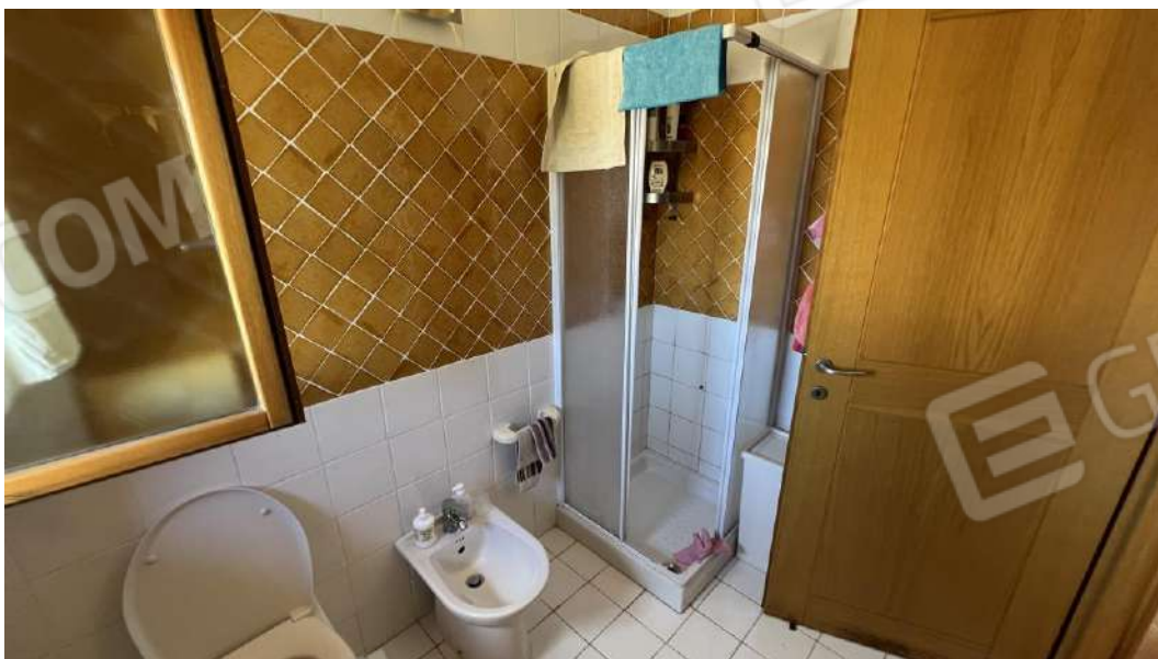
Figura 18 – Viste subalterno 7 piano primo – bagno