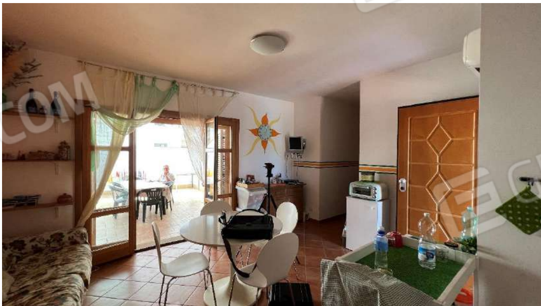
Figura 6 – Viste subalterno 2 piano terra – zona giorno