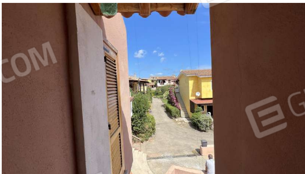
Figura 16 – Viste subalterno 7 piano primo – disimpegno e balconcino