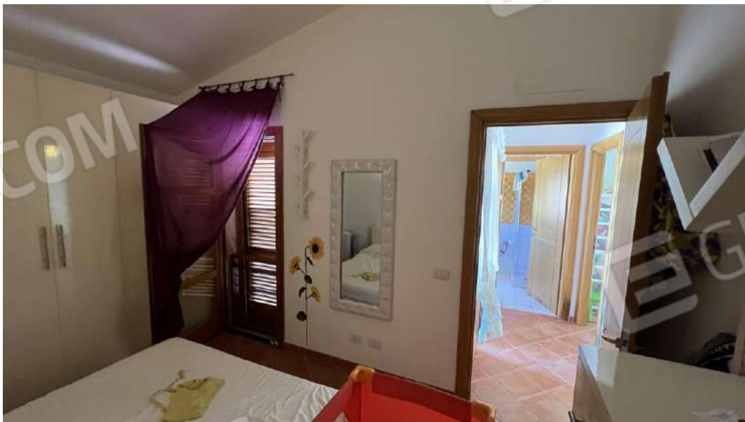
Figura 19 – Viste subalterno 7 piano primo – camera da letto