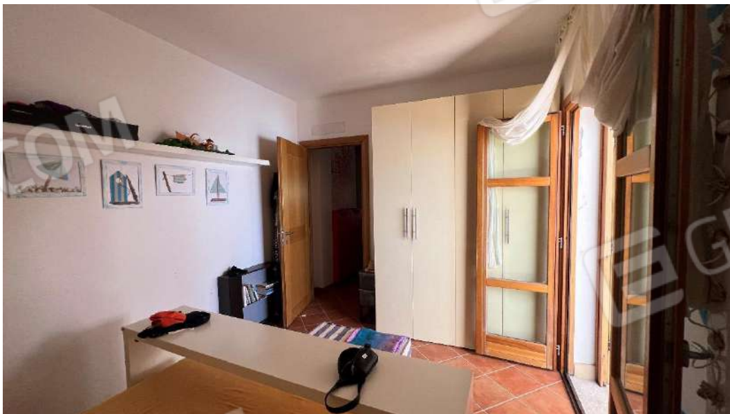
Figura 11 – Viste subalterno 2 piano terra – camera da letto