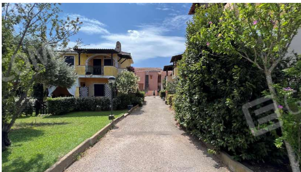
Figura 1 – Viste del complesso residenziale