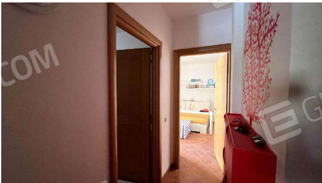
Figura 8 – Viste subalterno 2 piano terra – disimpegno