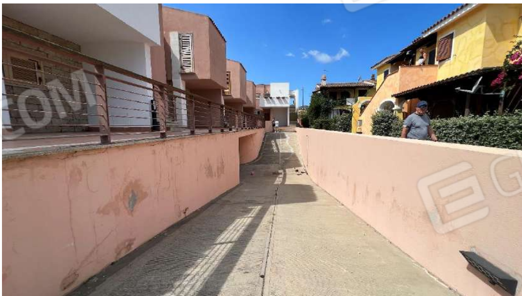
Figura 2 – Viste del complesso residenziale