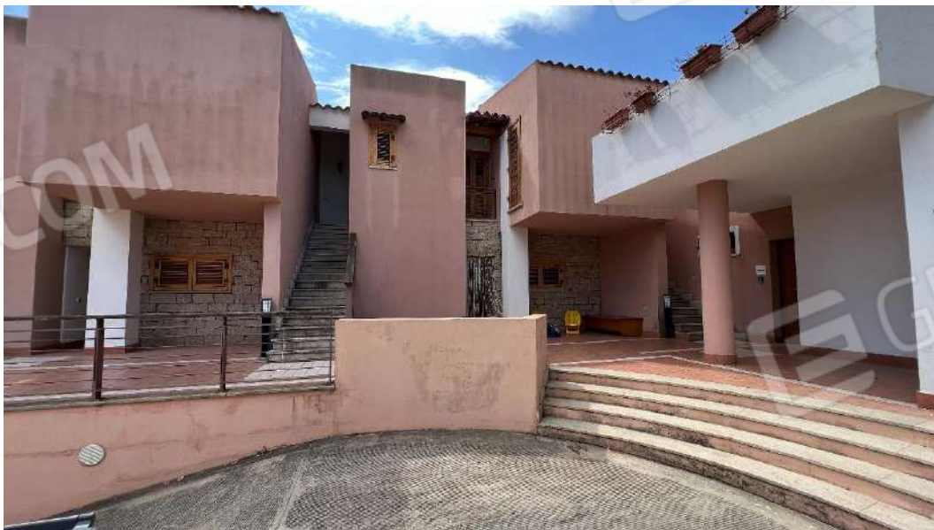
Figura 4 – Viste della piscina ornamentale