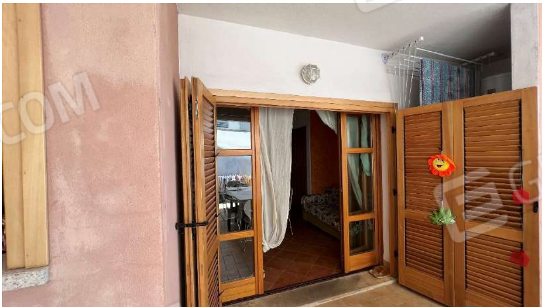
Figura 13 – Viste subalterno 2 piano terra – terrazza