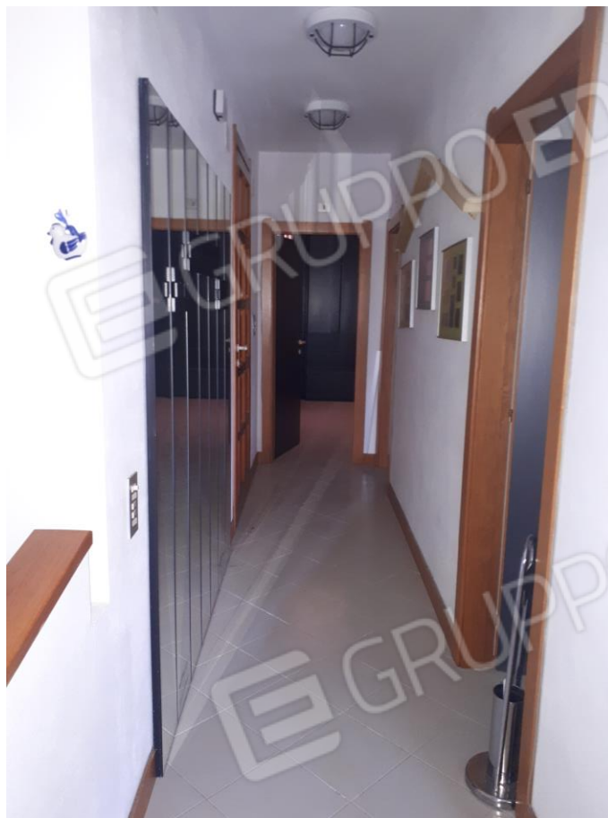
Foto 11 Interno appartamento .