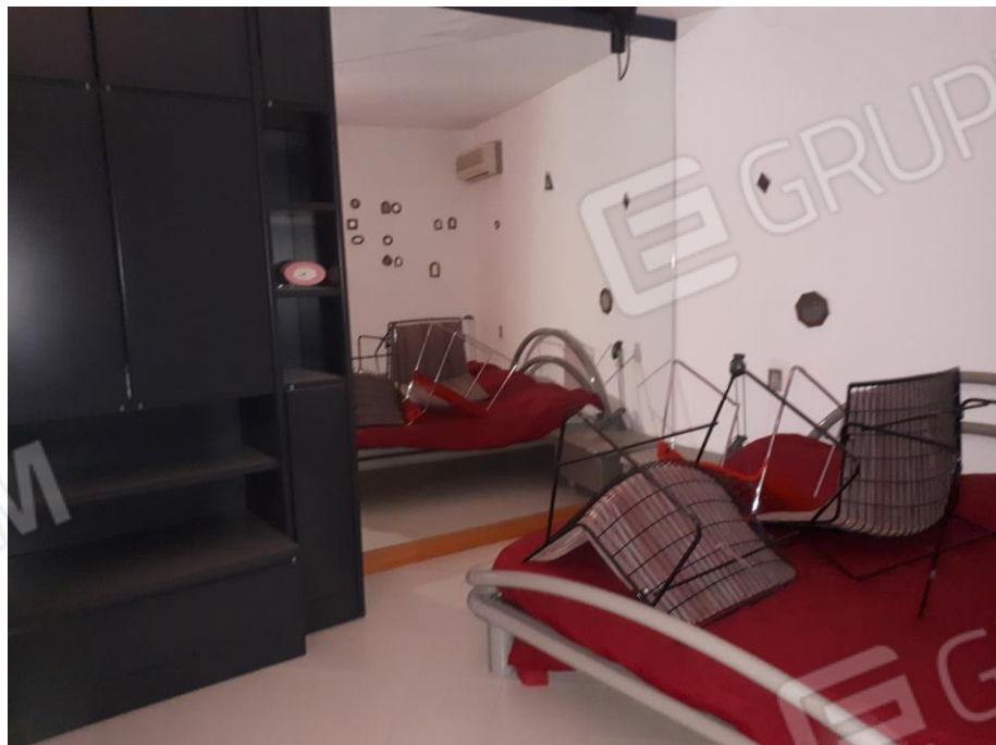
Foto 17 Camera.