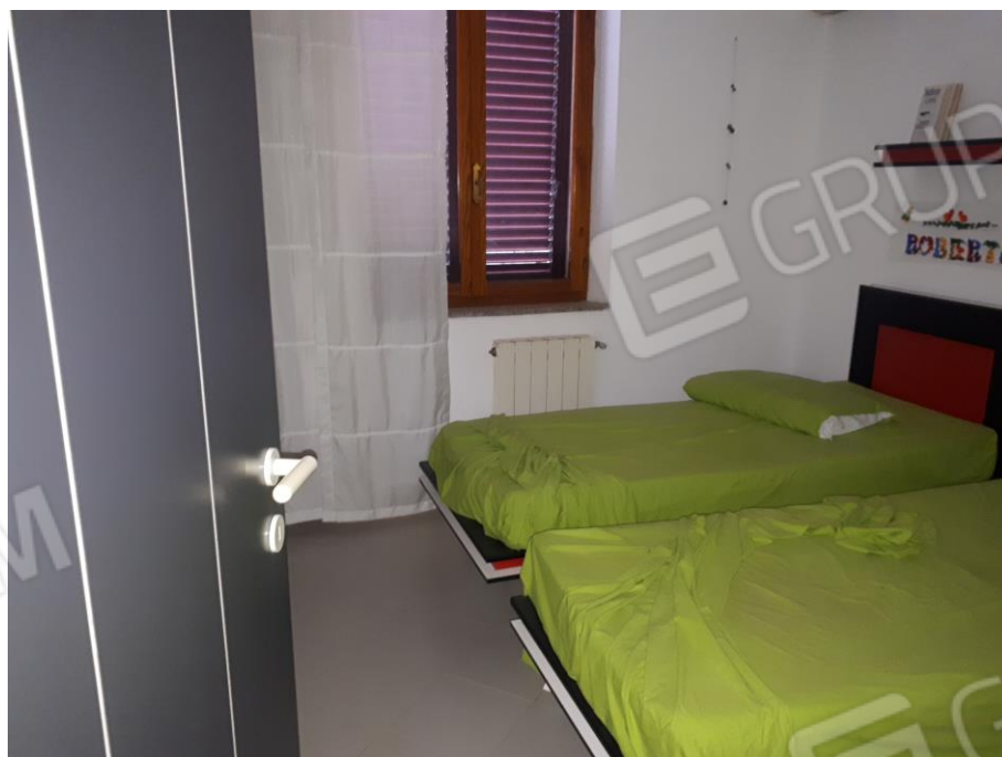
Foto 14 Camera matrimoniale