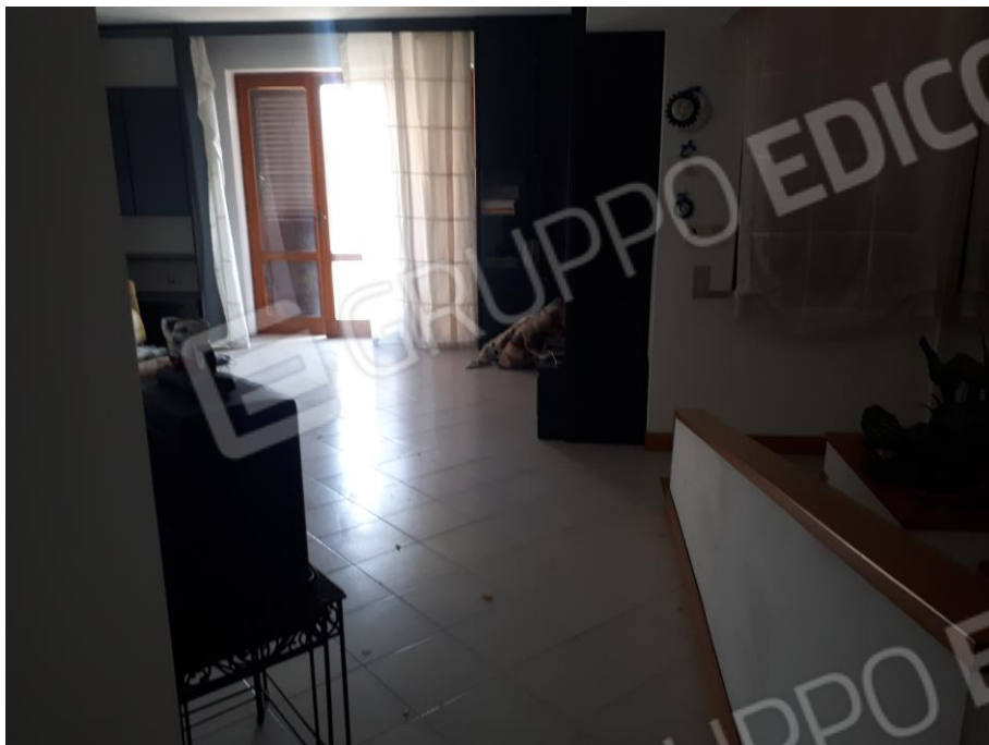
Foto 5 Soggiorno.