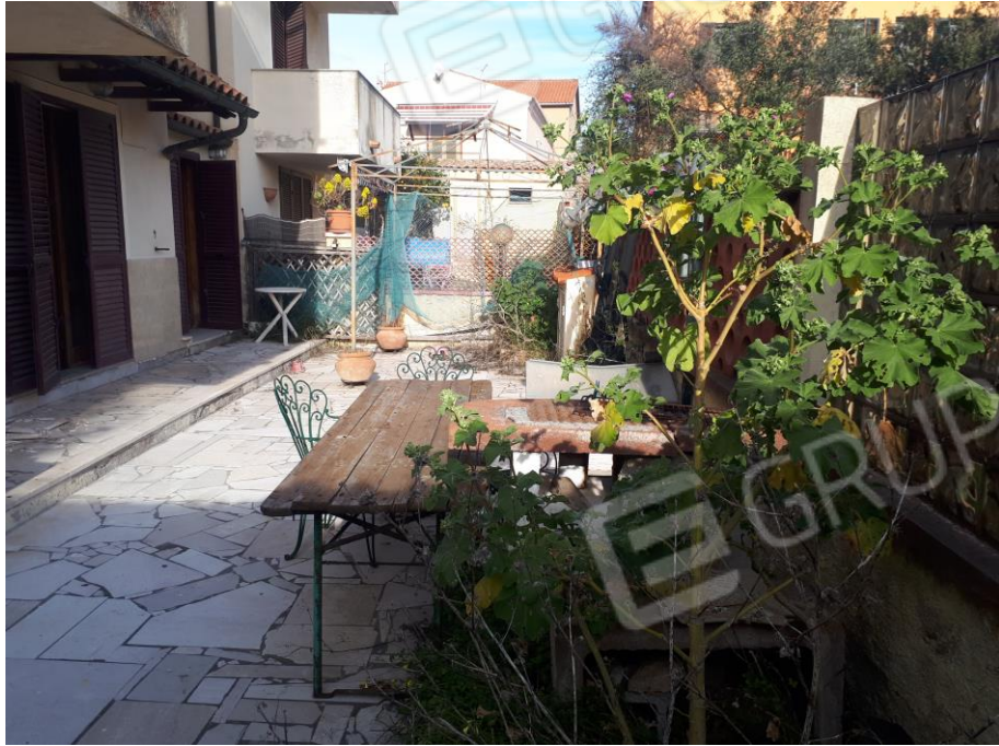
Foto 25 Cortile.