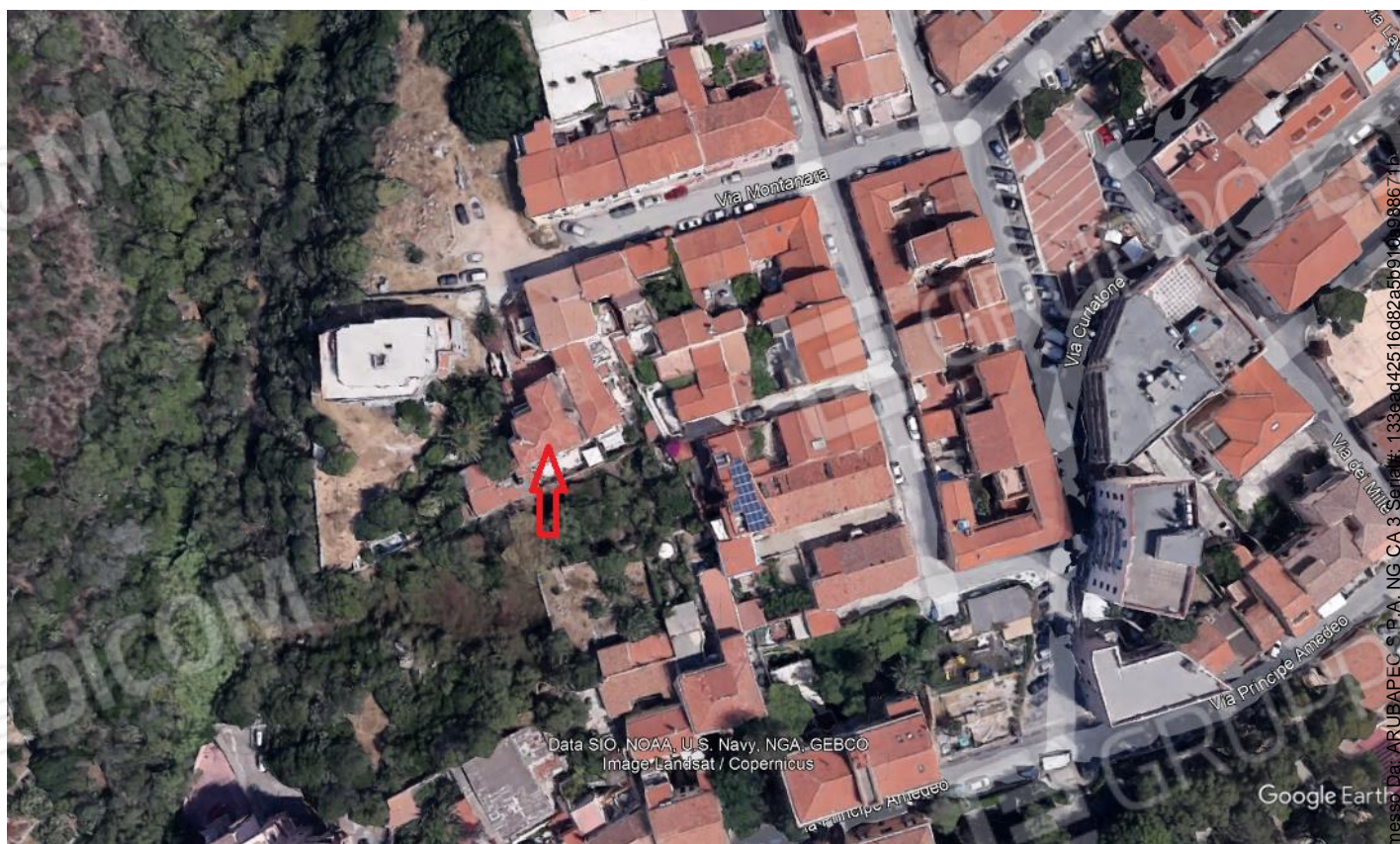
Foto 2 Contestualizzazione dell'immobile, la freccia indica la posizione dell' immobile oggetto di perizia.