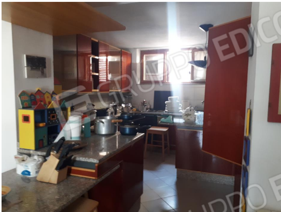
Foto 20 Cucina al piano seminterrato.