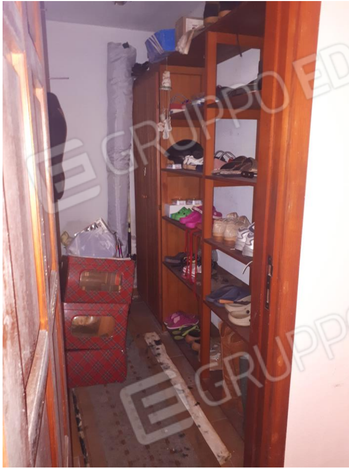
Foto 22 Ripostiglio.