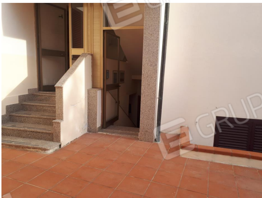
Foto 4 Accesso al piano seminterrato da B.C.N.C..