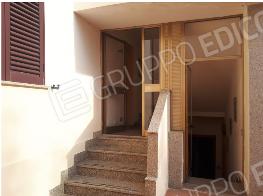
Foto 26 Esterno.