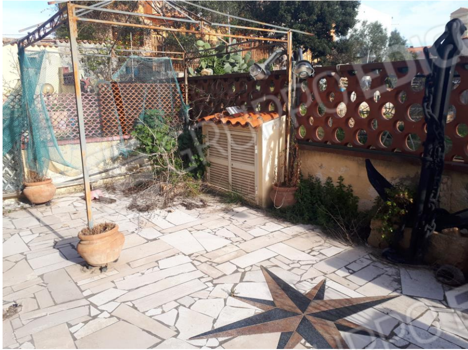
Foto 24 Cortile.