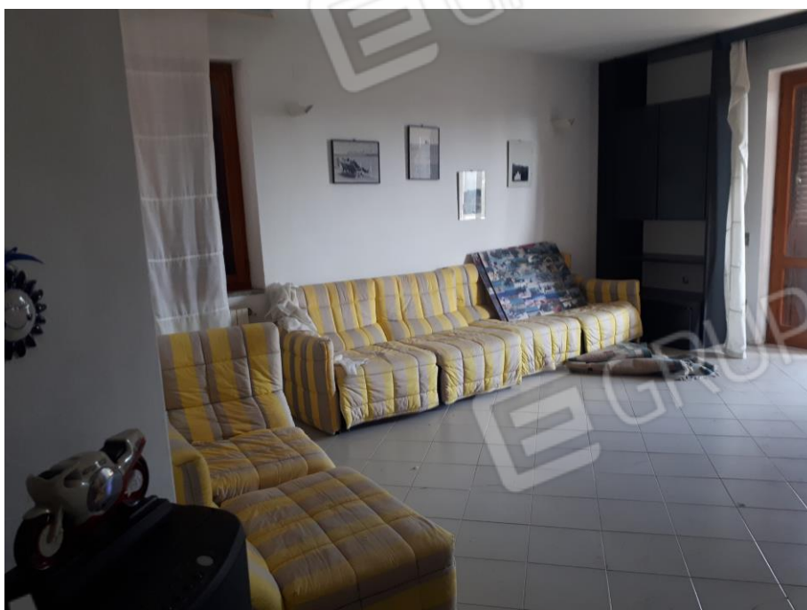
Foto 8 Zona giorno.