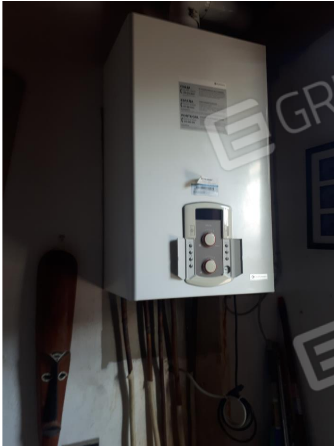
Foto 23 Centrale termica.