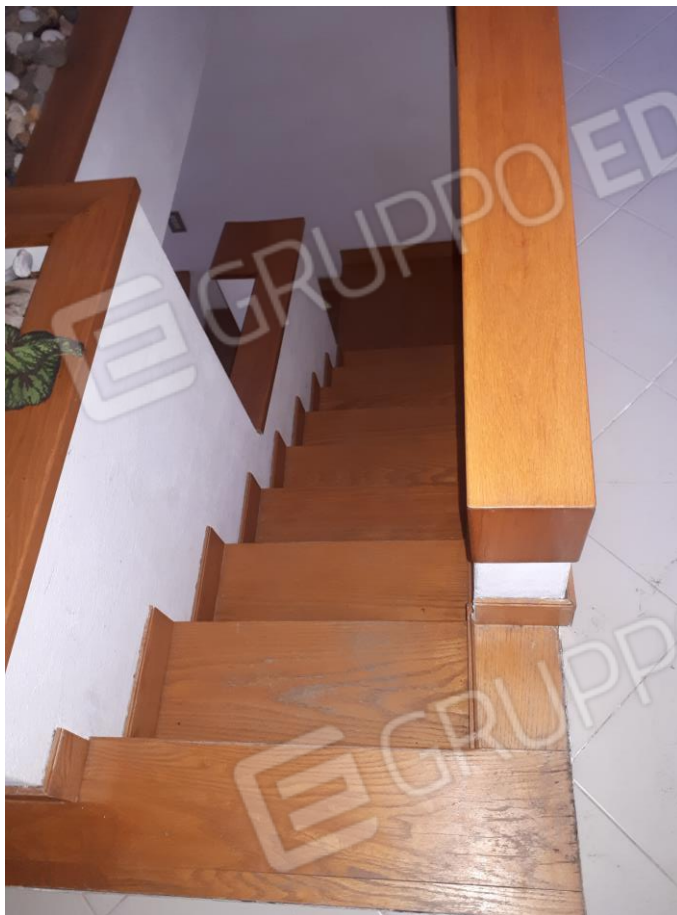
Foto 18 Scale di accesso al piano seminterrato.