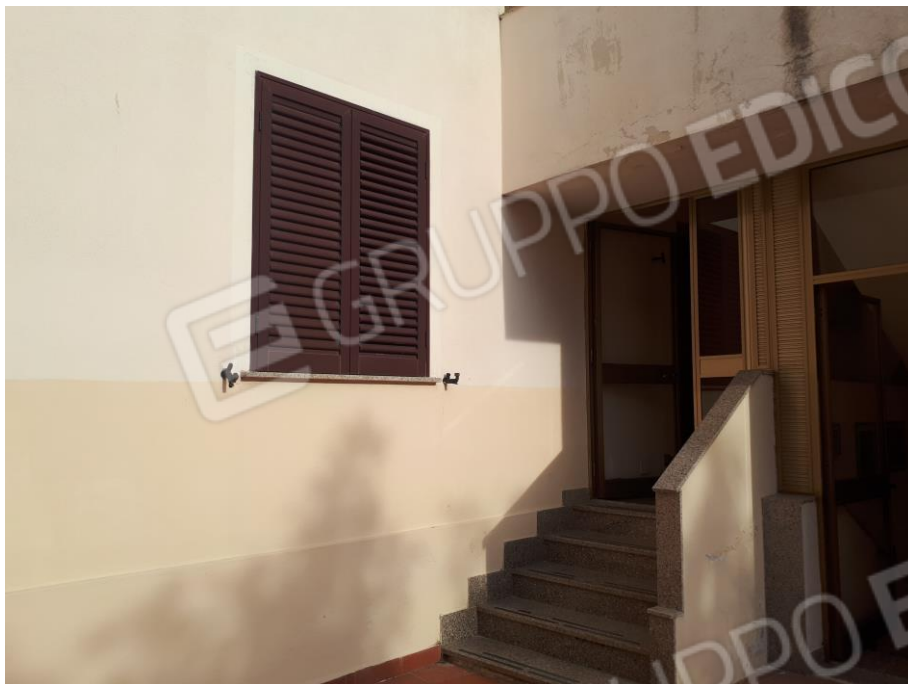
Foto 3 Ingresso all'unità immobiliare da via Montanara, da cortile interno B.C.N.C..