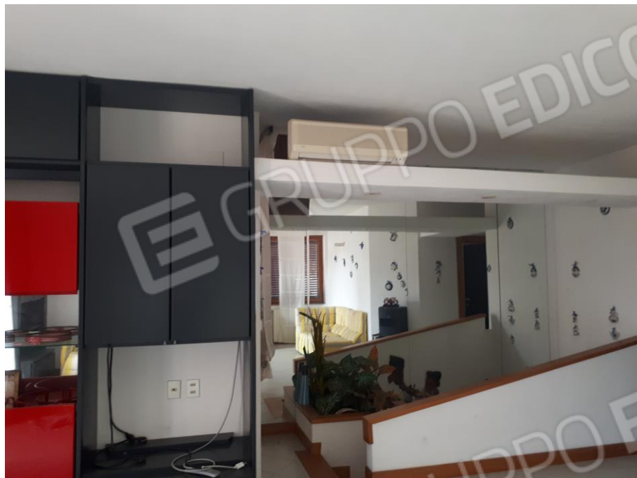
Foto 9 interno dell' unità immobiliare.