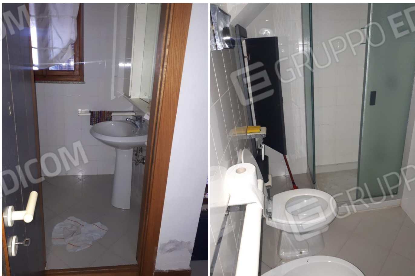
Foto 19 Bagno.